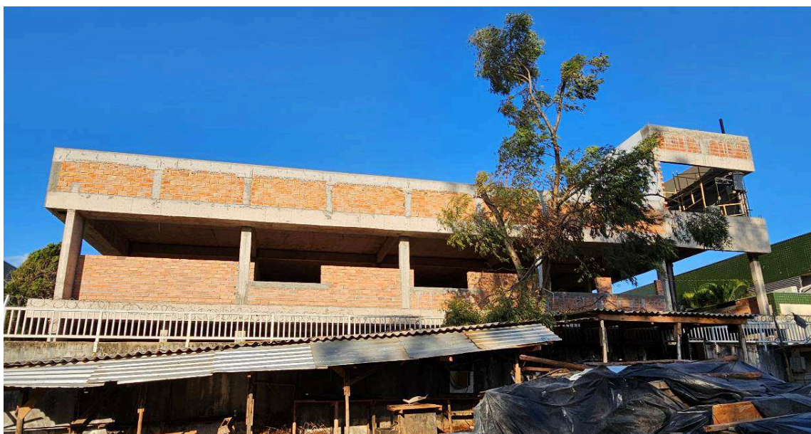
Figura 1 – Vista externa da ampliação.

Conforme o cronograma contratual deveria ter sido executado 8,33% do item 01 (Administração de obra), 9,10% do item 02 (Instalação do Canteiro de Obras), 11,54% do item 03 (Ampliação do Fórum Trabalhista), 4,09% do item 04 (Reforma do Fórum – Edificação Existente), 0,00% do item 05 (Serviços Externos - Estacionamento e Passeio Público), 0,00% do item 06 (Limpeza Final), 4,07% do item 07 (Instalações Elétricas), 0,00% do item 08 (Instalações de Rede Lógica, Sonorização e Alarme), e 0,00% do item 09 (Sistema de Proteção Contra Descargas Atmosféricas). Porém, a Contratada executou 8,33% do item 01, 9,28% do item 02, 4,07% do item 03, 7,66% do item 04, 0,00% do item 05, 0,00% do item 06, 0,00% do item 07, 0,00% do item 08, e 0,00% do item 09.