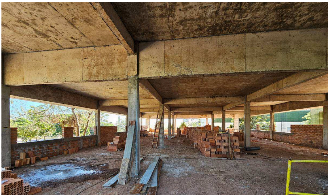
Figura 2 – Vista interna da ampliação.