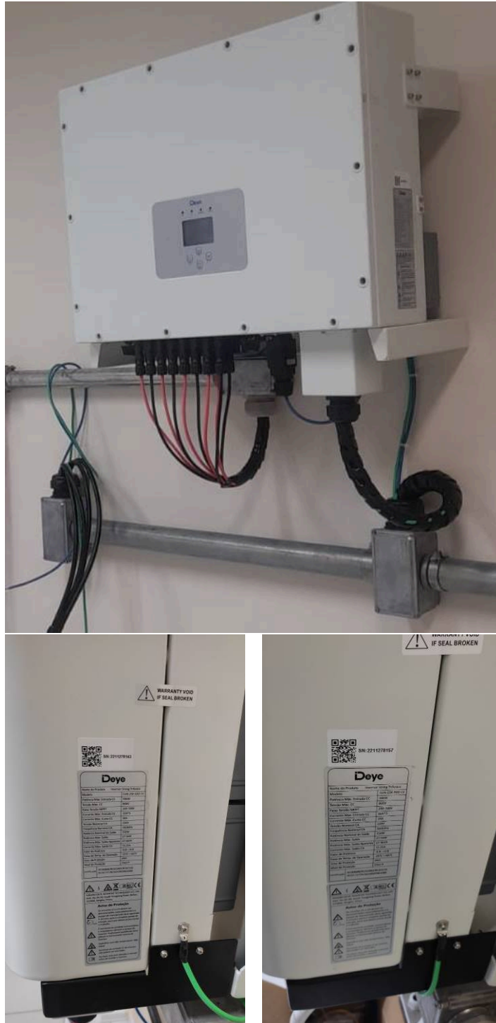
Figuras 02 – Proteções e inversores instalados – Francisco Beltrão