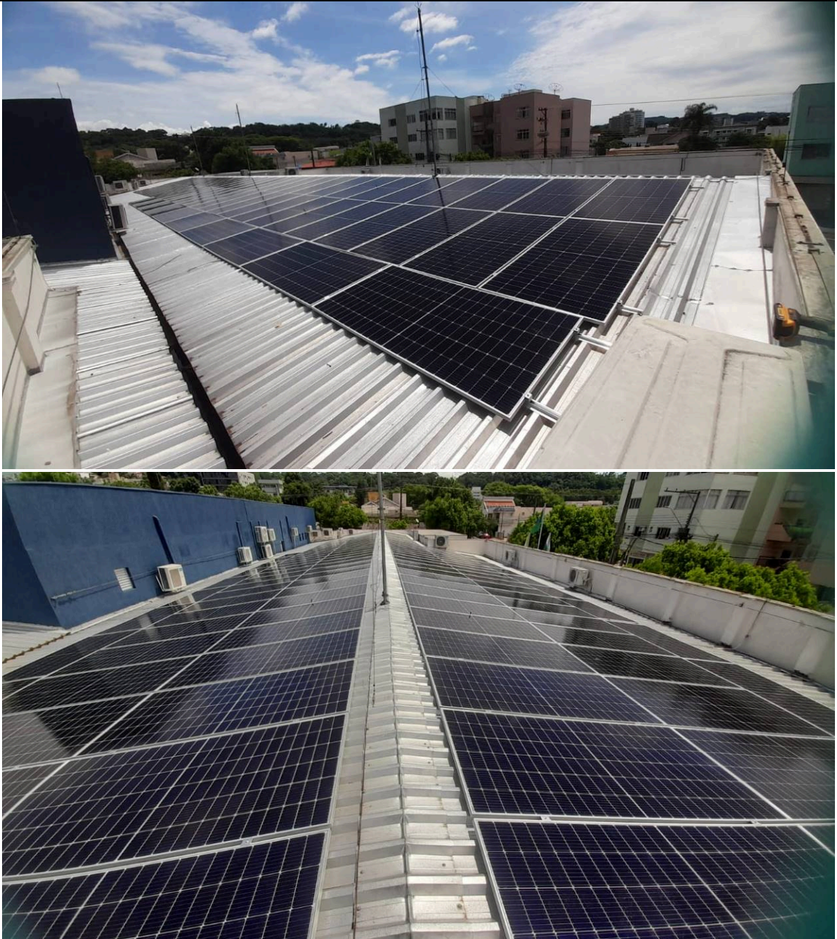
Figuras 01 – Cobertura com placas instaladas – Francisco Beltrão