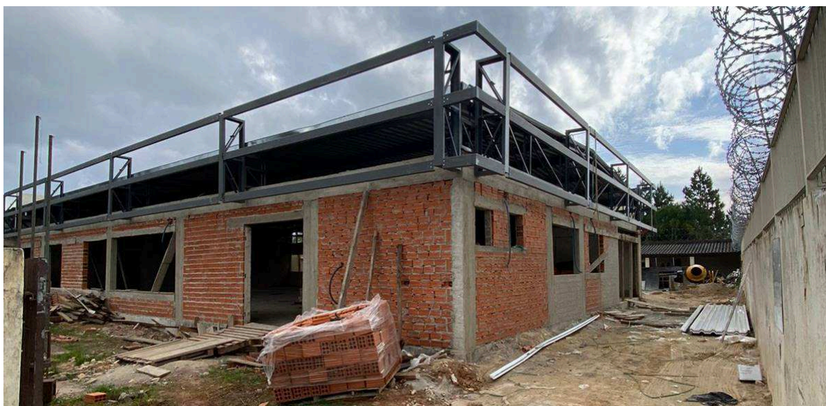
Figura 2 – Vista externa – edifício frontal.