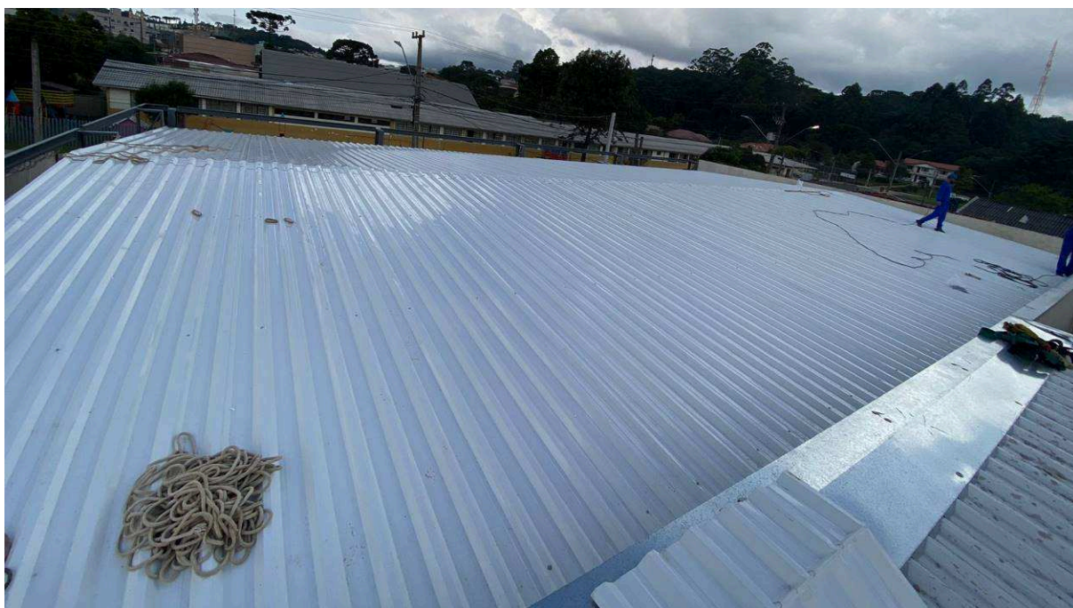
Figura 1 – Cobertura – edifício frontal.

0,00% do item 04 (Infra-estrutura), 6,74% do item 05 (Supra-estrutura), 12,16% do item 06 (Paredes e painéis), 24,60% do item 07 (Esquadrias), 82,42% do item 08 (Cobertura), 0,00% do item 09 (Impermeabilização e tratamentos), 49,25% do item 10 (Revestimentos internos), 80,00% do item 11 (Revestimentos externos), 78,20% do item 12 (Pisos internos/externos), 69,31% do item 13 (Rodapés, soleiras e peitoris), 23,21% do item 14 (Instalações hidrossanitárias), 14,76% do item 15 (Climatização), 0,00% do item 16 (Instalações de prevenção contra incêndios), 60,81% do item 17 (Paisagismo e serviços externos), 3,74% do item 18 (Pinturas), 0,00% do item 19 (Serviços complementares), 0,00% do item 20 (Limpeza da obra), 10,84% do item 21 (Instalações elétricas), 5,51% do item 22 (Instalações lógicas, CFTV, telefonia e alarme), e 15,85% do item 23 (1º Termo Aditivo). Porém, a Contratada executou 9,90% do item 01, 2,26% do item 02, 0,00% do item 03, 0,00% do item 04, 9,38% do item 05, 12,16% do item 06, 0,00% do item 07, 67,96% do item 08, 0,00% do item 09, 59,35% do item 10, 71,07% do item 11, 0,00% do item 12, 0,00% do item 13, 0,00% do item 14, 0,00% do item 15, 0,00% do item 16, 0,00% do item 17, 0,00% do item 18, 0,00% do item 19, 0,00% do item 20, 3,05% do item 21, 1,25% do item 22, e 9,10% do item 23.