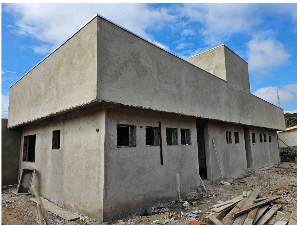
Figura 3 – Vista externa – edifício ampliação.