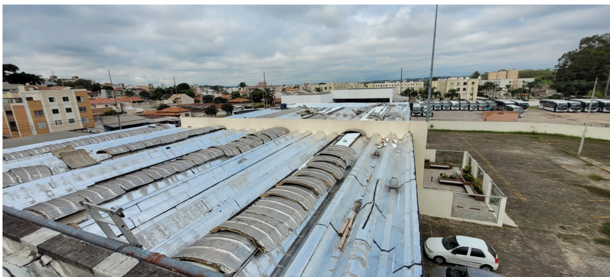
Figura 01 – Impermeabilização da cobertura