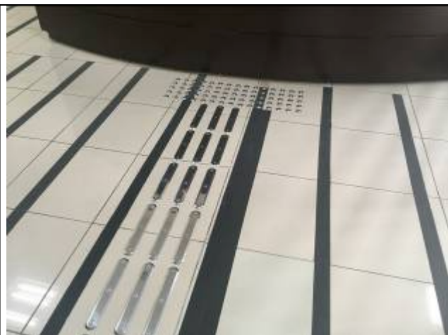
Figura 07: Piso tátil direcional inox.