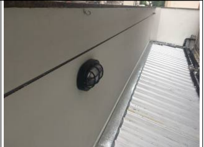
Figura 03: Luminária externa.