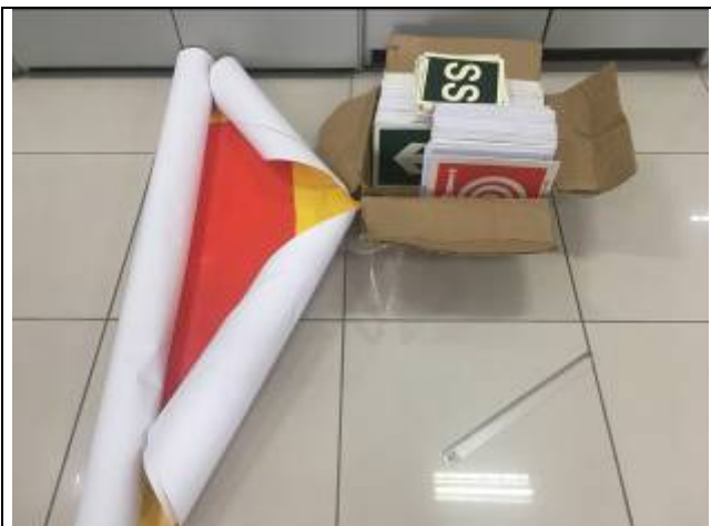
Figura 01: Fornecimento de placas de comunicação visual.