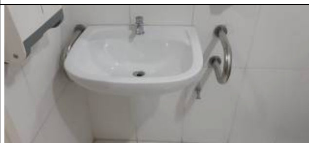
Figura 09: Barra de apoio – lavatório PNE.