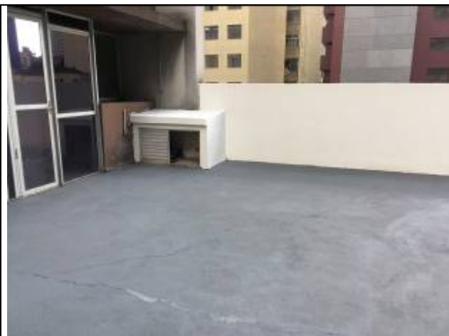
Figura 04: Pintura de piso.