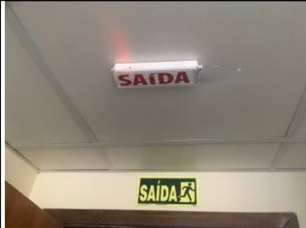
Figura 02: Luminária de emergência