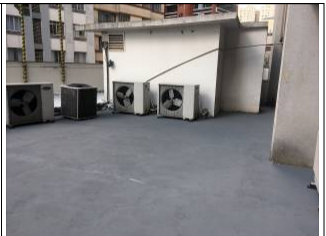
Figura 05: Pintura de piso.