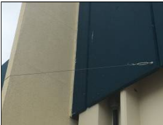
Figura 03 – Estrutura steel frame estaiada.