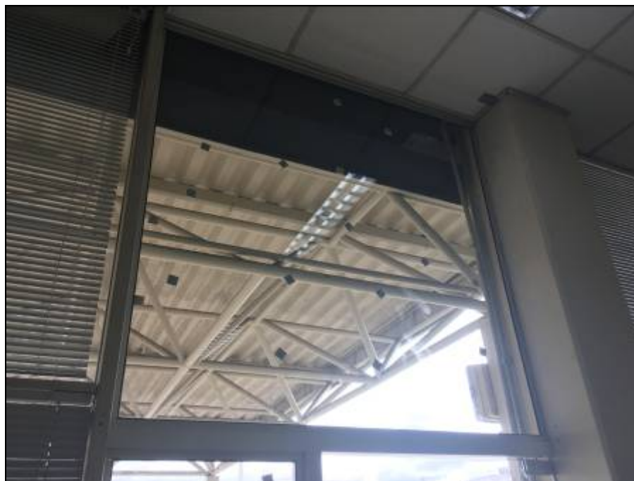
Figura 01 – área de caixilho e vidro temperado complementada