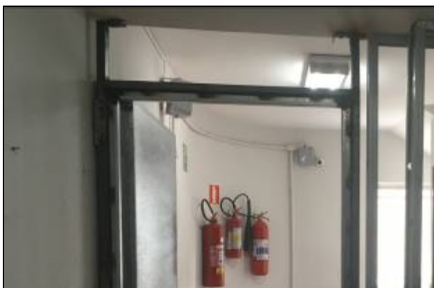
Figura 08 – Quadro de reforço para instalação de porta corta-fogo.

II.3.1 - Plugue fêmea 2P+T, 250 V, 10 A padrão NBR 14136