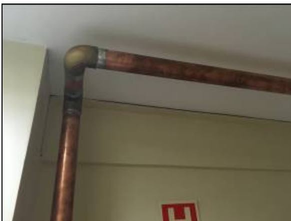
Figura 02 – Tubulação e conexões de cobre.