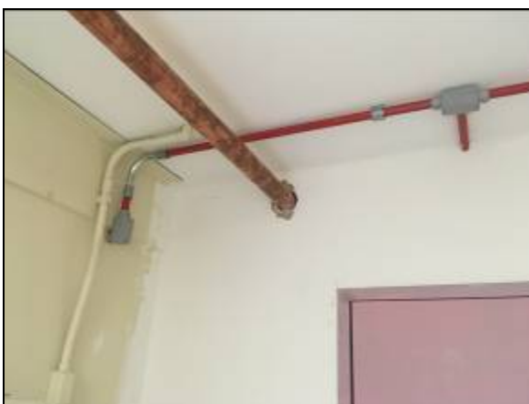
Figura 04 – Tubulação e conexões de cobre.