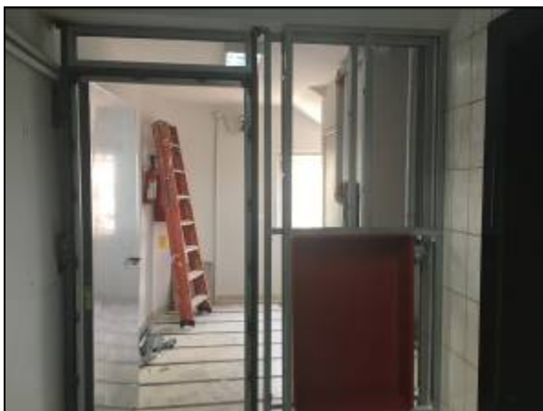
Figura 05 – Quadro em perfil U fixado na laje e no piso

Executado o reforço dos quadros junto às paredes de dry-wall visando a instalação das portas corta-fogo.