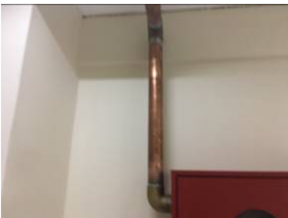
Figura 03 – Tubulação e conexões de cobre.