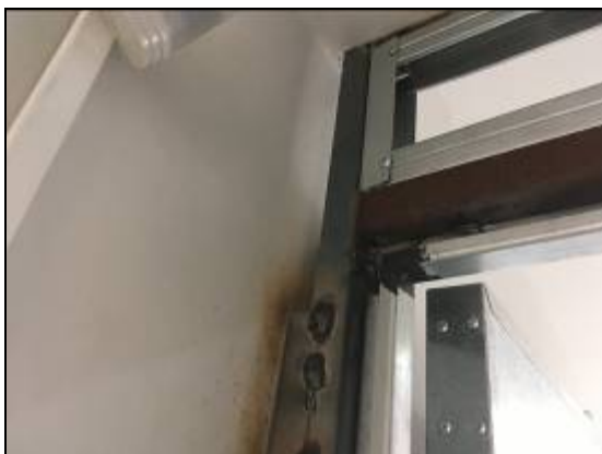
Figura 06 – Perfil U de reforço.