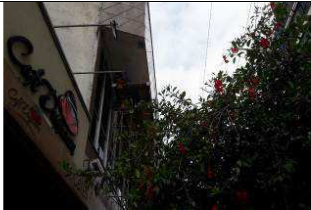
Figura 14: Pintura teto marquise.

FISCALIZAÇÃO DE OBRAS - FORNECIMENTO E INSTALAÇÃO DE ESTRUTURA METÁLICA E BRISES DO IMÓVEL 147 DO TRIBUNAL REGIONAL DO TRABALHO DO PARANÁ