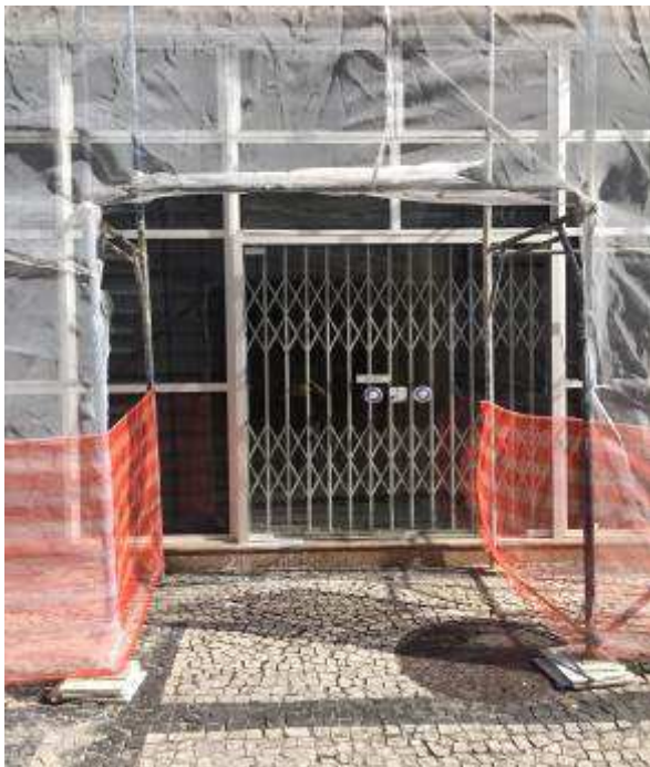
Figura 20: Nova porta de vidro temperado na entrada.