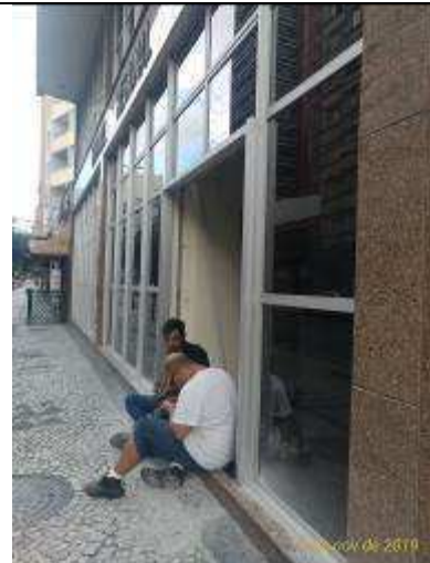
Figura 09: Remoção da porta entrada.