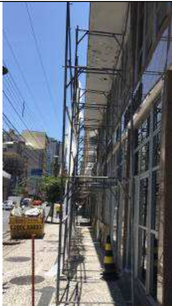
Figura 04: Instalação andaimes.