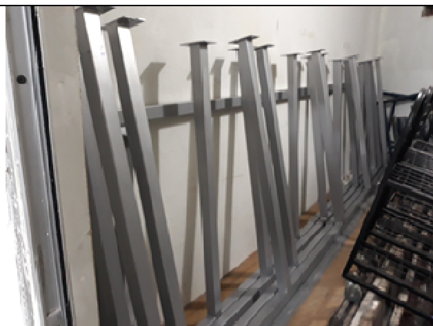
Figura 18: Pintura sobre superfície metálica.