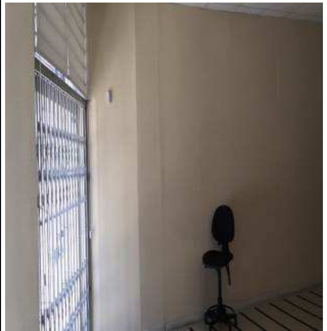
Figura 21: Nova porta de vidro temperado na entrada.