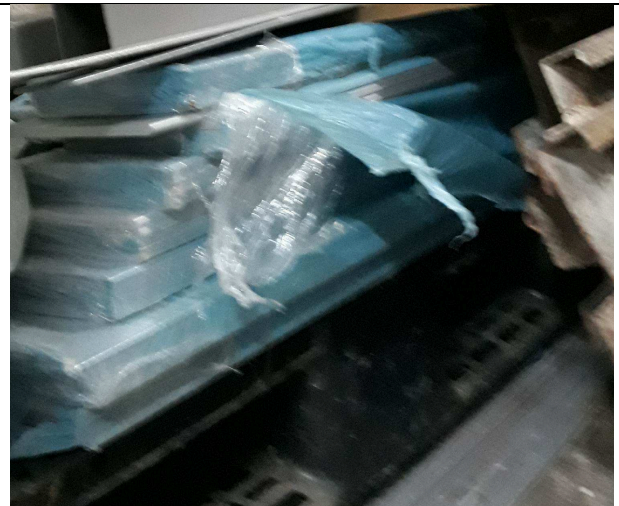
Figura 13: Aletas em alumínio