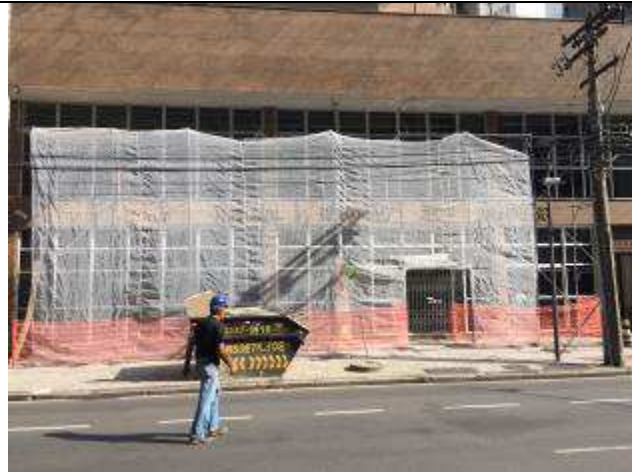
Figura 02: Estrutura andaimes.

FISCALIZAÇÃO DE OBRAS - FORNECIMENTO E INSTALAÇÃO DE ESTRUTURA METÁLICA E BRISES DO IMÓVEL 147 DO TRIBUNAL REGIONAL DO TRABALHO DO PARANÁ