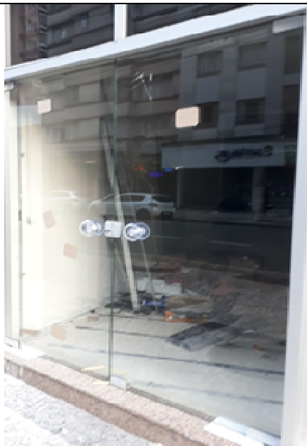
Figura 22: Nova porta de vidro temperado na entrada