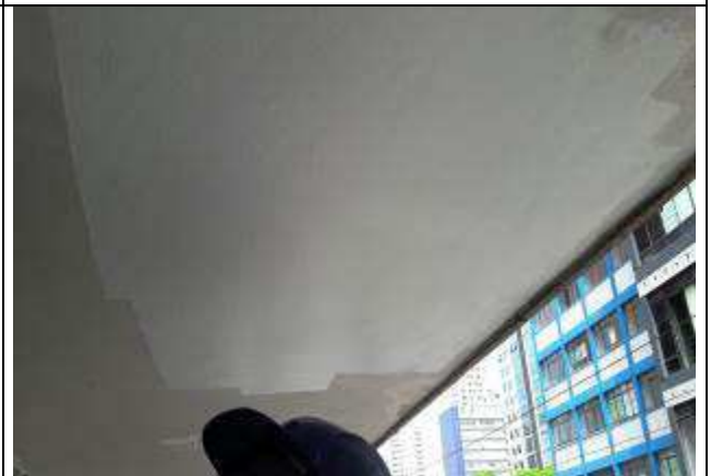
Figura 17: Pintura teto marquise.