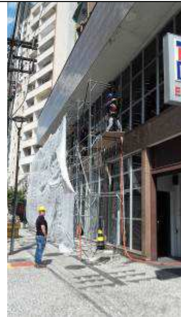
Figura 05: Estrutura andaimes.