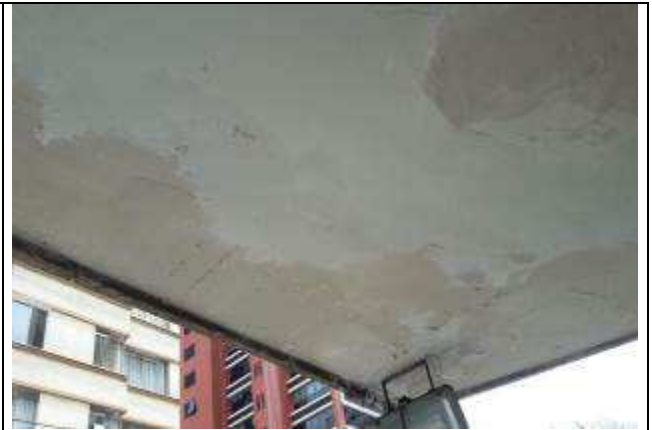
Figura 15: Pintura teto marquise.