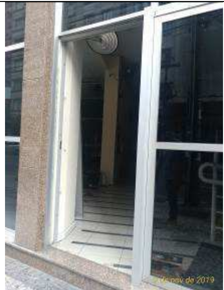
Figura 07: Remoção da porta entrada.