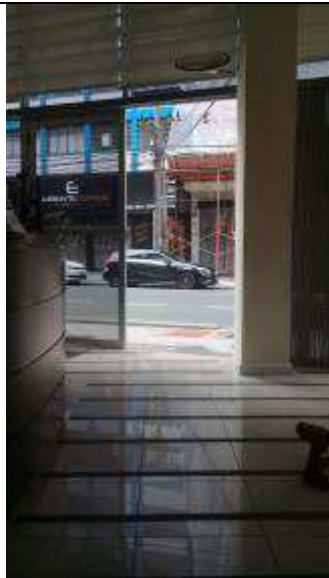
Figura 06: Remoção da porta entrada.

FISCALIZAÇÃO DE OBRAS - FORNECIMENTO E INSTALAÇÃO DE ESTRUTURA METÁLICA E BRISES DO IMÓVEL 147 DO TRIBUNAL REGIONAL DO TRABALHO DO PARANÁ