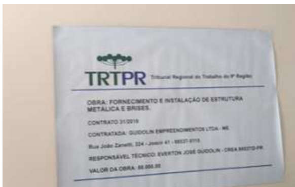
Figura 01: Placa de obra