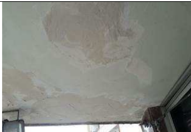
Figura 16: Pintura teto marquise.