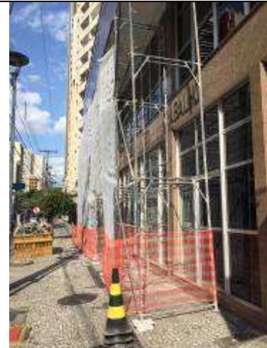
Figura 03: Instalação andaimes.