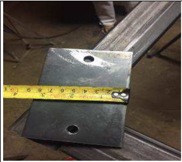
Figura 11: Estrutura em aço para apoio.