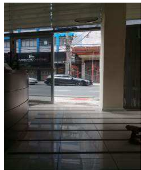
Figura 23: Nova porta de vidro temperado na entrada.