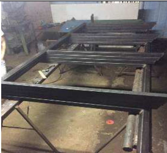
Figura 10: Estrutura em aço para apoio

FISCALIZAÇÃO DE OBRAS - FORNECIMENTO E INSTALAÇÃO DE ESTRUTURA METÁLICA E BRISES DO IMÓVEL 147 DO TRIBUNAL REGIONAL DO TRABALHO DO PARANÁ