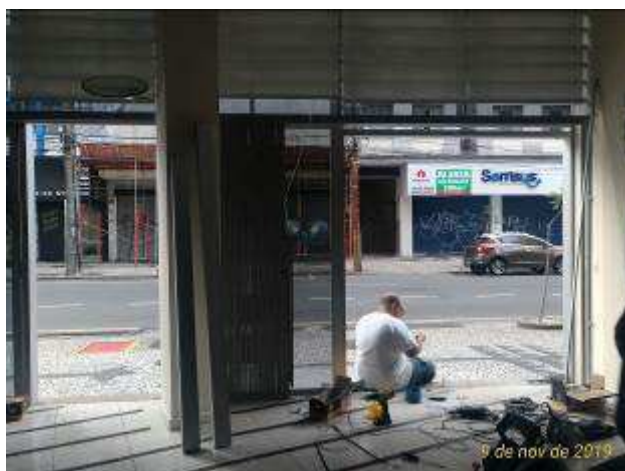
Figura 08: Remoção da porta entrada.