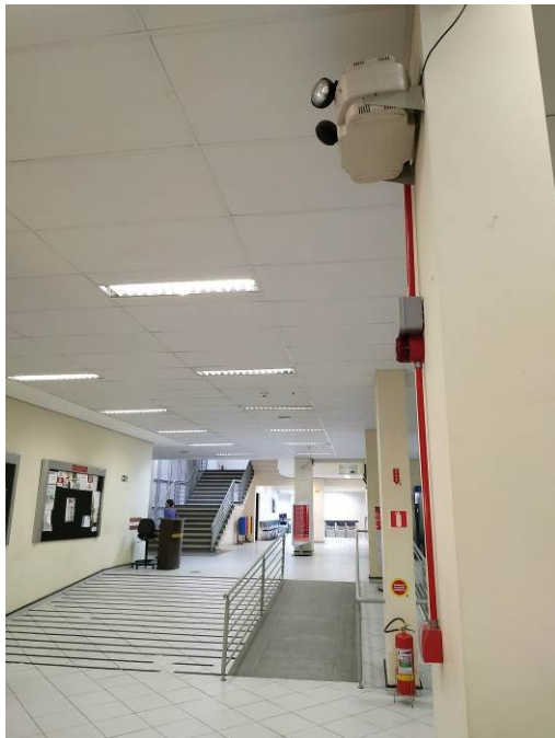
Figura 01: Hall do Fórum de Curitiba com sistema de alarme em funcionamento