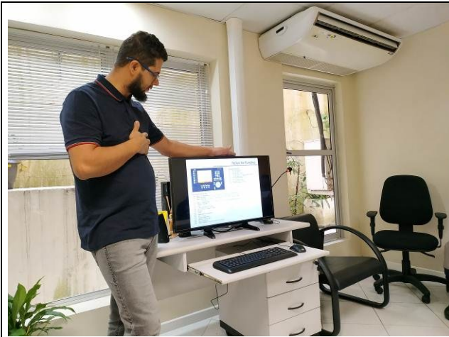
Figura 07: Treinamento para operação do sistema