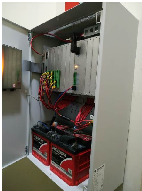
Figura 05: Central de alarme em funcionamento - vista interna