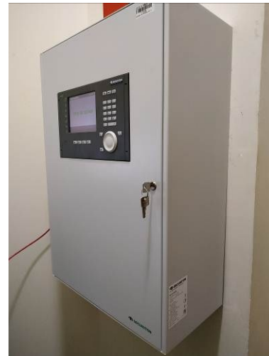
Figura 04: Central de alarme em funcionamento