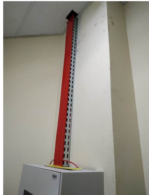
Figura 02: Infraestrutura para passagem e distribuição do cabeamento (central de alarme)