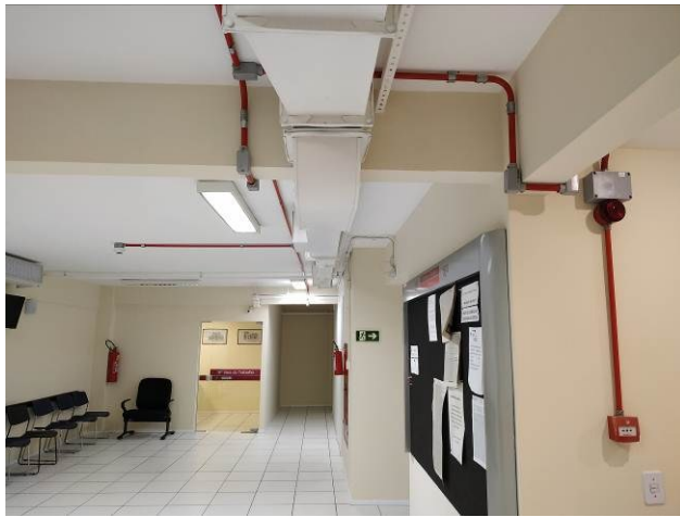
Figura 03: Primeiro pavimento do Fórum com sistema de alarme em funcionamento