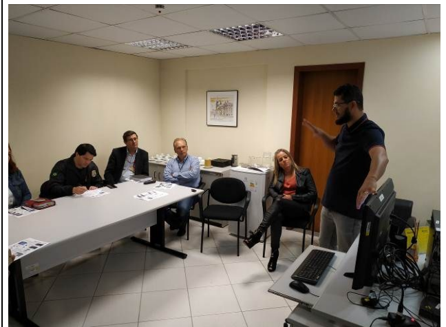
Figura 06: Treinamento para operação do sistema