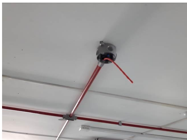
Figura 05: Infraestrutura sobreloja/1º andar