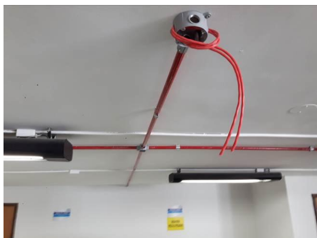
Figura 07: Infraestrutura sobreloja/1º andar