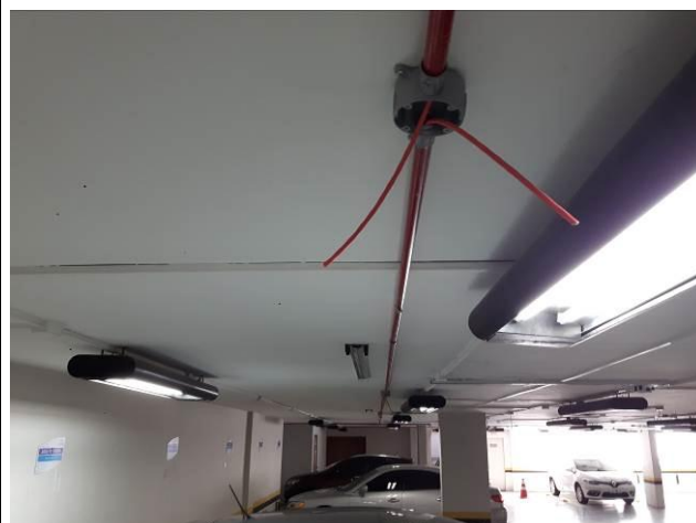
Figura 06: Infraestrutura sobreloja/1º andar