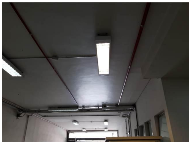
Figura 03: Infraestrutura térreo