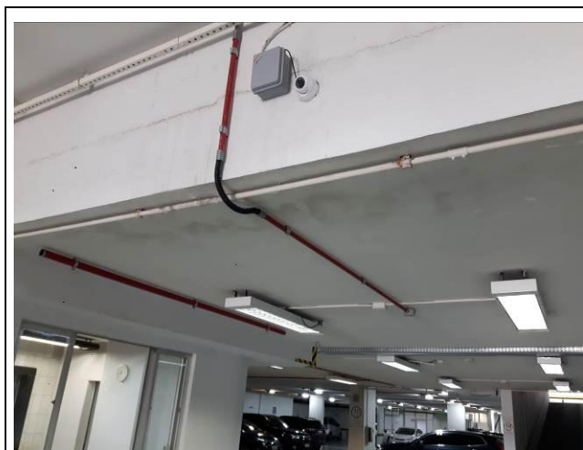
Figura 01: Infraestrutura térreo