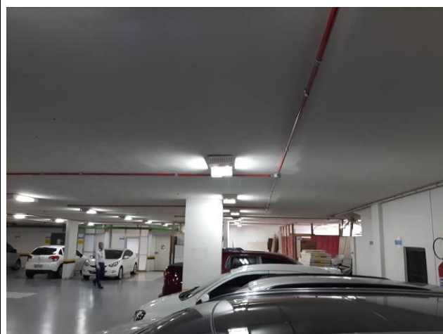
Figura 08: Eletroduto flexível metálico