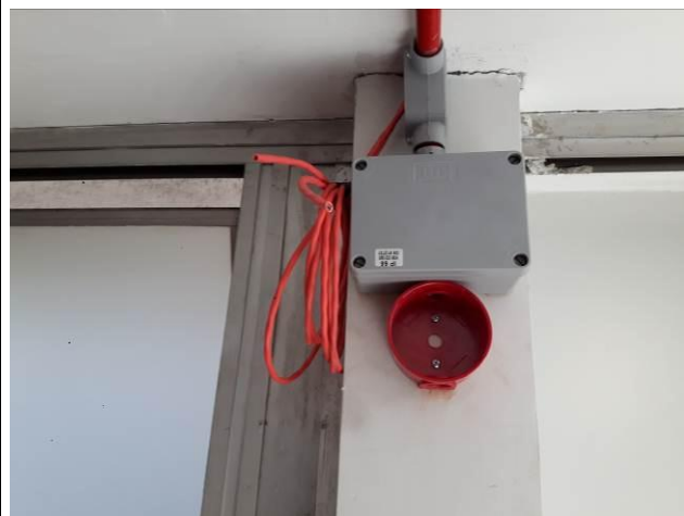
Figura 04: Infraestrutura térreo