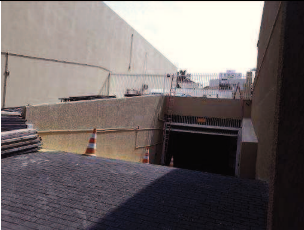
Figura 09: Pintura no muro da entrada da garagem.

FISCALIZAÇÃO DE OBRAS - PINTURA E RESTAURO DO IMÓVEL CASARÃO DO TRIBUNAL REGIONAL DO TRABALHO DO PARANÁ