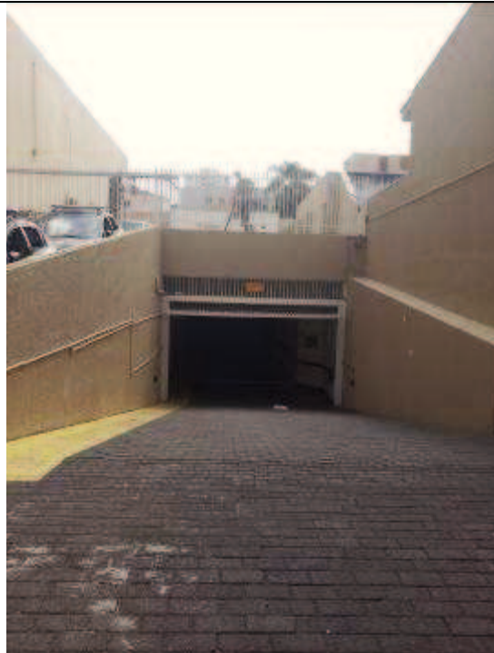
Figura 10: Pintura no muro da entrada da garagem.