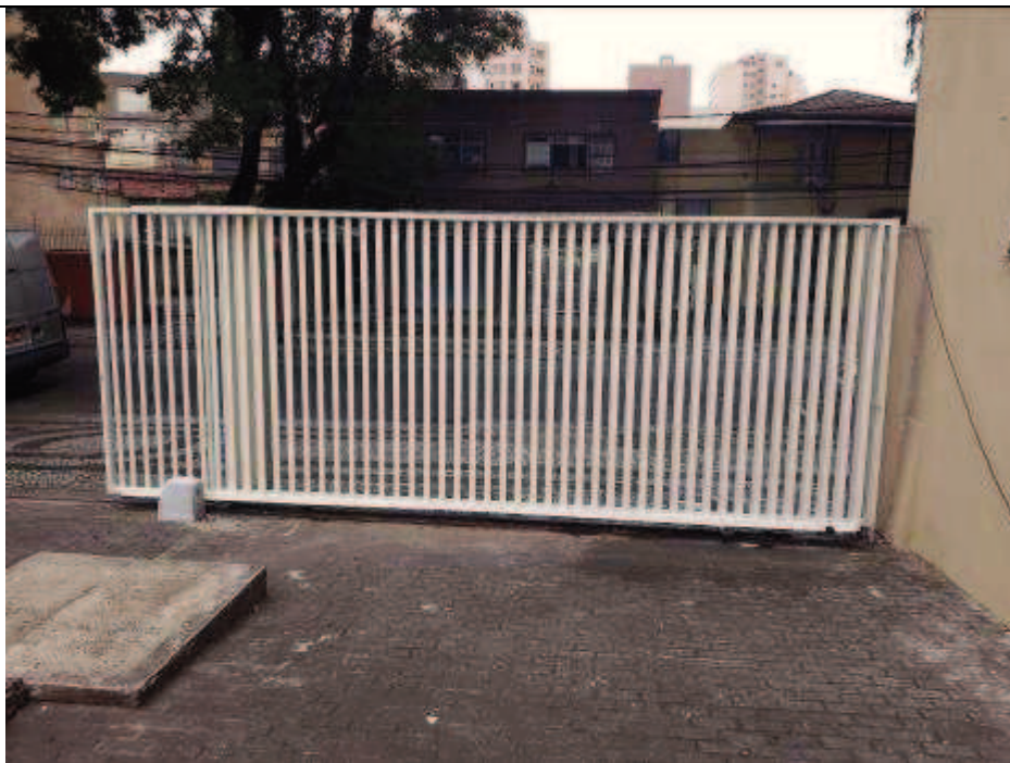
Figura 12: Pintura do gradil