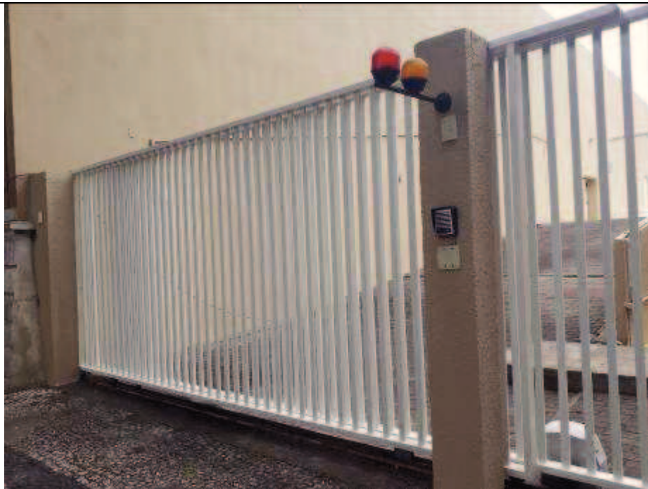
Figura 14: Pintura do gradil