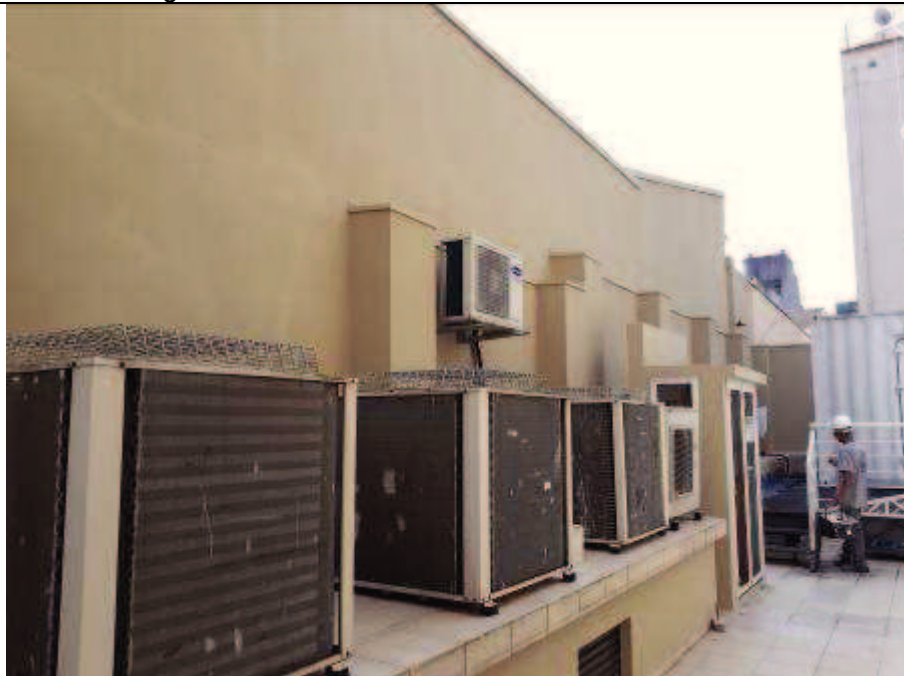
Figura 06: Pintura no muro dos fundos do imóvel