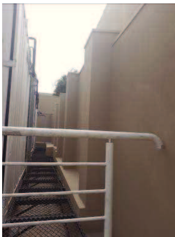
Figura 04: Pintura do muro lateral.