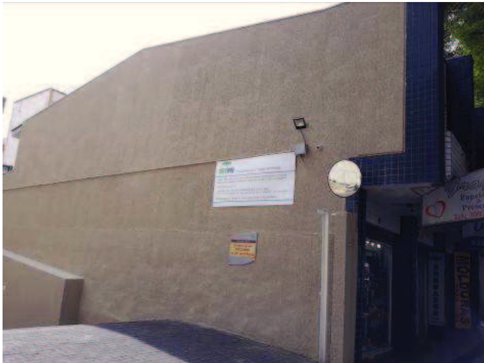
Figura 08: Pintura no muro da entrada da garagem.