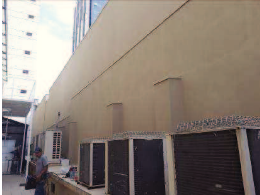
Figura 07: Pintura no muro dos fundos do imóvel

FISCALIZAÇÃO DE OBRAS - PINTURA E RESTAURO DO IMÓVEL CASARÃO DO TRIBUNAL REGIONAL DO TRABALHO DO PARANÁ