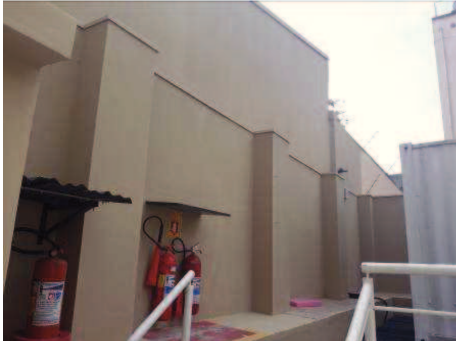
Figura 05: Pintura do muro dos fundos do imóvel.