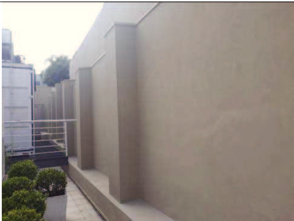
Figura 03: Pintura no muro lateral.

FISCALIZAÇÃO DE OBRAS - PINTURA E RESTAURO DO IMÓVEL CASARÃO DO TRIBUNAL REGIONAL DO TRABALHO DO PARANÁ