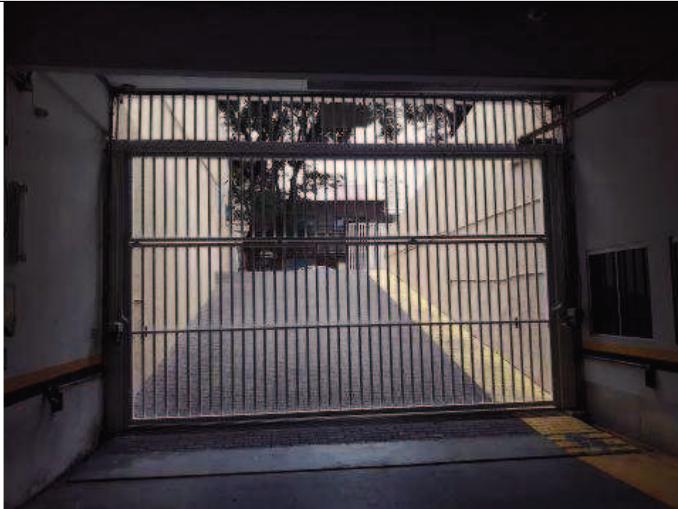
Figura 11: Pintura do gradil

FISCALIZAÇÃO DE OBRAS - PINTURA E RESTAURO DO IMÓVEL CASARÃO DO TRIBUNAL REGIONAL DO TRABALHO DO PARANÁ