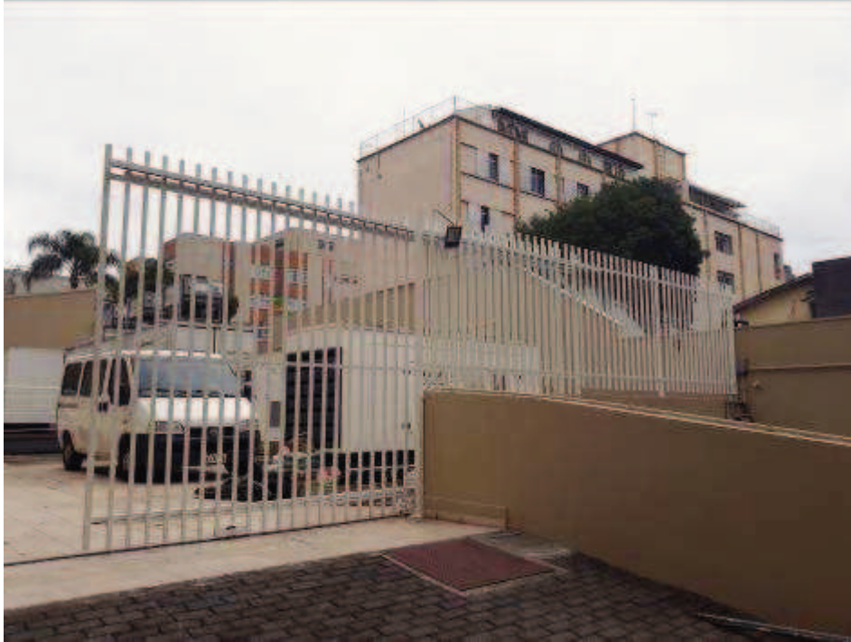
Figura 13: Pintura do gradil

FISCALIZAÇÃO DE OBRAS - PINTURA E RESTAURO DO IMÓVEL CASARÃO DO TRIBUNAL REGIONAL DO TRABALHO DO PARANÁ