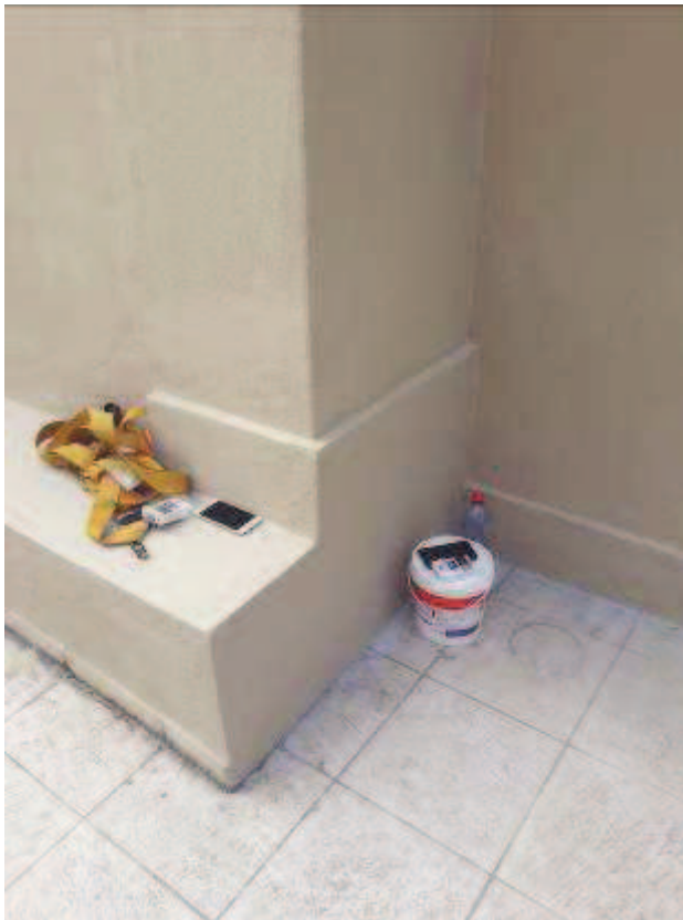
Figura 01: Reparo na parte inferior do muro.