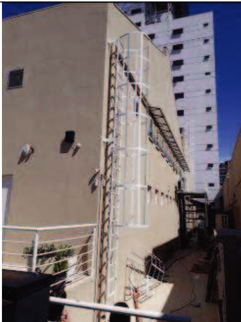
Figura 10: Pintura fundos.