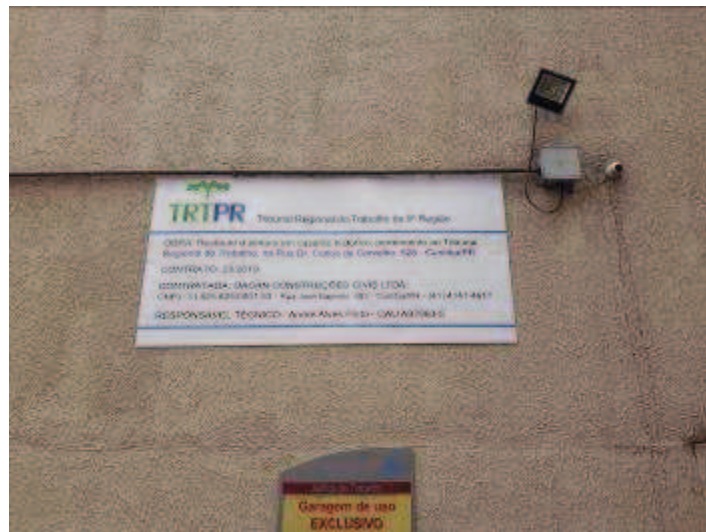
Figura 01: Placa de obra.

FISCALIZAÇÃO DE OBRAS - PINTURA E RESTAURO DO IMÓVEL CASARÃO DO TRIBUNAL REGIONAL DO TRABALHO DO PARANÁ