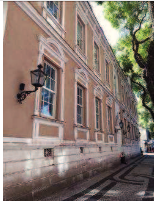
Figura 03: Situação atual fachada frontal..