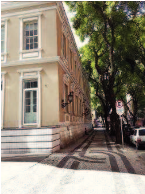
Figura 04: Restauro fachada lateral.