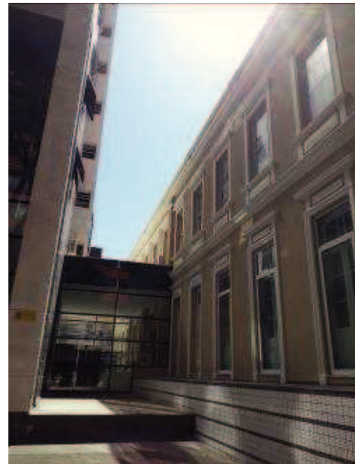
Figura 05: Restauro fachada lateral.