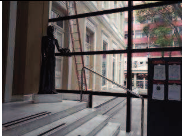
Figura 08: Pintura fachada lateral.

FISCALIZAÇÃO DE OBRAS - PINTURA E RESTAURO DO IMÓVEL CASARÃO DO TRIBUNAL REGIONAL DO TRABALHO DO PARANÁ