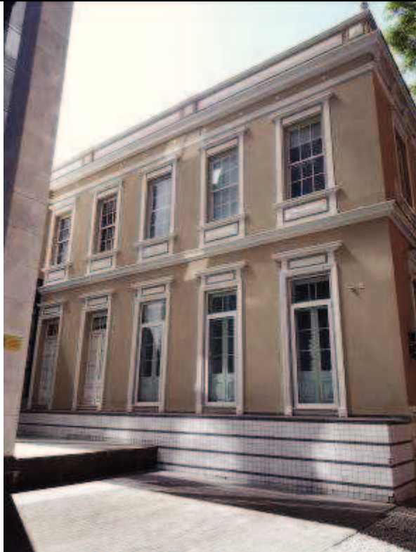
Figura 06: Pintura fachada lateral.