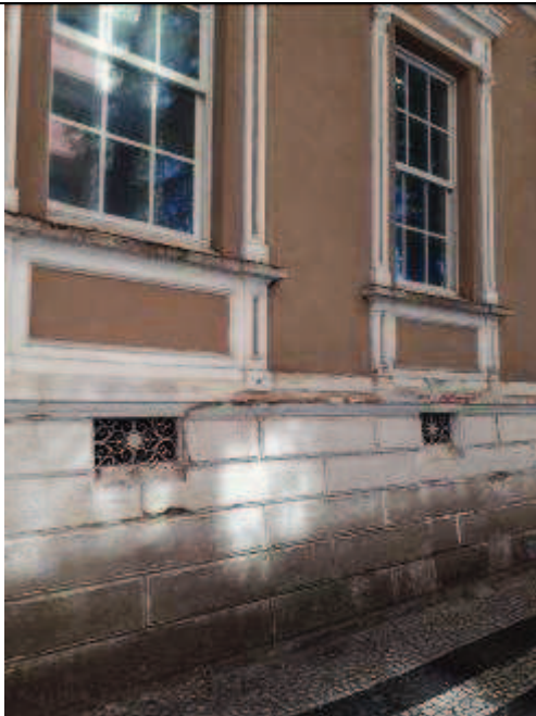
Figura 02: Situação atual fachada frontal.