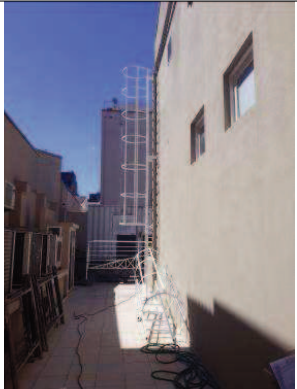
Figura 09: Pintura fundos.