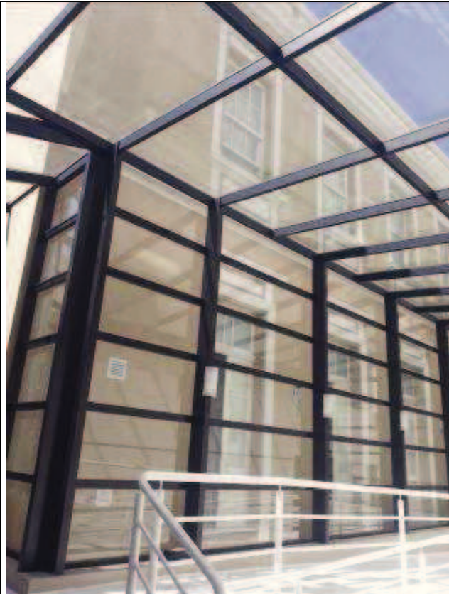
Figura 12: Pintura fachada lateral.

FISCALIZAÇÃO DE OBRAS - PINTURA E RESTAURO DO IMÓVEL CASARÃO DO TRIBUNAL REGIONAL DO TRABALHO DO PARANÁ