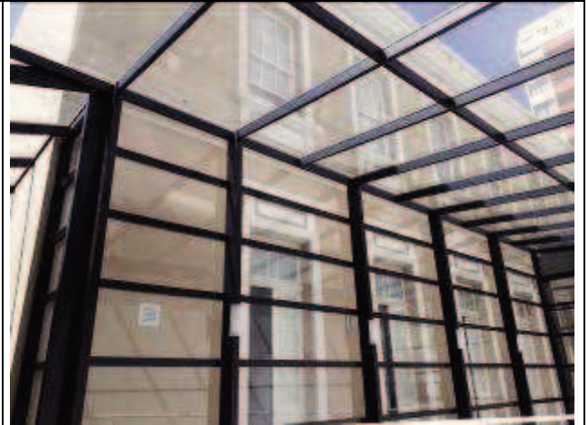
Figura 07: Pintura fachada lateral.