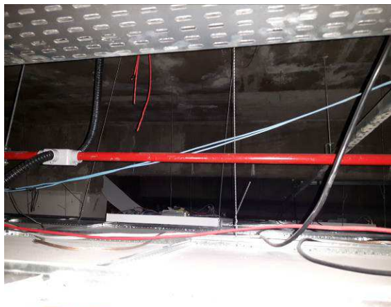
Figura 04: Eletroduto de aço galvanizado