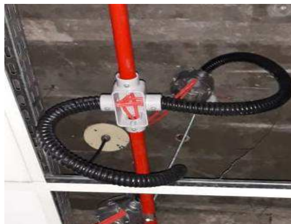
Figura 06: Eletroduto flexível metálico