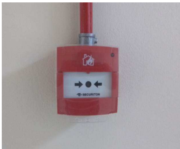
Figura 09: Acionador manual