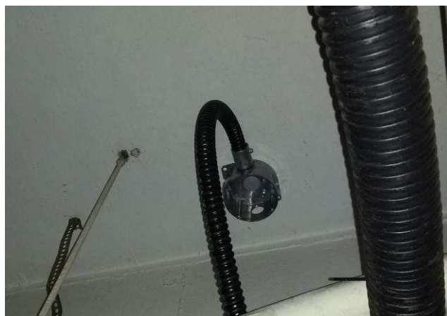
Figura 05: Caixa de ligação redonda