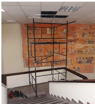
Figura 03: Montagem e desmontagem de andaime