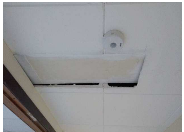
Figura 02: Remoção de forro de gesso