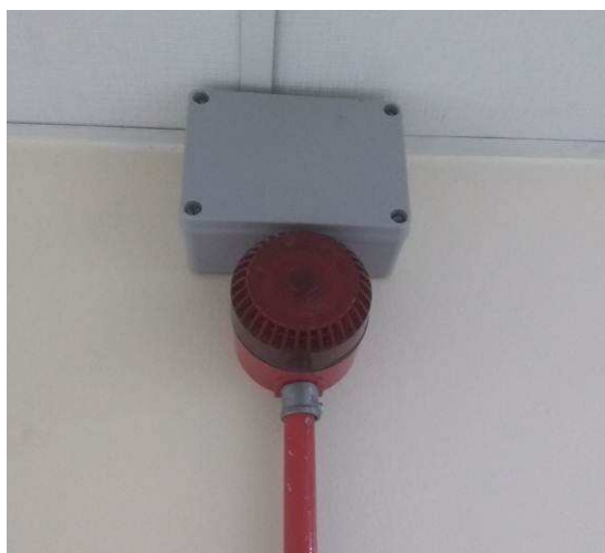
Figura 10: Indicador audiovisual