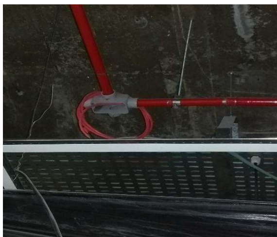
Figura 07: Cabo para sinal e detecção de incêndio