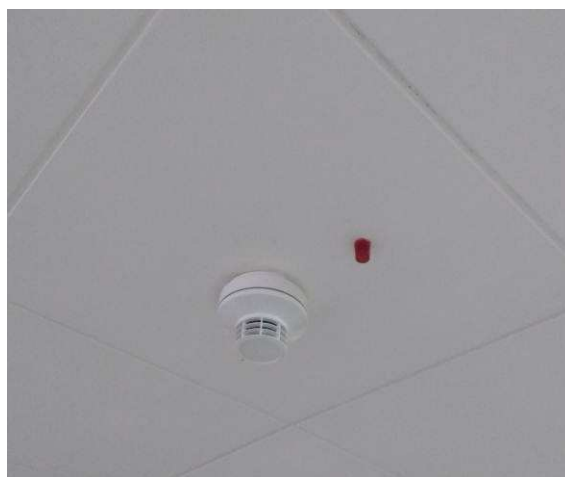
Figura 08: Detector de fumaça endereçável e indicador visual