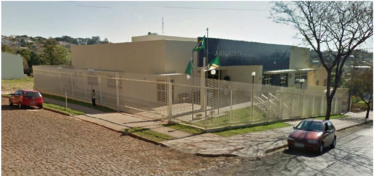
Figura 1 – Vista externa.