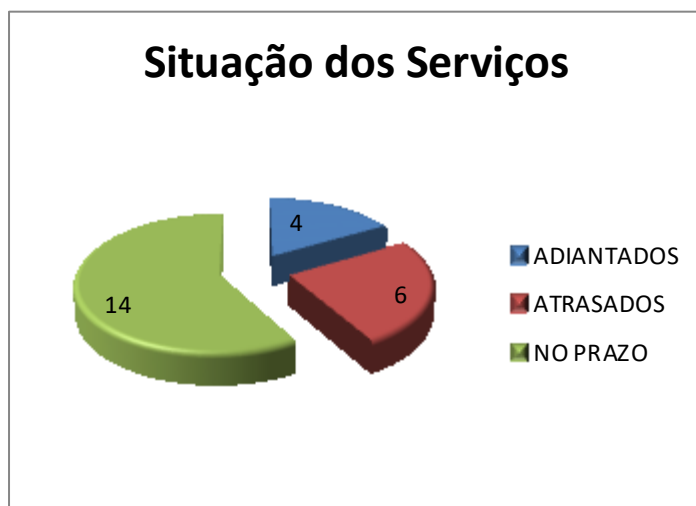
Gráfico 1.

O Gráfico 1, abaixo, mostra a quantidade de itens adiantados, atrasados e dentro do prazo, em relação à etapa atual, tendo em vista o cronograma vigente da obra.