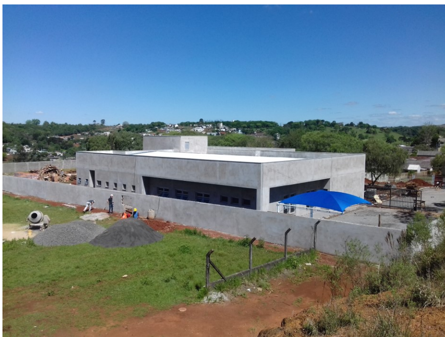
Figura 1 – Vista externa da obra em 22/10/2019

As imagens abaixo retratam a situação geral do canteiro de obra, após término da etapa atual.