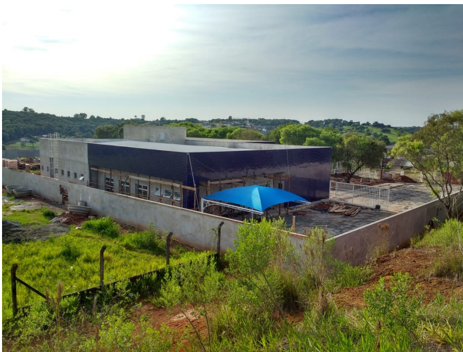
Figura 2 – Vista externa da obra em 13/11/2019