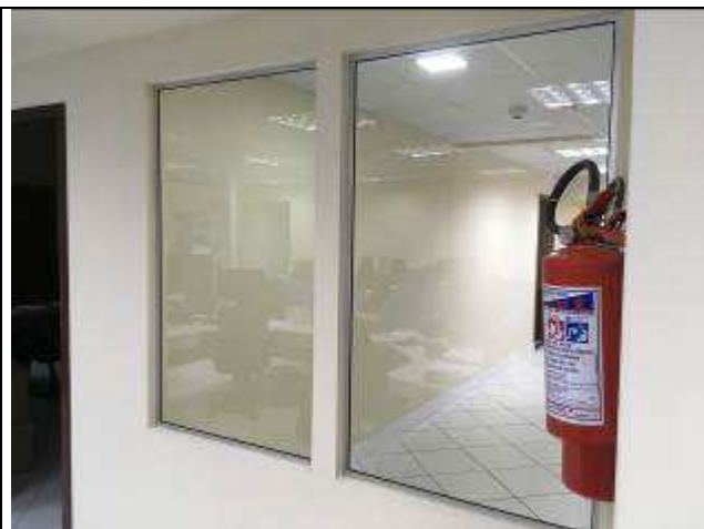
Figura 47C: vidros fixos - "Aquário".