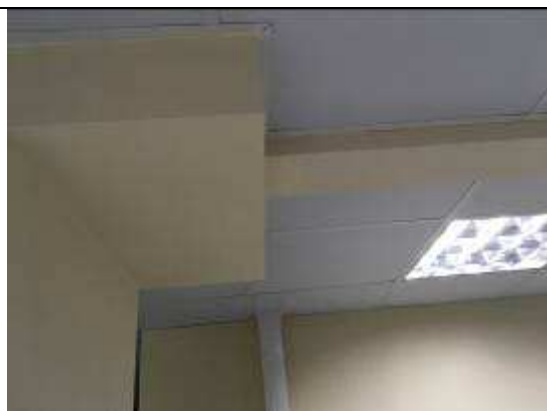
Figura 43C: envelopamento eletrocalhas.