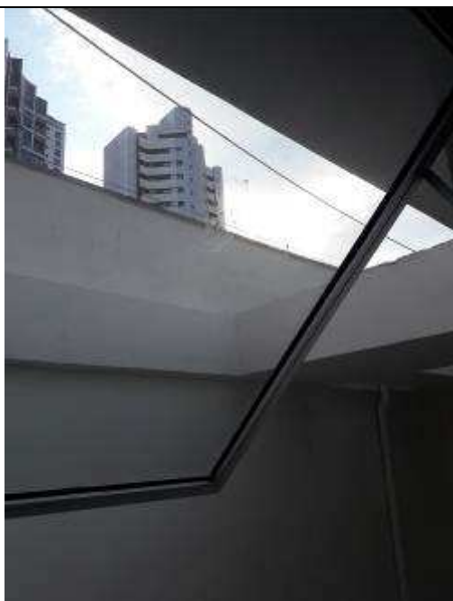
Figura 28C: revestimento poço de ventilação