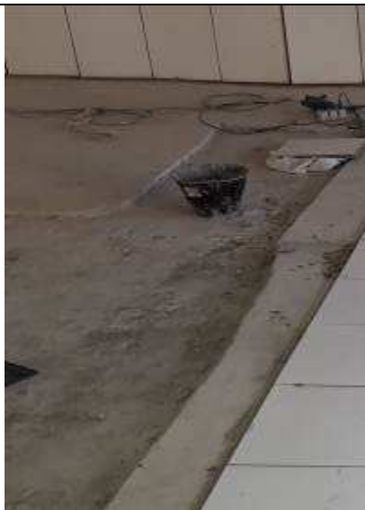
Figura 09C: retirada de contra-piso "oco" - hall público