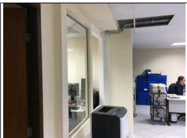
Figura 20C: recuo de parede executado.