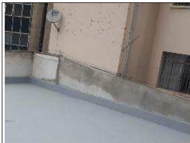
Figura 27C: recomposição de revestimento - platibanda de divisa