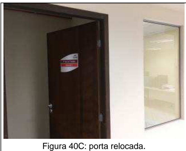
Figura 40C: porta relocada.