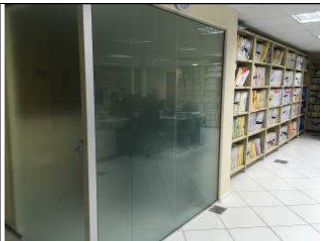
Figura 39C: vidro fixo - área de atendimento.