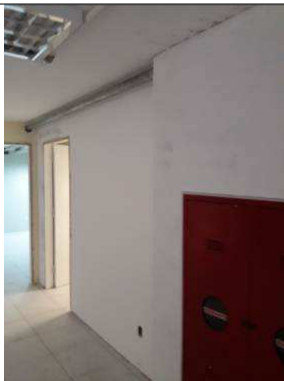
Figura 24C: tubulação após relocação de hidrante .