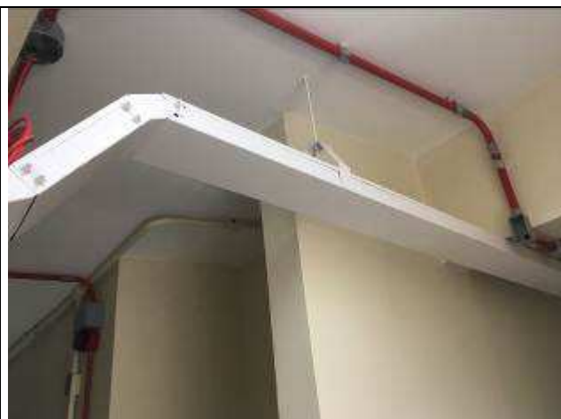
Figura 03C: Pintura eletrocalhas