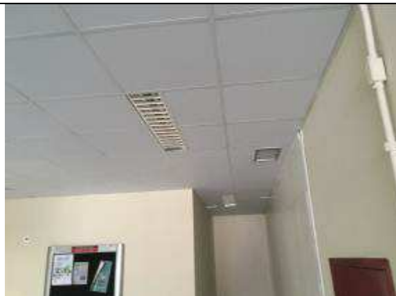
Figura 35C: forro removível instalado .