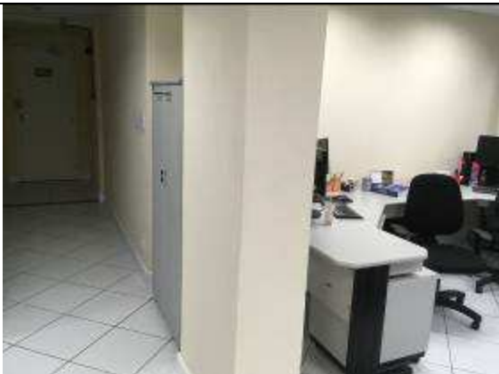
Figura 41C: revestimento pilar - 4ª VT.