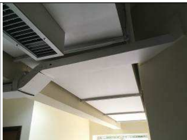
Figura 02C: Pintura eletrocalhas