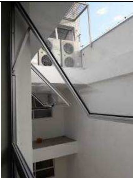
Figura 30C: revestimento poço de ventilação e laje interna