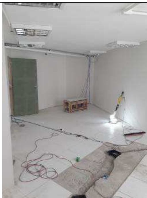
Figura 17C: rasgo de piso - canaletas salas de audiência.