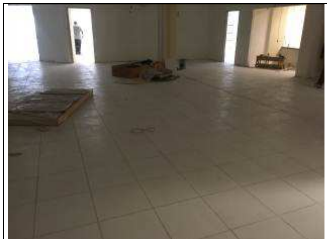
Figura 55C: Piso instalado - hall público - 13ª e 15ª VTs.