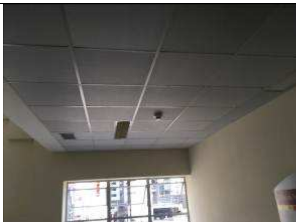
Figura 36C: forro removível instalado.