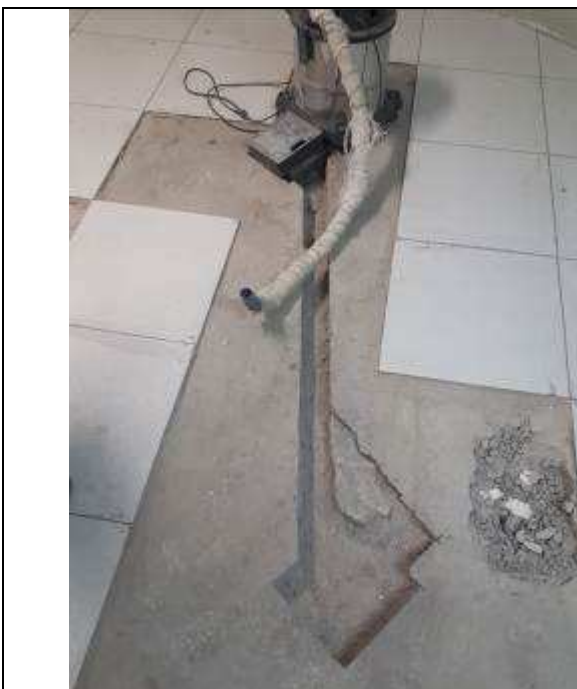
Figura 16C: rasgo de piso - canaletas salas de audiência