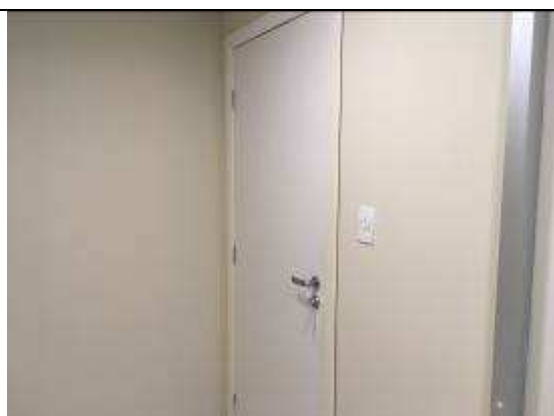
Figura 37C: porta de madeira instalada - acesso entre área de atendimento e secretaria.