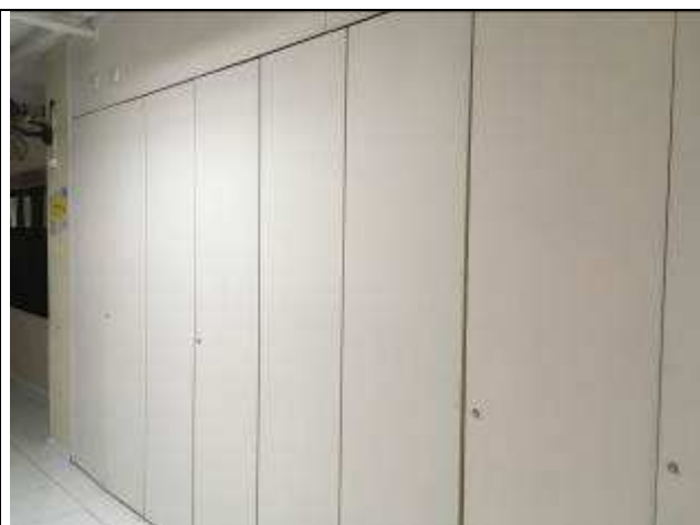
Figura 01C: Pintura portas armários de elétrica - hall público.