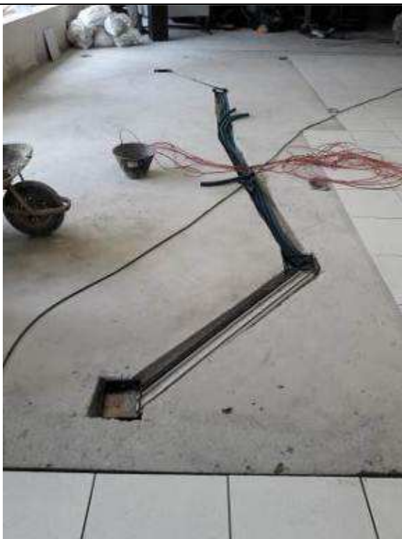
Figura 18C: rasgo de piso - canaletas salas de audiência.