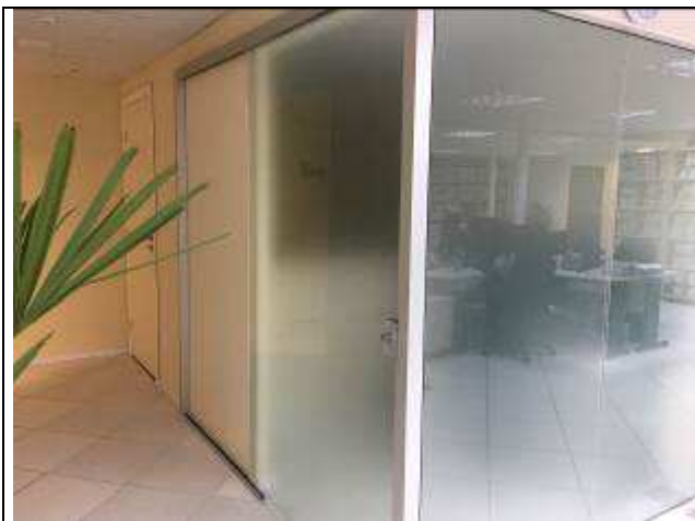
Figura 38C: porta de vidro de correr - área de atendimento.