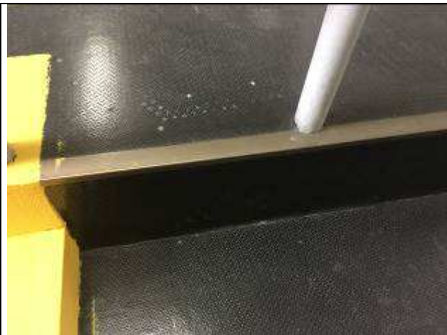
Figura 54C: perfis de alumínio para acabamento.