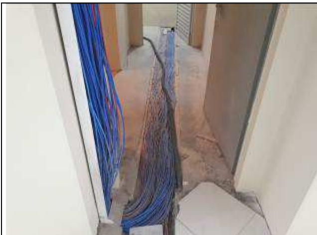
Figura 14C: rasgo de piso para passagem da rede lógica