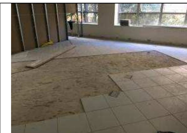
Figura 07C: retirada de pisos soltos