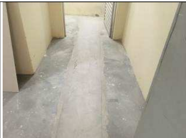
Figura 15C: recomposição de rasgo de piso.