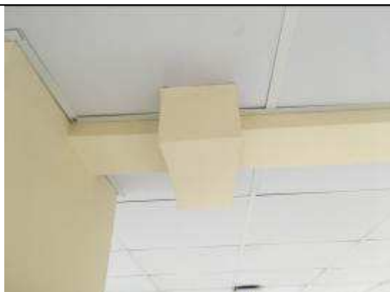
Figura 45C: envelopamento eletrocalhas.