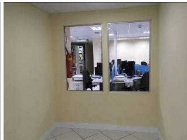
Figura 46C: paredes divisórias - "Aquário" .