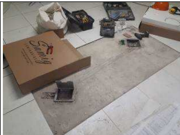
Figura 19C: recomposição de rasgo de piso - canaletas salas de audiência.