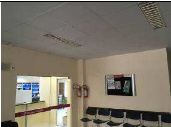
Figura 34C: forro removível instalado .