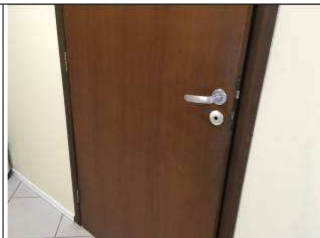
Figura 04C: pintura verniz porta BWCs