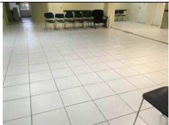
Figura 13C: pisos cerâmicos instalados após a recomposição do contra-piso