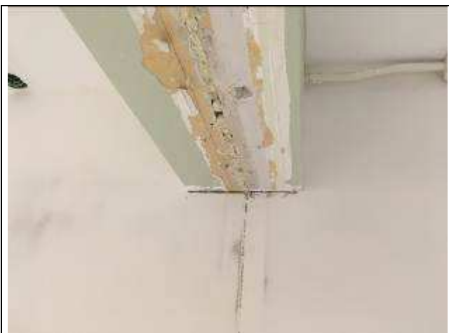
Figura 52C: espuma de poliuretano aplicada - juntas de dilatação.