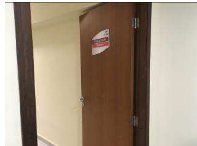
Figura 06C: Pintura verniz porta gabinete