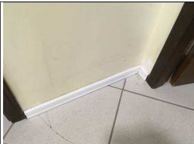
Figura 22C: emassamento de rodapés .