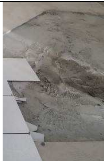
Figura 10C: recomposição de contra-piso.