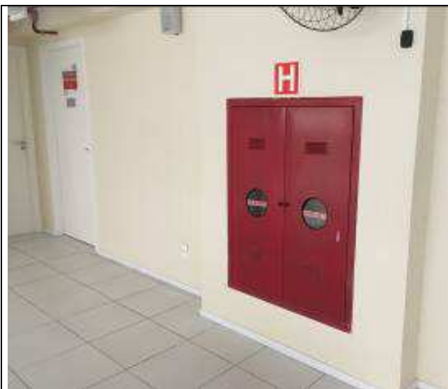
Figura 25C: hidrante relocado