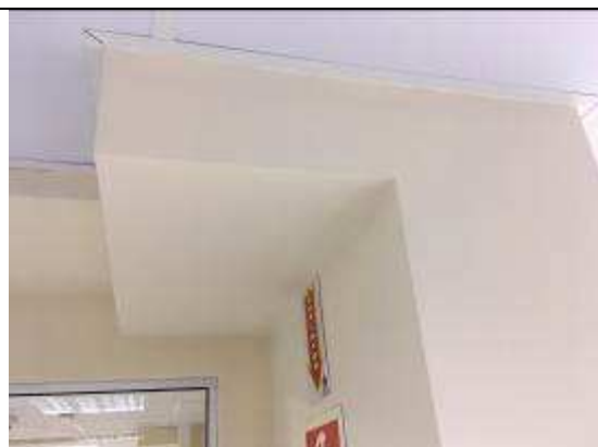
Figura 44C: envelopamento eletrocalhas.