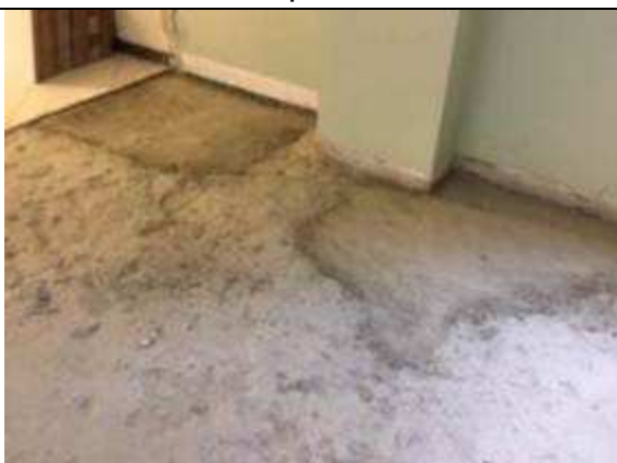
Figura 11C: recomposição de contra-piso