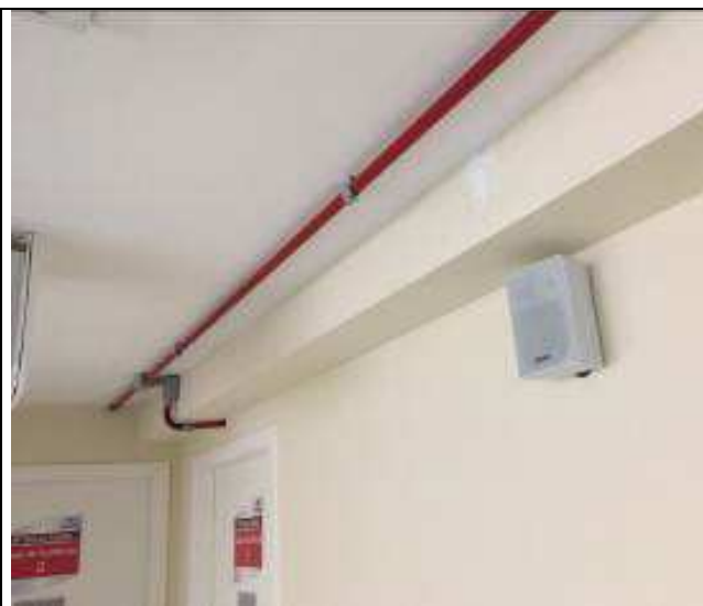
Figura 26C: envelopamento em gesso - tubulação de hidrante