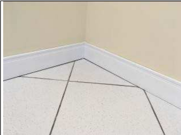
Figura 50C: rodapé instalado.