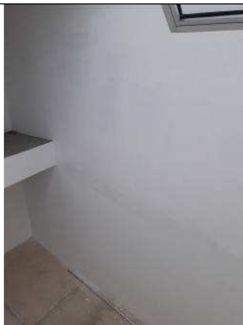
Figura 29C: revestimento poço de ventilação.