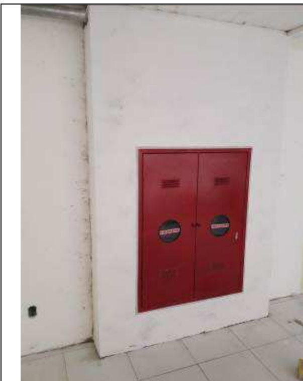
Figura 23C: relocação de hidrante.