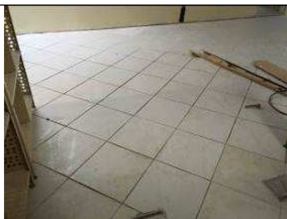
Figura 08C: Pisos cerâmicos reinstalados.