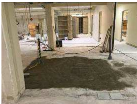
Figura 12C: recomposição de contra-piso