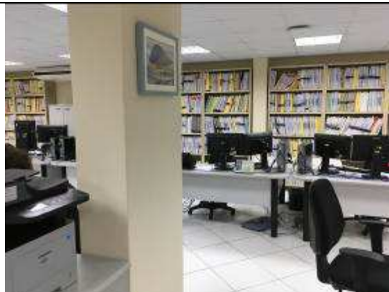
Figura 42C: revestimento pilar - 6ª VT.