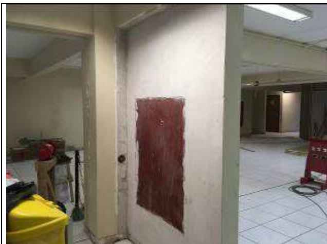
Figura 48C: hidrante sem revestimento nos fundos.