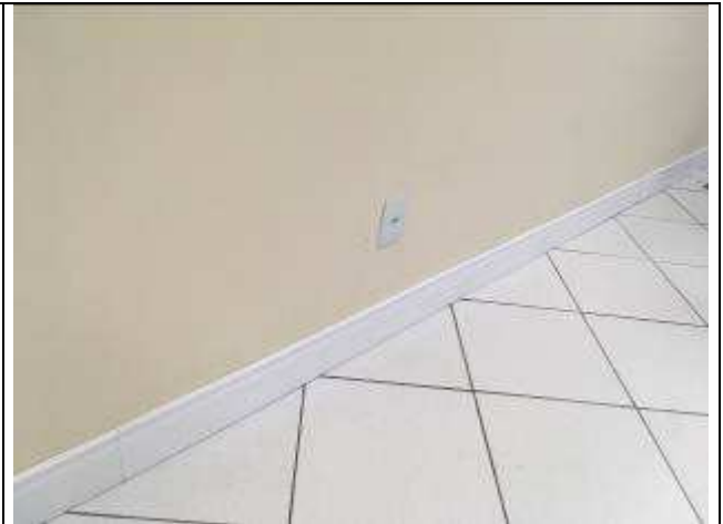
Figura 51C: rodapé instalado.