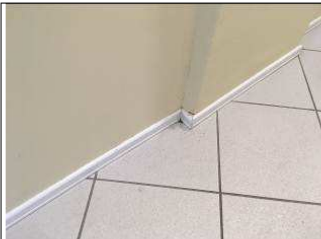
Figura 21C: emassamento de rodapés .