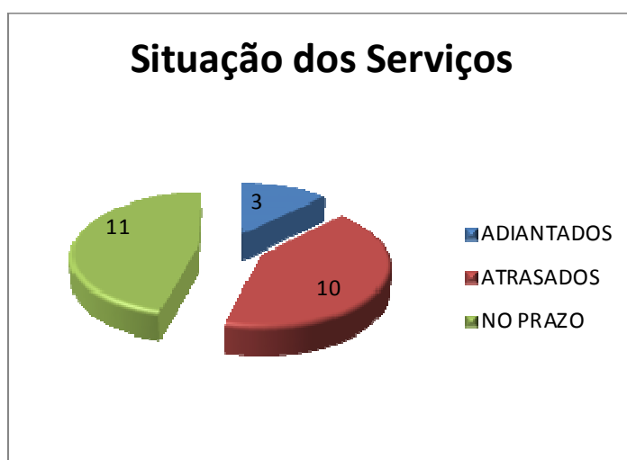
Gráfico 1.

O Gráfico 1, abaixo, mostra a quantidade de itens adiantados, atrasados e dentro do prazo, em relação à etapa atual, tendo em vista o cronograma vigente da obra.