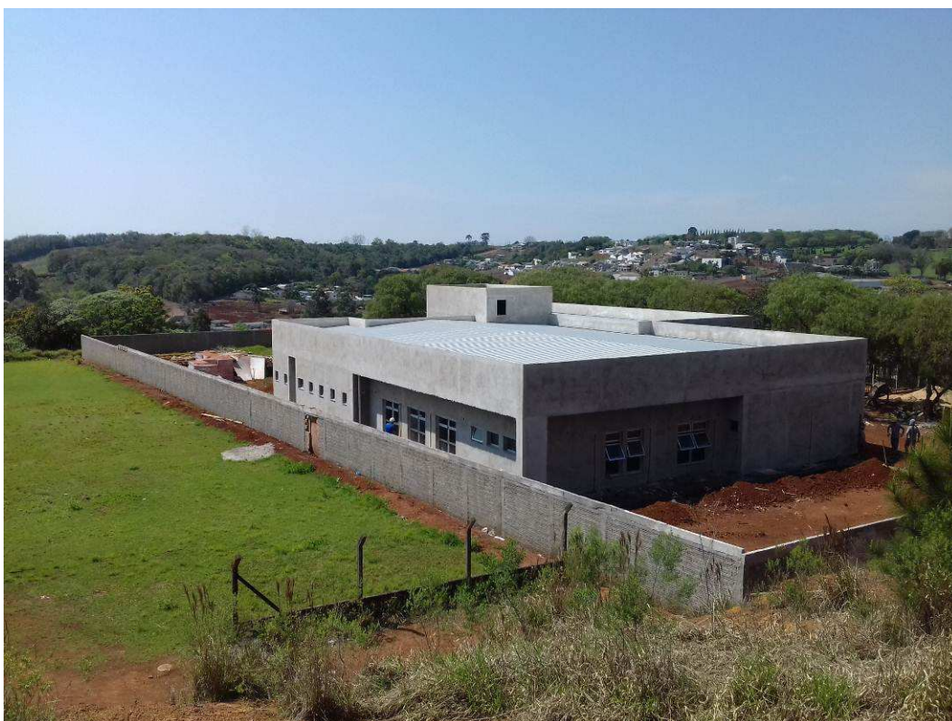
Figura 2 – Vista externa dos fundos