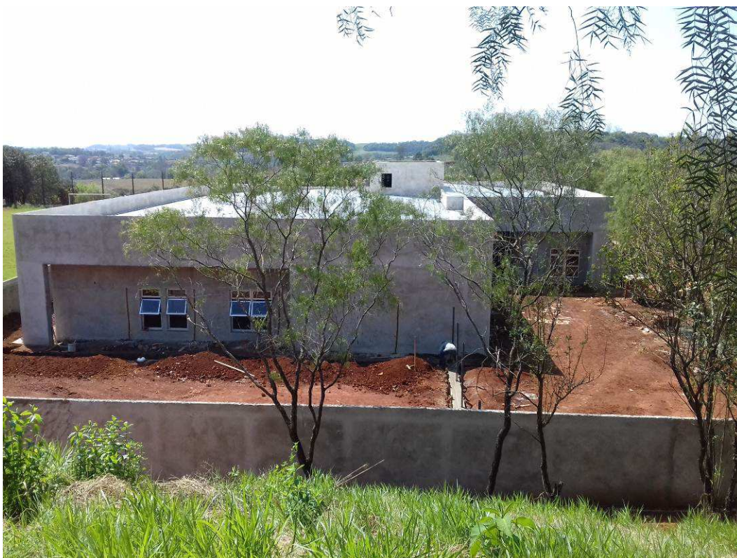
Figura 1 – Vista externa da lateral esquerda