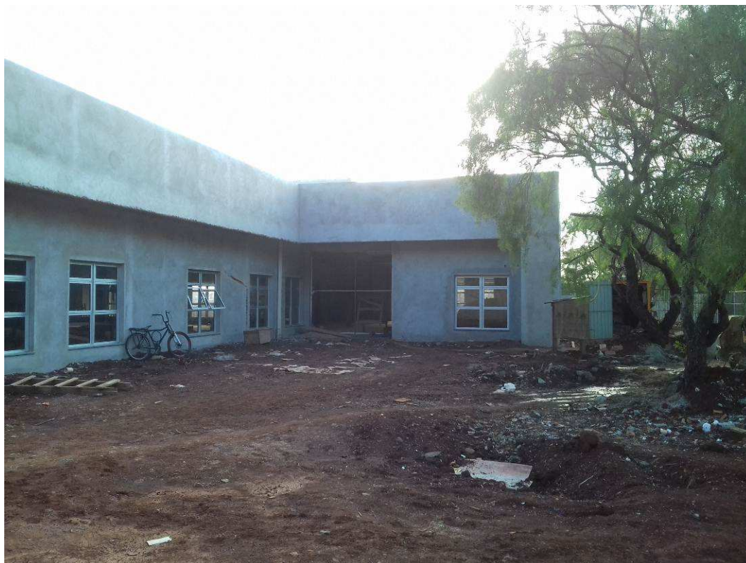
Figura 3 – Vista externa frontal