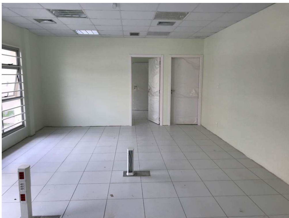
Figura 7 – Prédio do Fórum – vista interna - Sala de Audiências.