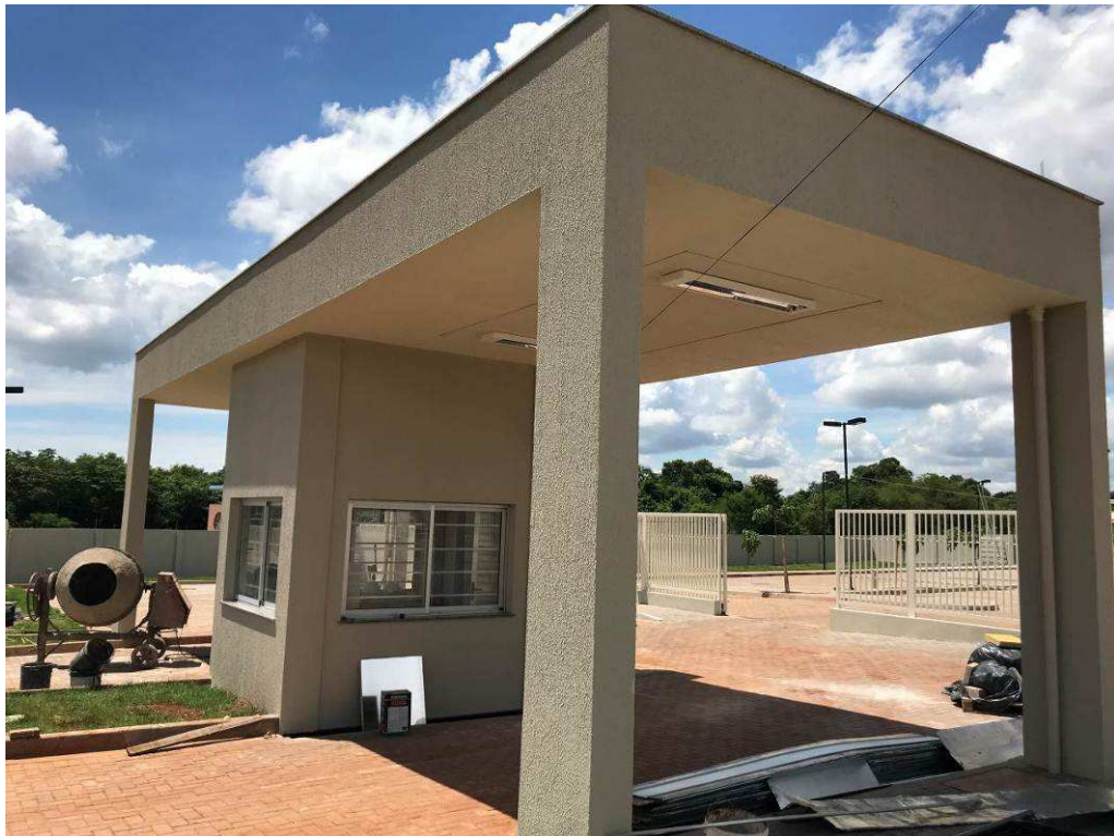
Figura 4 – Guarita – vista externa.