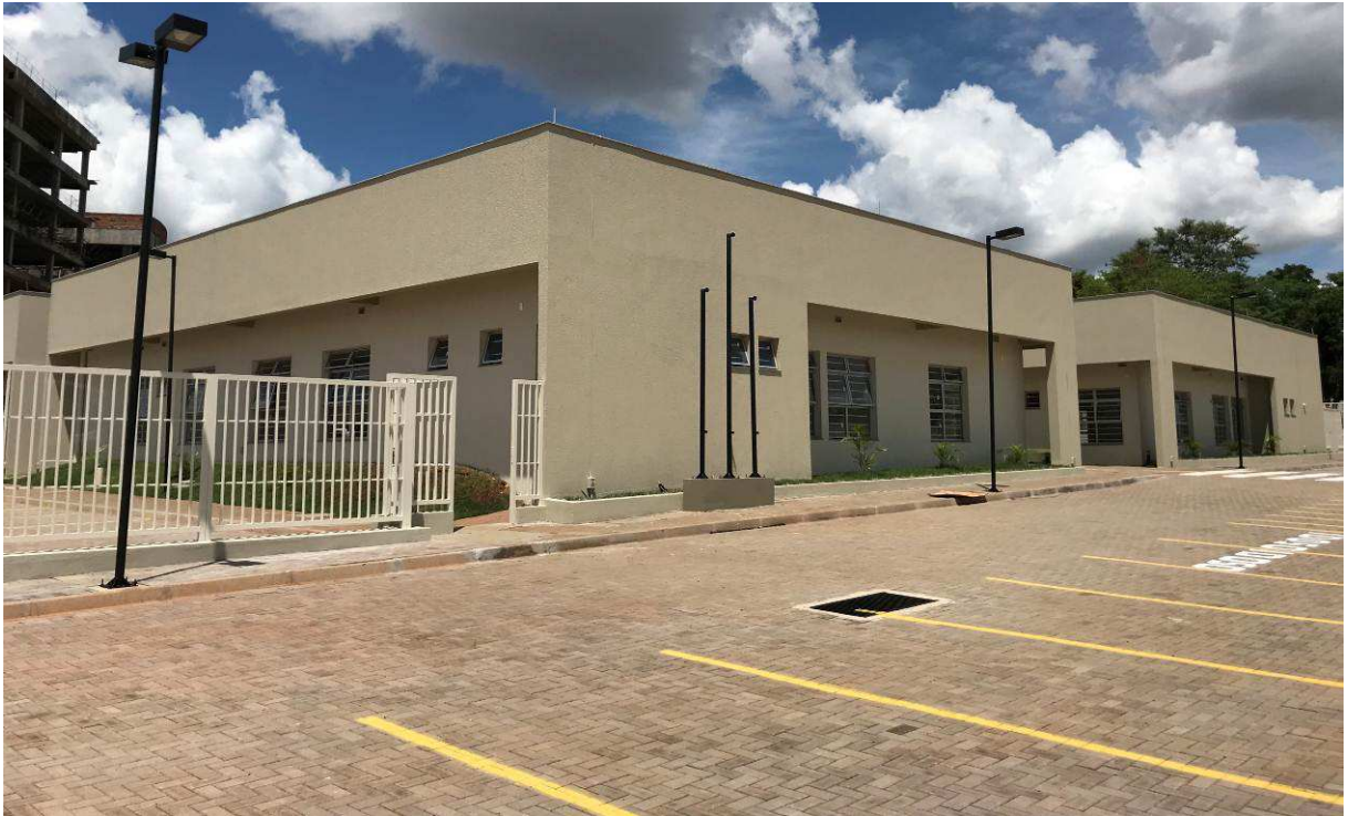
Figura 2 – Prédio do Fórum – vista externa.