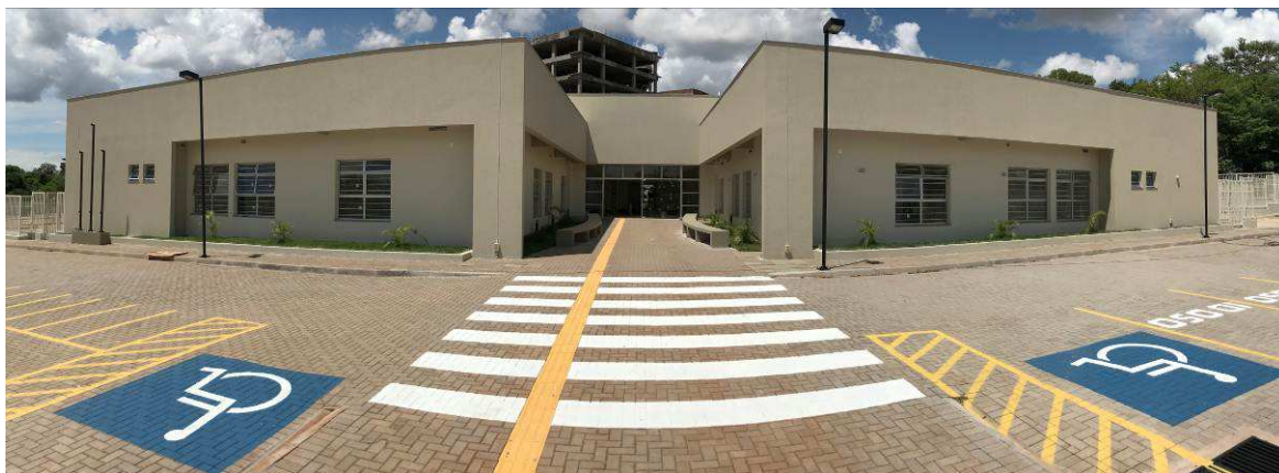
Figura 1 – Prédio do Fórum – vista externa.