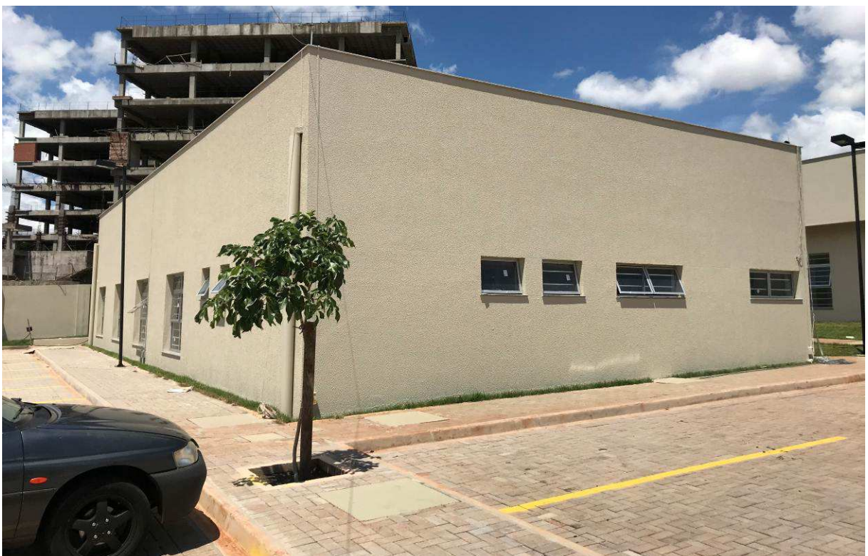
Figura 3 – Arquivo – vista externa.