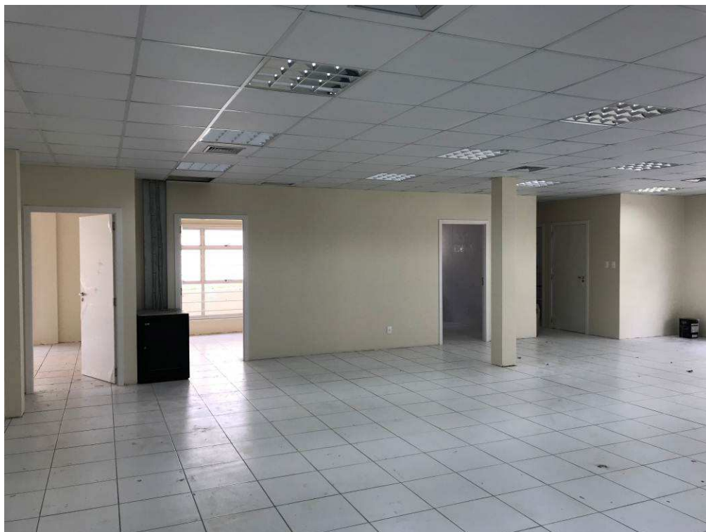
Figura 6 – Prédio do Fórum – vista interna - Secretaria.