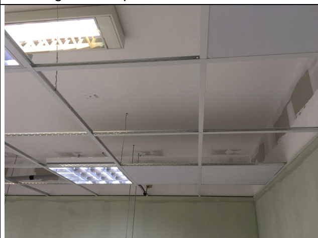
Figura 07C: parte de forro instalado.