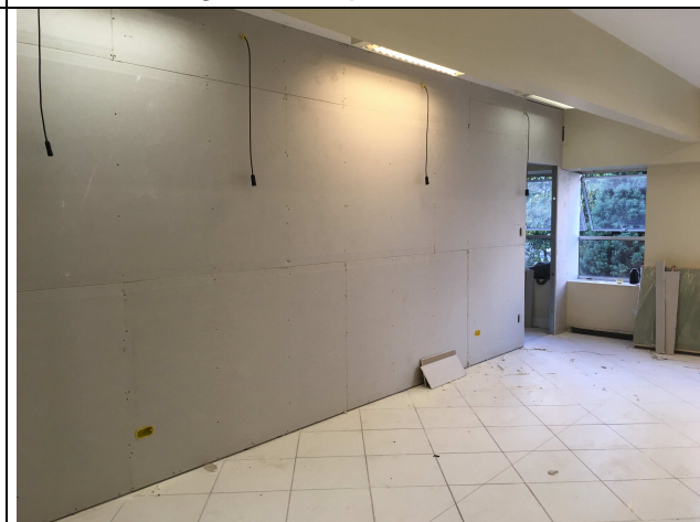
Figura 14C: divisórias instaladas.