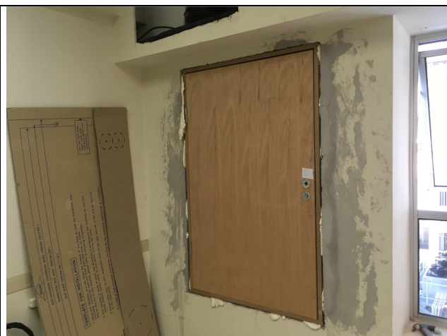
Figura 04C: requadros.