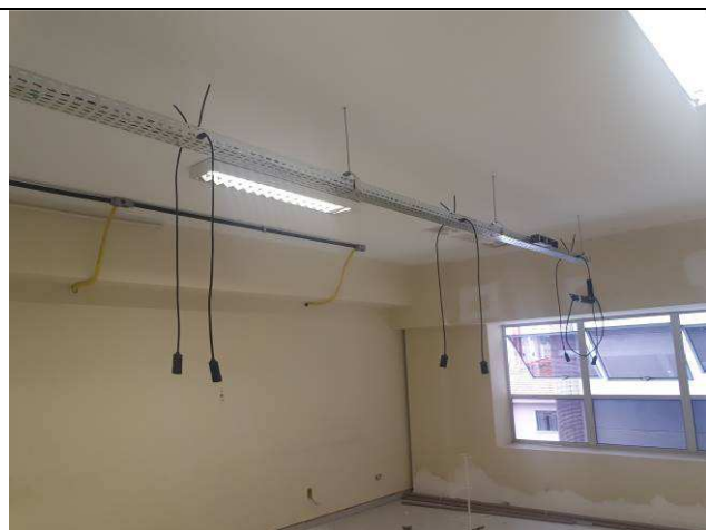
Figura 05E: infraestrutura interna 4ª e 5ª VT, eletrocalhas, cabos, condutes