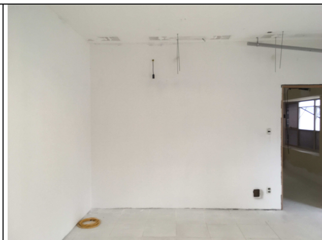
Figura 10C: emassamento.