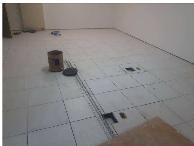
Figura 09E: infraestrutura interna 4ª e 5ª VT, salas de audiências