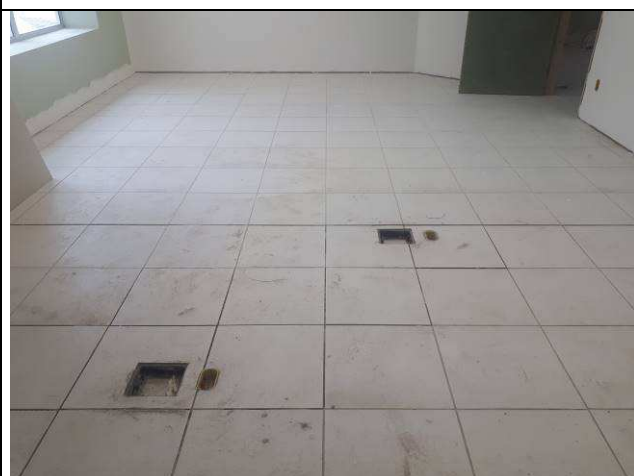
Figura 10E: infraestrutura interna 4ª e 5ª VT, salas de audiências