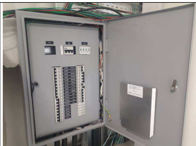
Figura 12E: quadro elétrico comum 4ª e 5ª VT