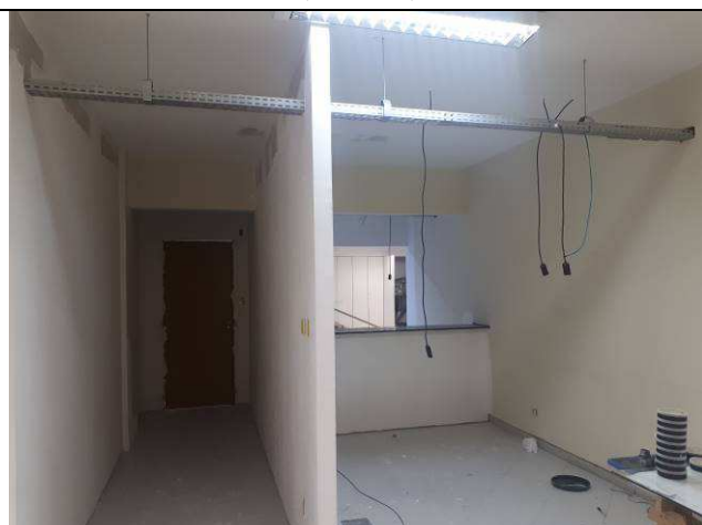
Figura 07E: infraestrutura interna 4ª e 5ª VT, eletrocalhas, cabos, condutes