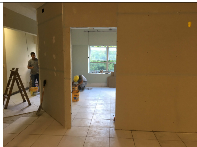
Figura 13C: divisórias instaladas.