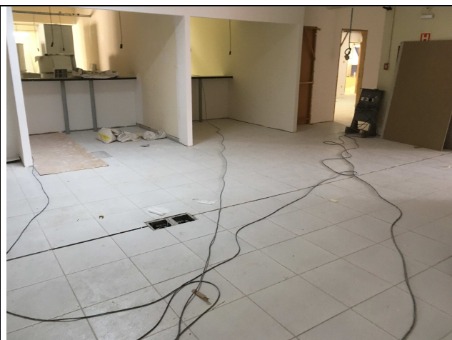
Figura 03C: Balcão instalado.