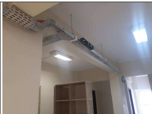
Figura 06E: infraestrutura interna 4ª e 5ª VT, eletrocalhas, cabos, condutes