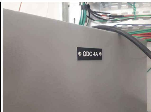
Figura 11E: quadro elétrico comum 4ª e 5ª VT