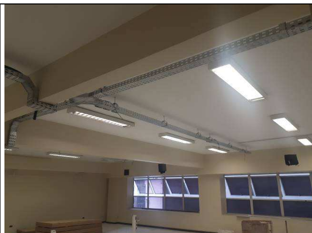
Figura 13E: infraestrutura interna 7ª e 8ª VT, eletrocalhas, condutes