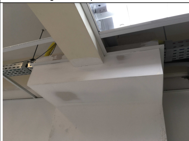
Figura 08C: envelopamento.