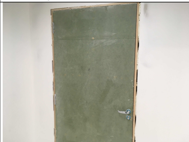
Figura 05C: porta acústica instalada.