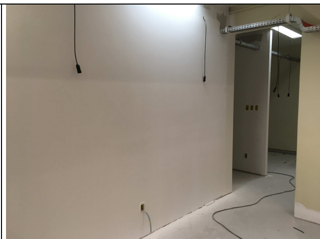
Figura 02C: Divisórias instaladas.