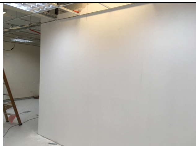
Figura 09C: emassamento.