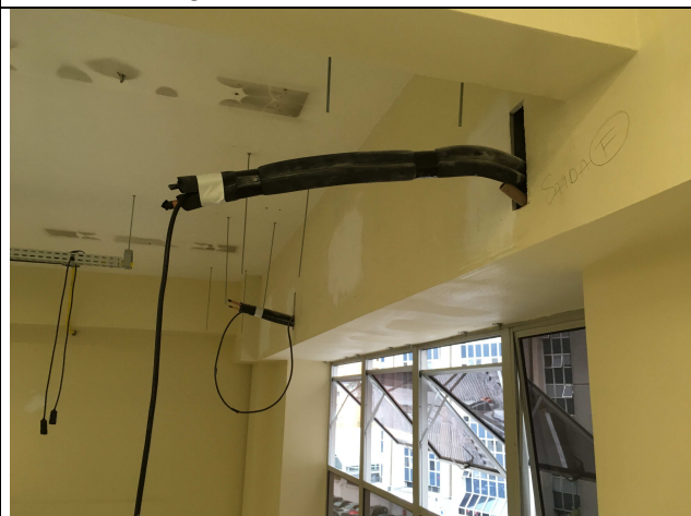
Figura 11C: rede frigorígena instalada.