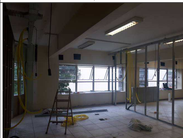
Figura 15E: infraestrutura interna 7ª e 8ª VT, eletrocalhas, condutes