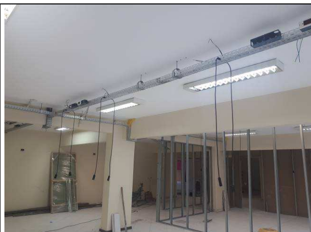
Figura 14E: infraestrutura interna 7ª e 8ª VT, eletrocalhas, condutes