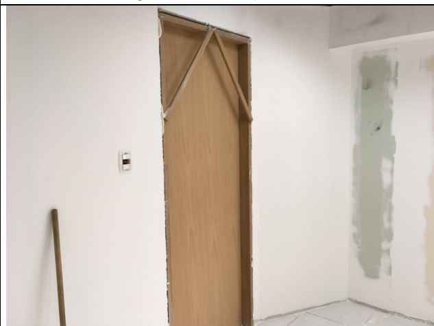
Figura 06C: porta instalada.