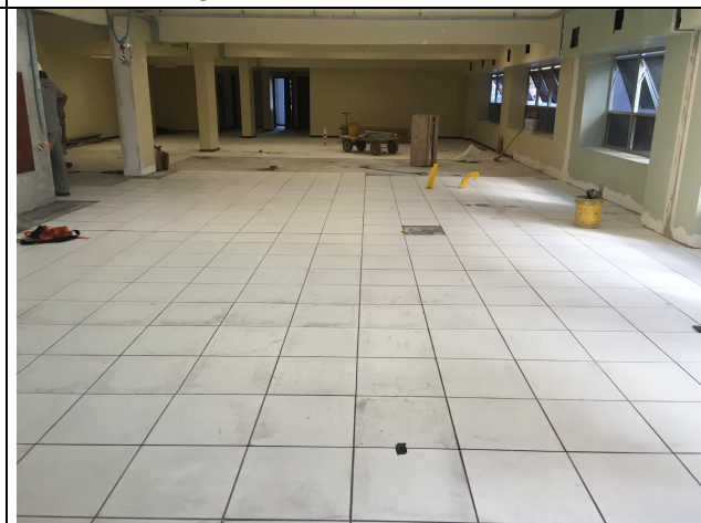
Figura 12C: piso instalado.