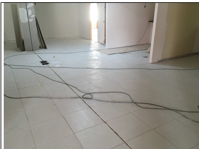
Figura 01C: Piso instalado.