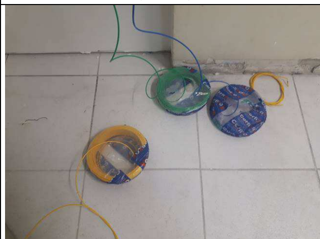
Figura 08E: cabos elétricos 4ª e 5ª VT