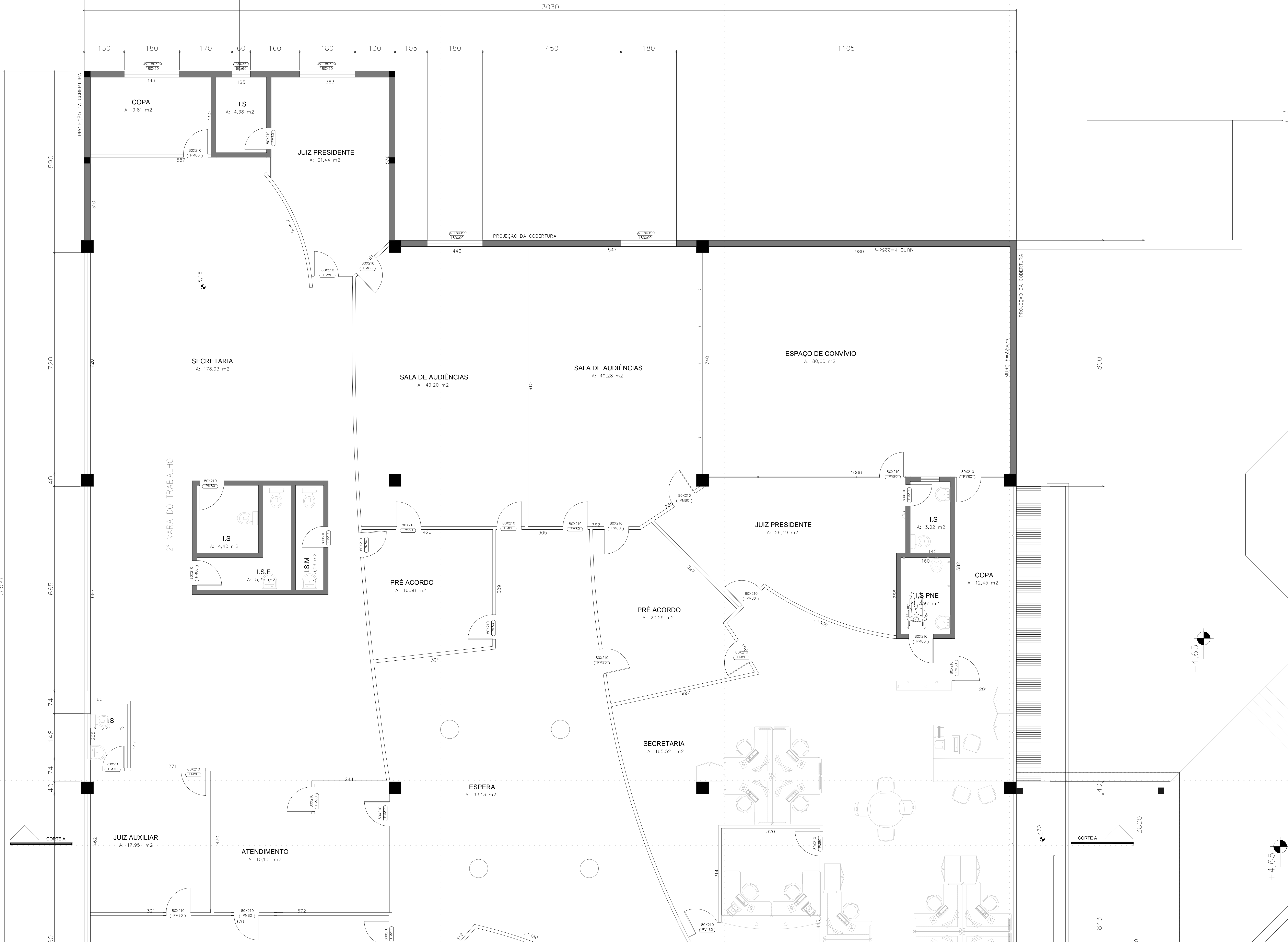
PARTE 01 PLANTA BAIXA PAVIMENTO SUPERIOR ESCALA 1:50