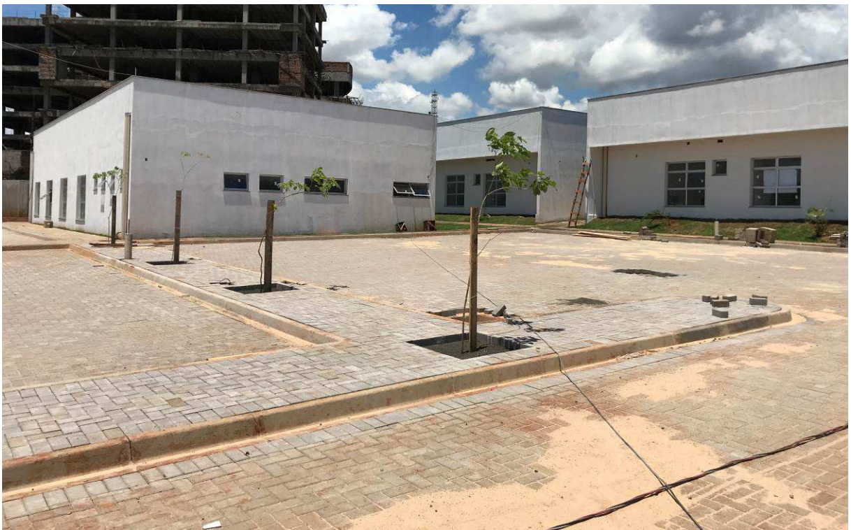
Figura 3 – Estacionamento privativo – vista externa.