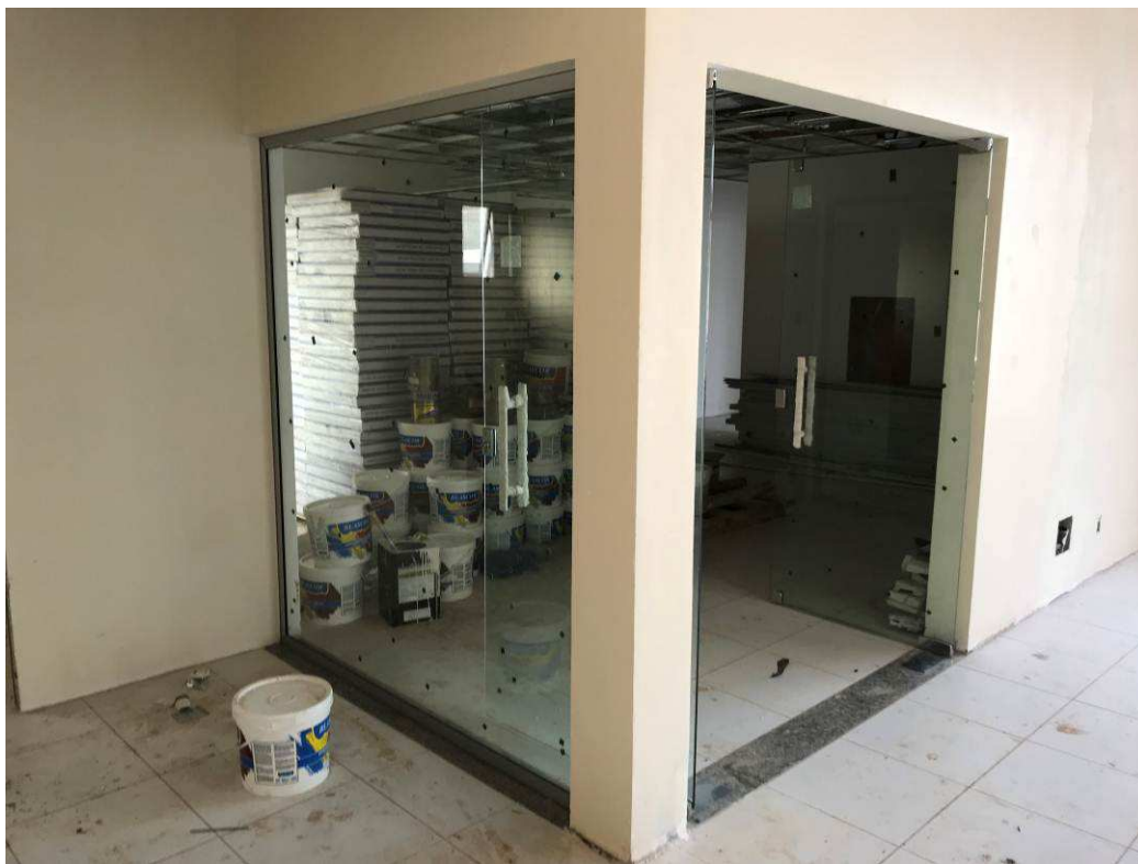
Figura 6 – Prédio do Fórum – vista interna.