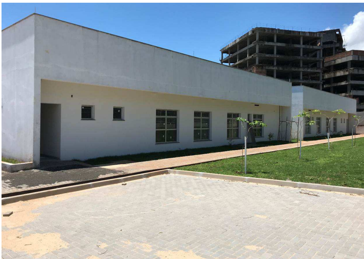
Figura 4 – Prédio do Fórum – vista externa - lateral direita.