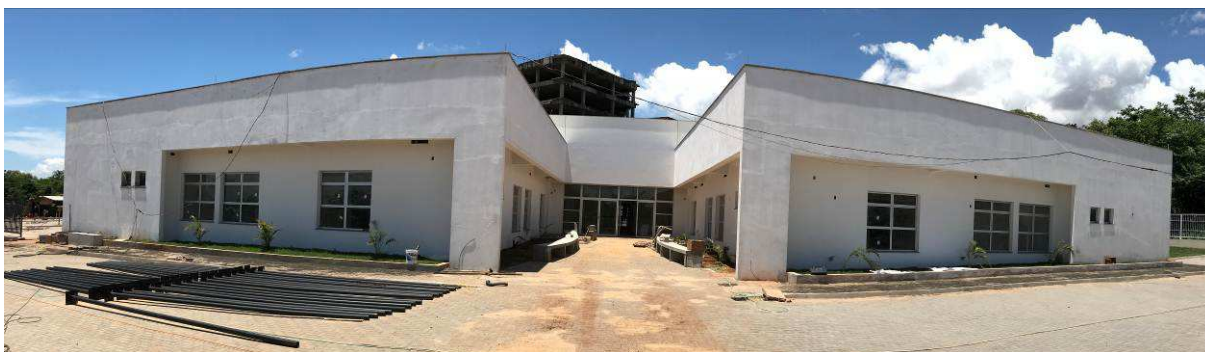
Figura 1 – Prédio do Fórum – vista externa.