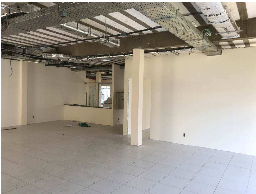
Figura 7 – Prédio do Fórum – vista interna.