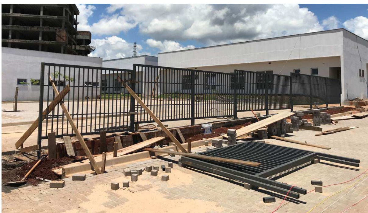
Figura 5 – Gradil estacionamento privado – vista externa.