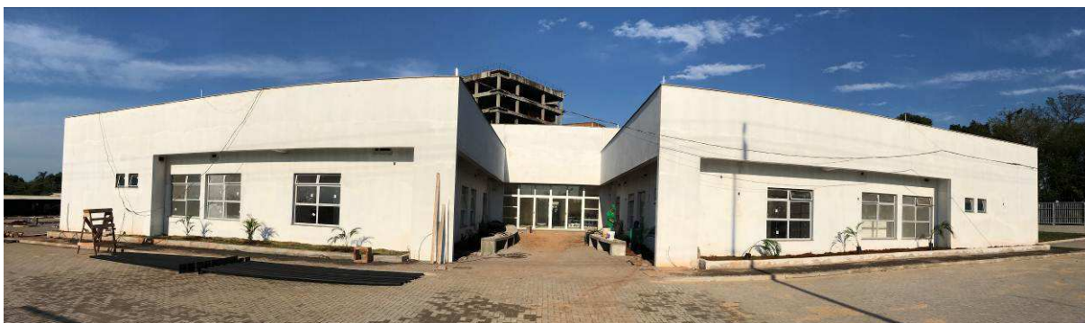
Figura 1 – Prédio do Fórum – vista externa.