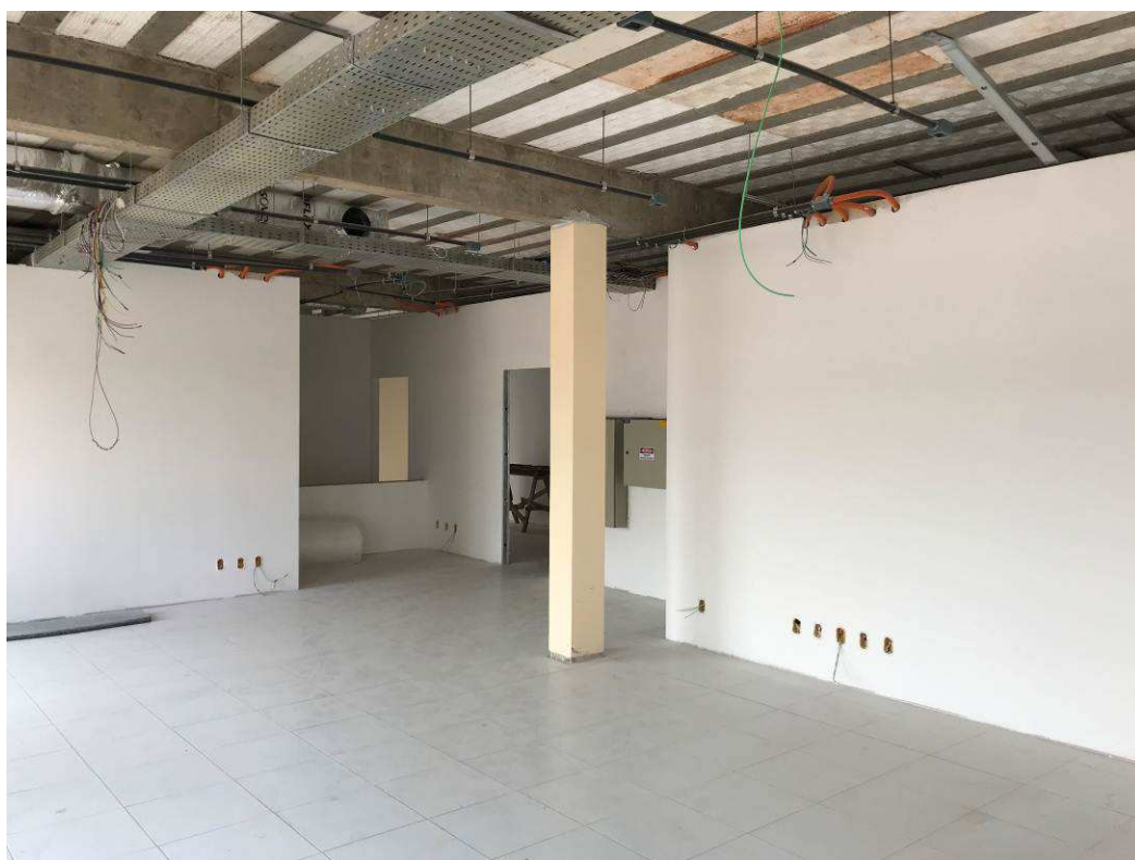
Figura 6 – Prédio do Fórum – vista interna.