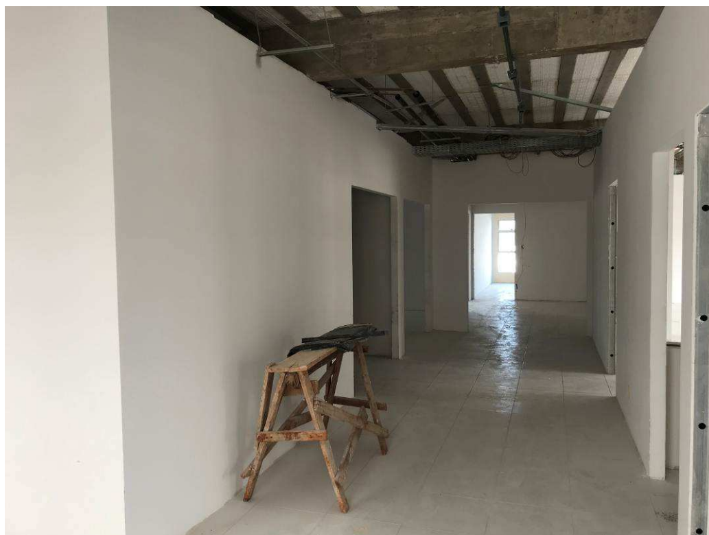
Figura 7 – Prédio do Fórum – vista interna.