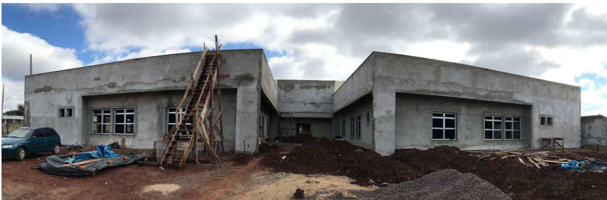
Figura 1 – Fórum - Vista externa.