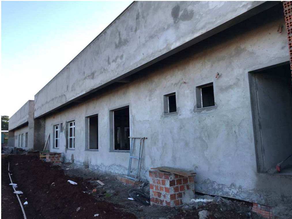
Figura 2 – Fórum - Vista externa.