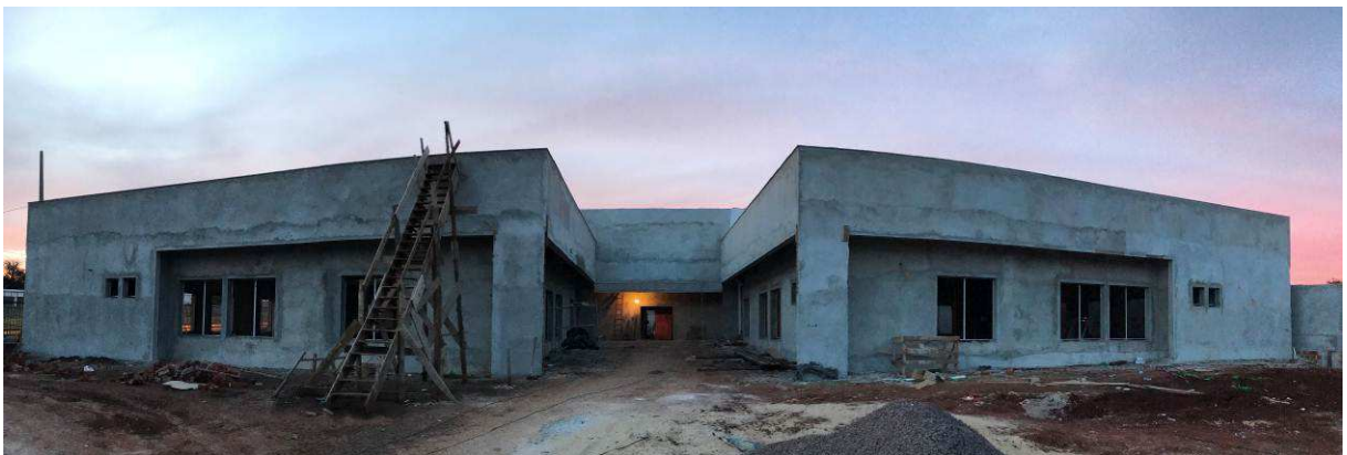
Figura 1 – Fórum - Vista externa.