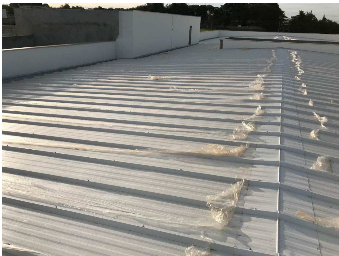
Figura 5 – Fórum - Cobertura.