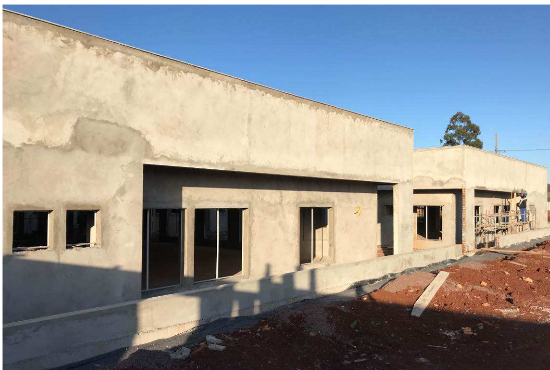
Figura 4 – Fórum - Vista externa.