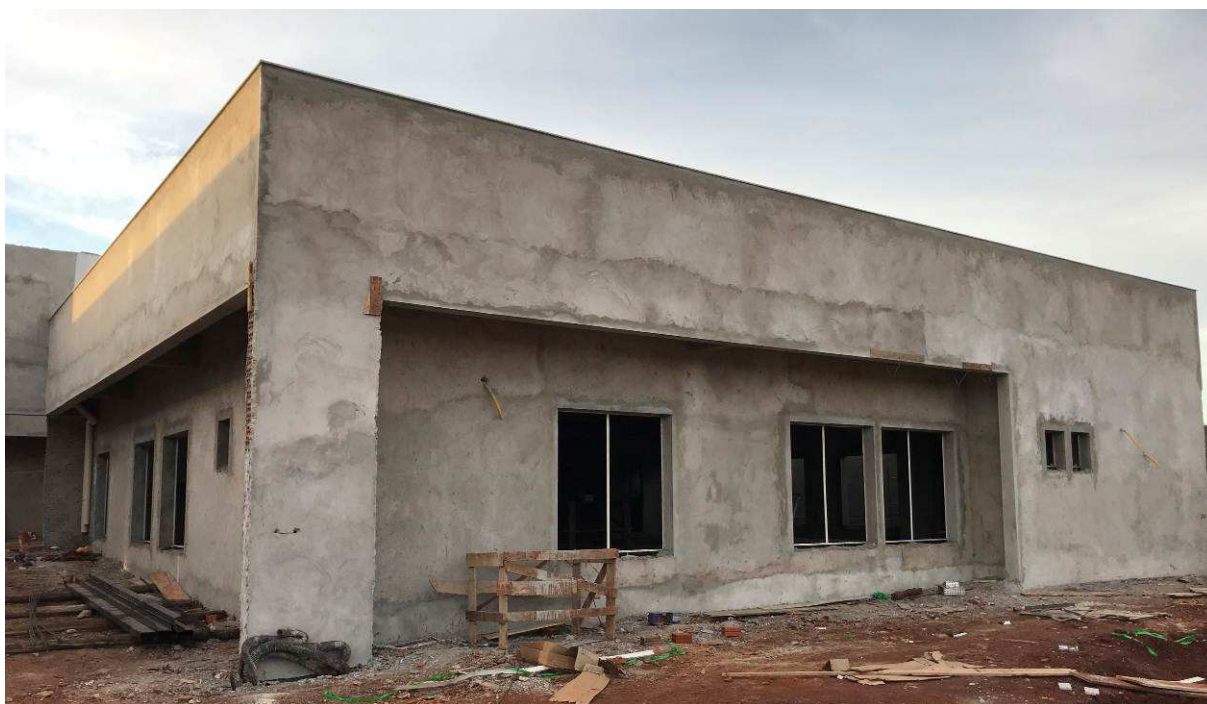
Figura 2 – Fórum - Vista externa.