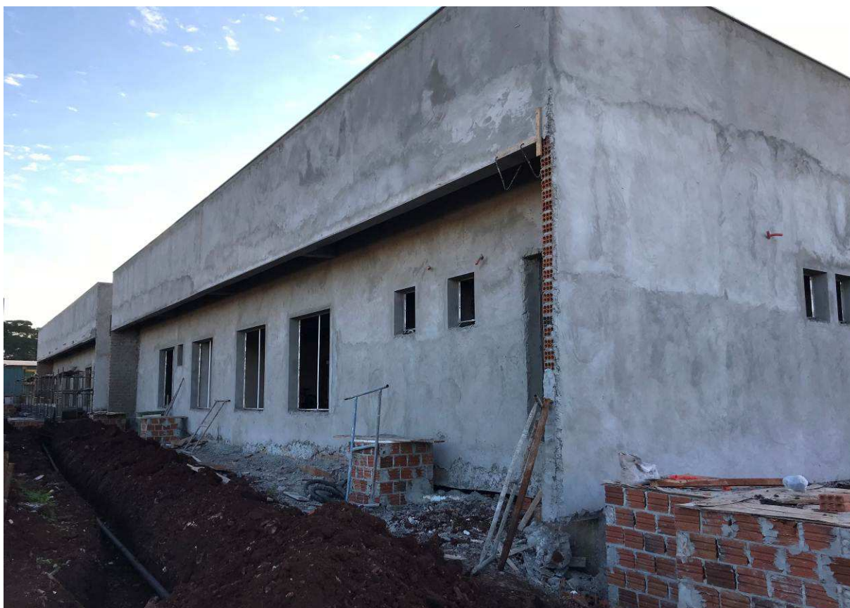
Figura 3 – Fórum - Vista externa.