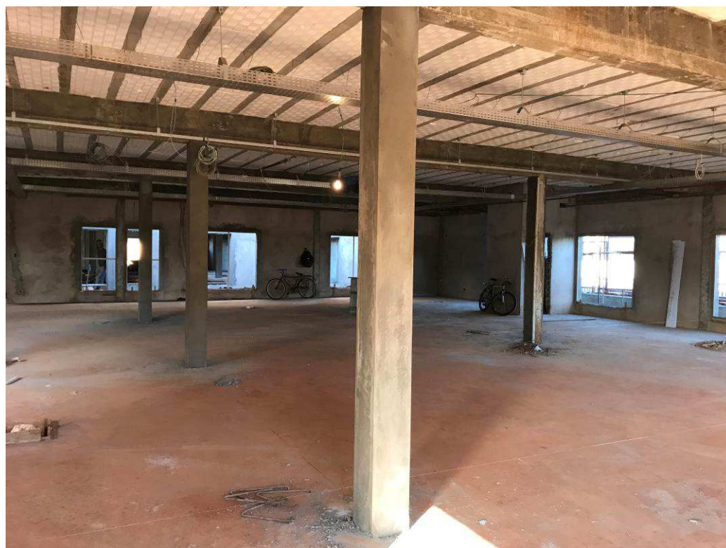
Figura 7 – Fórum - Vista interna - 2ª Vara.