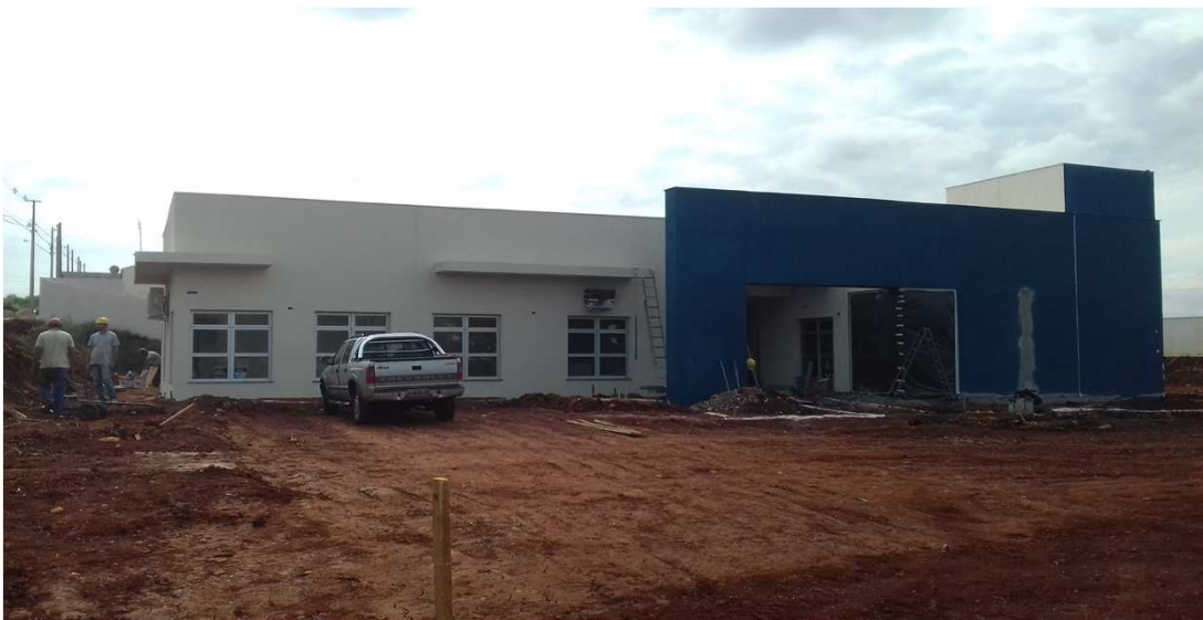
visão geral da obra

Esta 13ª medição da planilha contratual atingiu o valor de R$ 227.798,88 (duzentos e vinte e sete mil, setecentos e noventa e oito reais e oitenta e oito centavos), que corresponde a um percentual de 13,45% para a medição e 80,28% acumulado. Estava previsto, no cronograma atualizado, um acumulado de 89,21%, isto é, a obra atrasou 8,93% nesta etapa em relação ao cronograma atual. Restando 19,72% da obra por executar e, com a previsão contratual de término da obra para a data de 21/06/18, a contratada apresentou novo cronograma, formalizando um pedido de 30 dias de prazo, alegando dentre outros fatos, o período de paralização dos caminhoneiros que, segundo infomaram, além de prejudicar os trabalhos no intervalo de paralisação, ainda continua a dificultar a execução dos serviços, visto ainda não ter sido normalizado o fornecimento de alguns insumos.