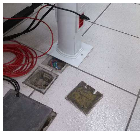
Figura 04E: Retirada de pontos elétricos desativados