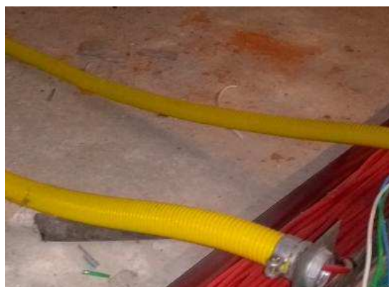
Figura 05E: Eletroduto PVC 32 mm