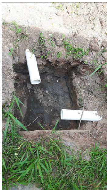
Figura 05c: tubulação captação águas pluviais