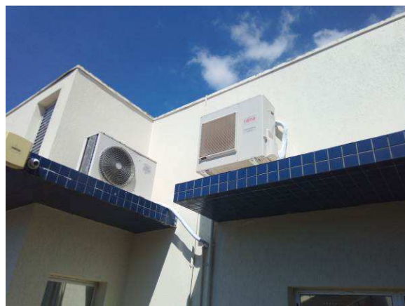
Figura 06c: equipamentos de ar condicionado instalados na marquise