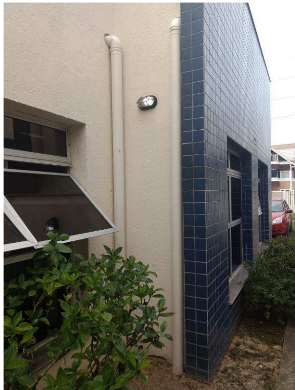
Figura 03c: prumadas executadas e caixa executada - face externa do edifício