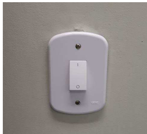
Figura 10E: Interruptor bipolar