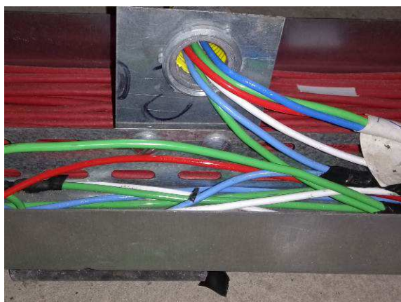
Figura 08E: Cabo de cobre 2,5 mm 2