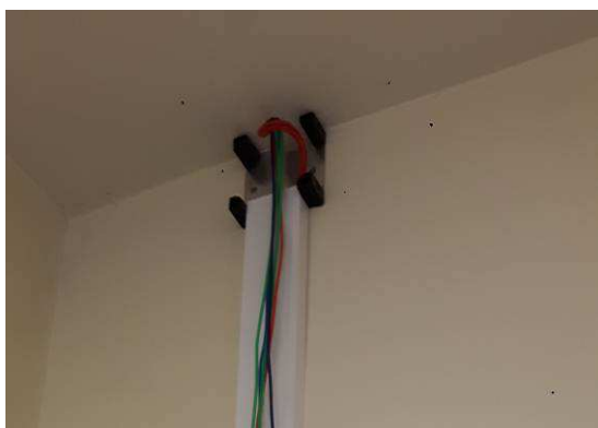
Figura 05E: Furo em concreto