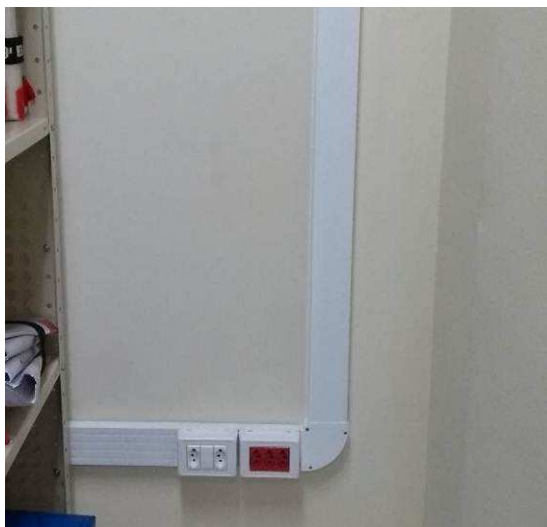
Figura 17E: Canaleta de alumínio