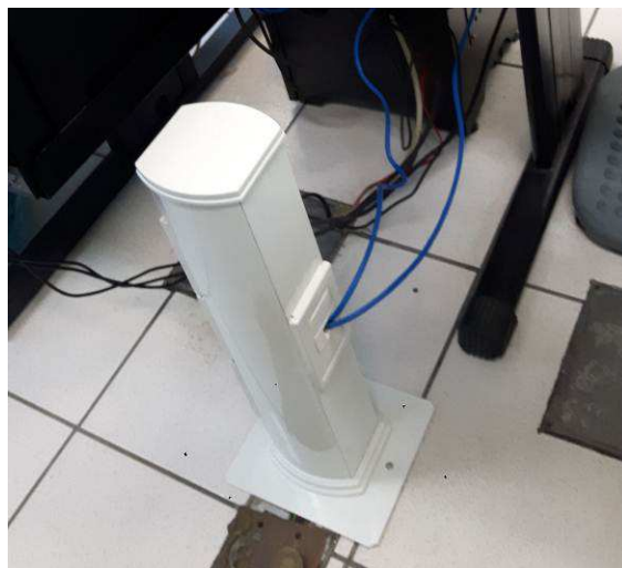
Figura 18E: Acessórios de rede lógica