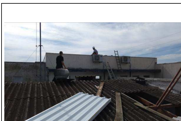
Figura 01c: demolição do telhamento em fibrocimento