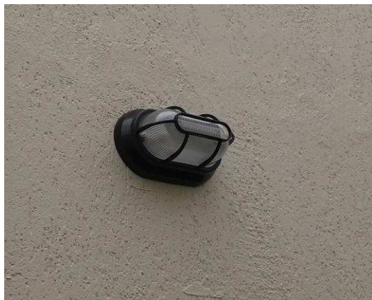
Figura 13E: Luminária externa tipo tartaruga