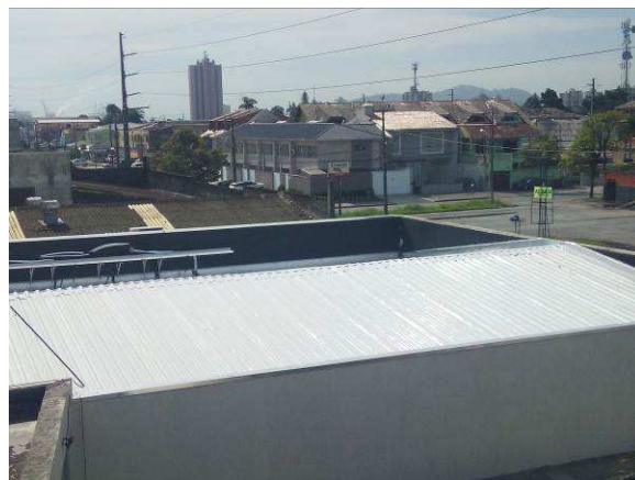
Figura 08c: instalação de telha termoacústica