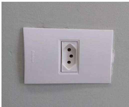
Figura 09E: Tomada 2P+T