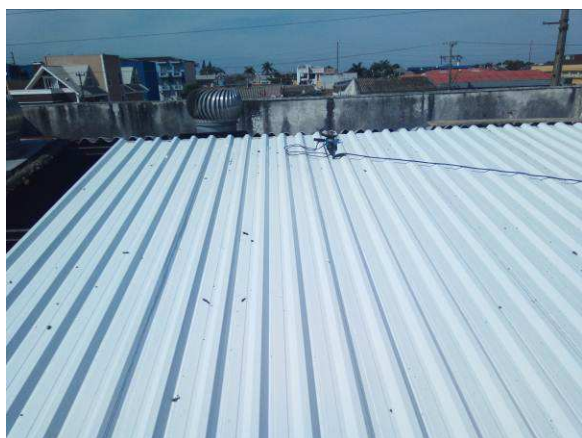
Figura 09c: instalação de telha termoacústica