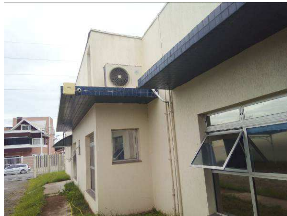
Figura 04c: equipamento de ar condicionado - instalado na marquise - face externa do imóvel.