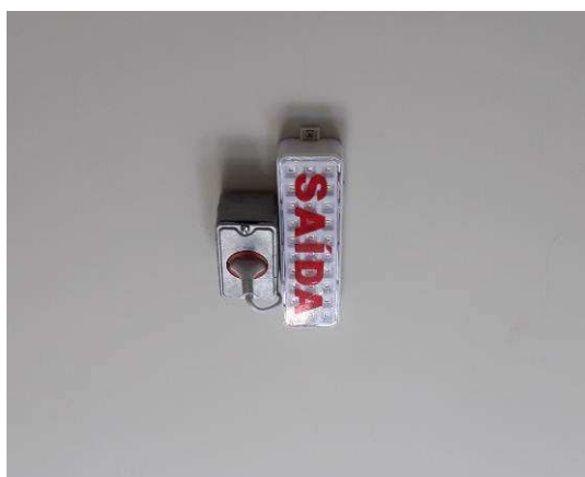
Figura 12E: Luminária de emergência