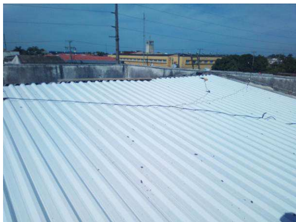
Figura 07c: instalação de telha termoacústica