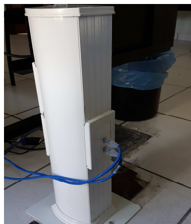
Figura 02E: Adequação de pontos lógicos