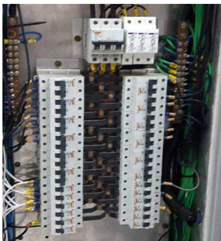
Figura 15E: Disjuntores