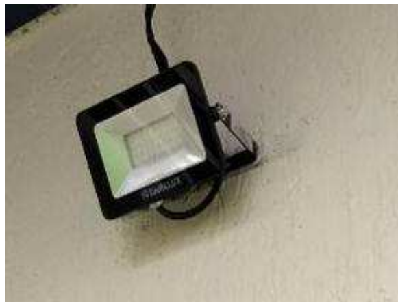
Figura 14E: Refletor externo