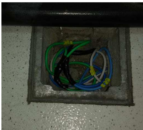
Figura 07E: Cabo de cobre 2,5 mm 2