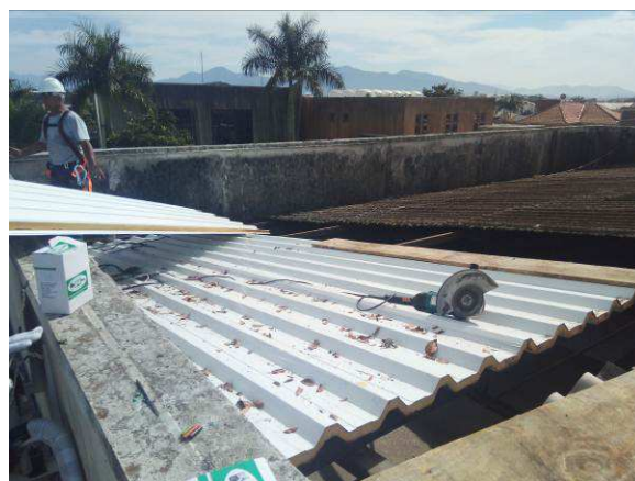
Figura 10c: instalação de telha termoacústica