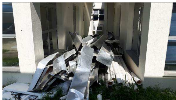
Figura 02c: calhas e rufos metálicos retirados