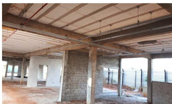
Figura 8E: Eletrocalhas, perfilados, acessórios, Tês, Curvas.