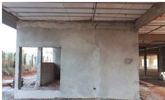
Figura 12E: Caixas 2x4" embutidas em alvenaria