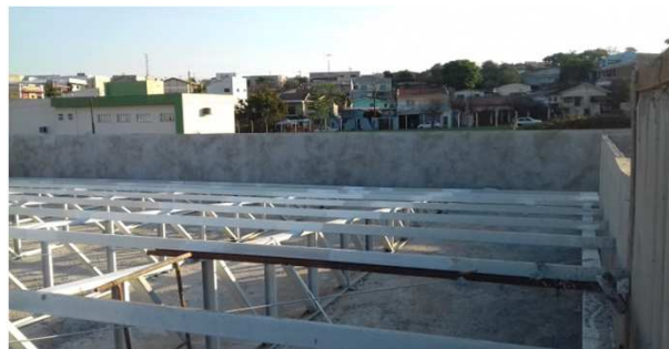
Figura 20C: rebôco interno de platibanda - fundo e lateral esquerda