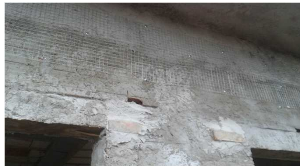
Figura 13C: tela para prevenção de trincas, fixada e aguardando rebôco