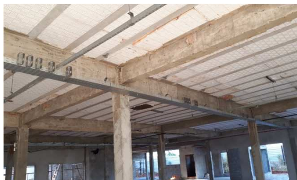
Figura 4E: Eletrocalhas, perfilados, acessórios, Tês, Curvas.