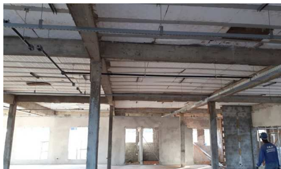
Figura 16E: Eletrodutos rígidos roscáveis e eletrodutos corrugados