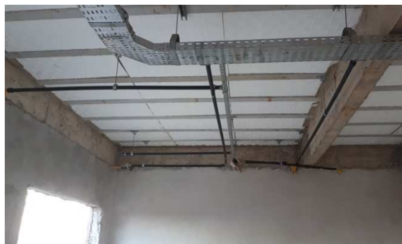
Figura 18E: Eletrodutos rígidos roscáveis e eletrodutos corrugados