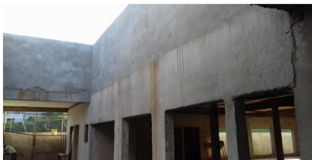
Figura 17C: rebôco da platibanda do bloco central