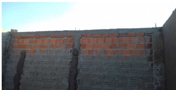
Figura 08C: alvenaria de fechamento em um dos reservatórios do fórum