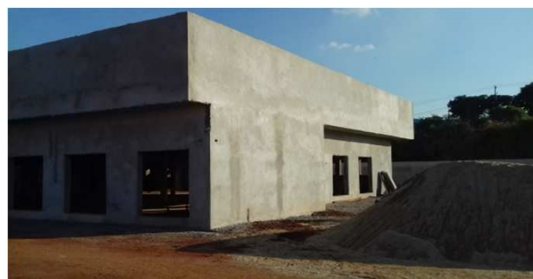
Figura 16C: rebôco da platibanda lateral direita