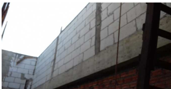
Figura 05C: pilaretes de travamento da platibanda e vigas cinto de amarração - fosso de luz