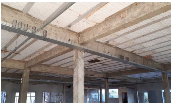
Figura 5E: Eletrocalhas, perfilados, acessórios, Tês, Curvas.