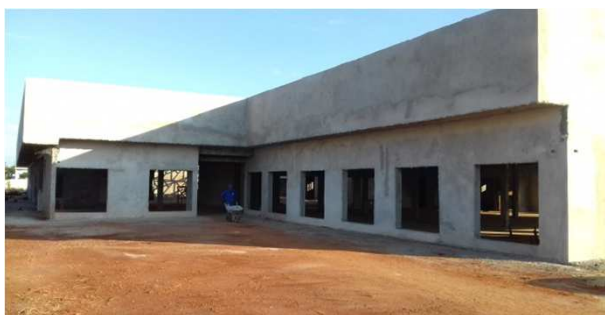
Figura 15C: rebôco de platibanda frontal (bloco da direita) e lateral (bloco central)