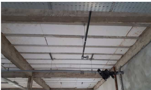
Figura 15E: Eletrodutos rígidos roscáveis e eletrodutos corrugados