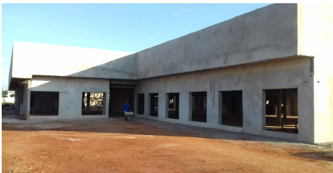
Figura 01C: Visão geral da obra

Considerando a instituição da Comissão de Recebimento e Fiscalização da CONSTRUÇÃO DO FÓRUM TRABALHISTA DE APUCARANA, objeto do Contrato Nº 34/2017, CP 04/2016, com efeitos através do despacho exarado pela Sra. Ordenadora da Despesa, os componentes abaixo elencados apresentam o relatório fotográfico das vistorias realizadas, que tiveram como objetivo a fiscalização dos serviços executados pela Contratada, no período de 27/03/2018 até 02/05/2018 (décima medição).