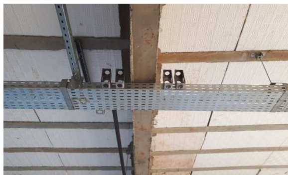
Figura 2E: Eletrocalhas, perfilados, acessórios, Tês, Curvas.