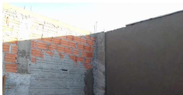
Figura 07C: pilaretes de travamento da platibanda e vigas cinto de amarração - reservatório do fórum