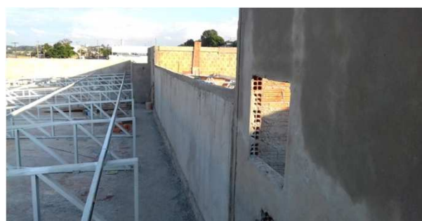
Figura 11C: fechamento da platibanda - bloco central - próximo aos reservatórios