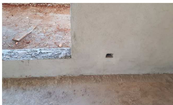
Figura 10E: Caixas 2x4" embutidas em alvenaria