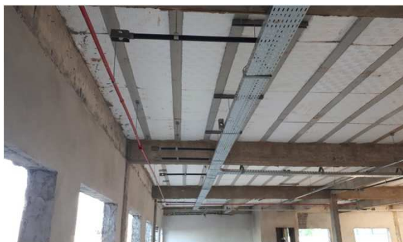
Figura 1E: Eletrocalhas, perfilados, acessórios, Tês, Curvas.