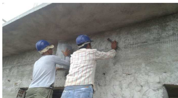
Figura 12C: aplicação de tela para prevenção de trincas, entre viga e alvenaria