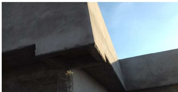
Figura 19C: detalhe de rebôco executado em canto de platibanda