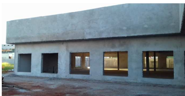
Figura 10C: alvenaria de platibanda - bloco central - face direita