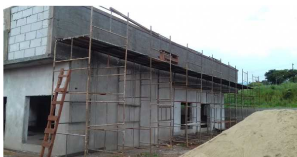
Figura 22C: chapisco executado em platibanda