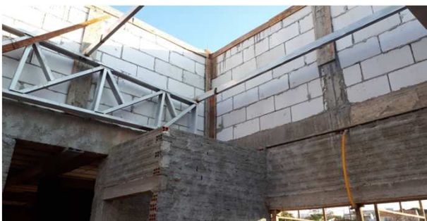
Figura 06C: pilaretes de travamento da platibanda e vigas cinto de amarração - bloco central