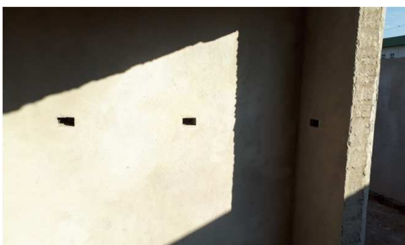
Figura 9E: Caixas 2x4" embutidas em alvenaria