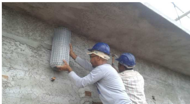
Figura 14C: operários fazendo a aplicação da tela de revestimento