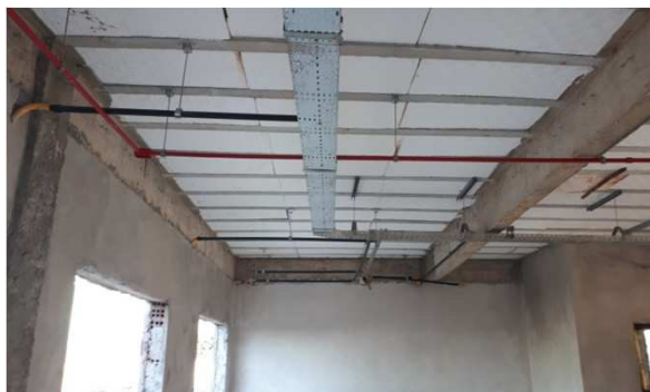
Figura 17E: Eletrodutos rígidos roscáveis e eletrodutos corrugados