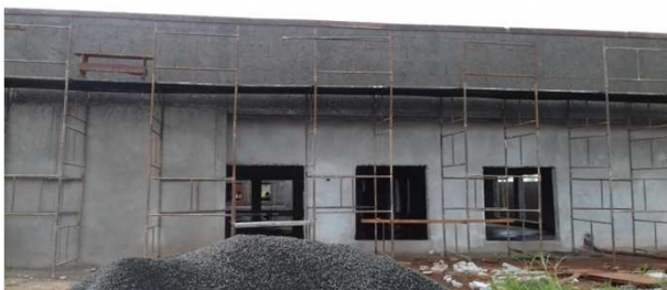
Figura 21C: chapisco executado em platibanda