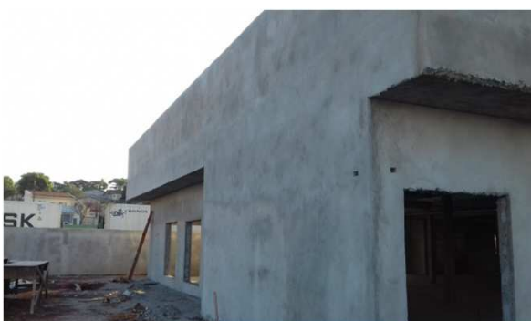
Figura 13E: Caixas 2x4" embutidas em alvenaria