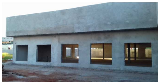
Figura 18C: reboco da plativanda frontal (bloco esquerdo)