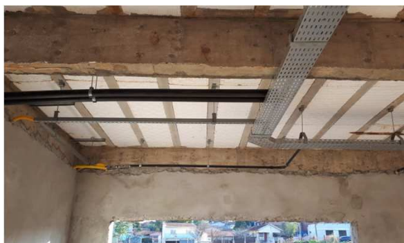
Figura 3E: Eletrocalhas, perfilados, acessórios, Tês, Curvas.