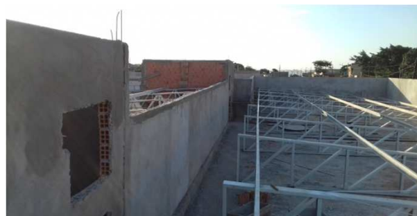
Figura 09C: alvenaria de fechamento em platibanda e reservatórios