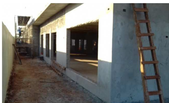
Figura 14E: Caixas 2x4" embutidas em alvenaria