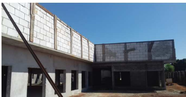
Figura 04C: pilaretes de travamento da platibanda e vigas cinto de amarração - bloco da esquerda - frontal