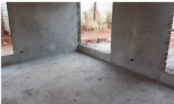
Figura 11E: Caixas 2x4" embutidas em alvenaria