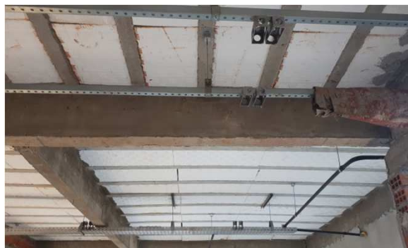
Figura 6E: Eletrocalhas, perfilados, acessórios, Tês, Curvas.