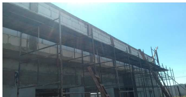
Figura 03C: pilaretes de travamento da platibanda e vigas cinto de amarração - lateral esquerda