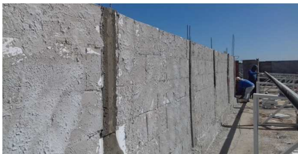
Figura 02C: pilaretes de travamento da platibanda e vigas cinto de amarração - bloco da esquerda