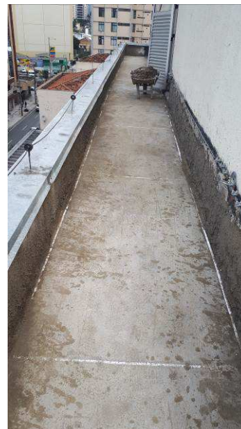
Figura 12C: aplicação de manta asfáltica na área de cobertura.