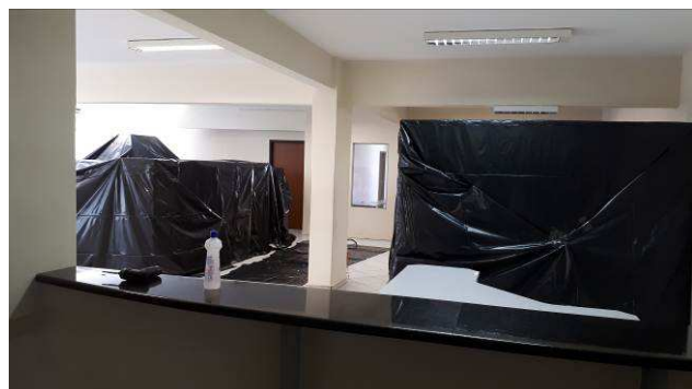
Figura 13c: preparo do local - proteção do mobiliário da 1ª VT.