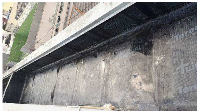
Figura 11C: aplicação de manta asfáltica na área de cobertura.