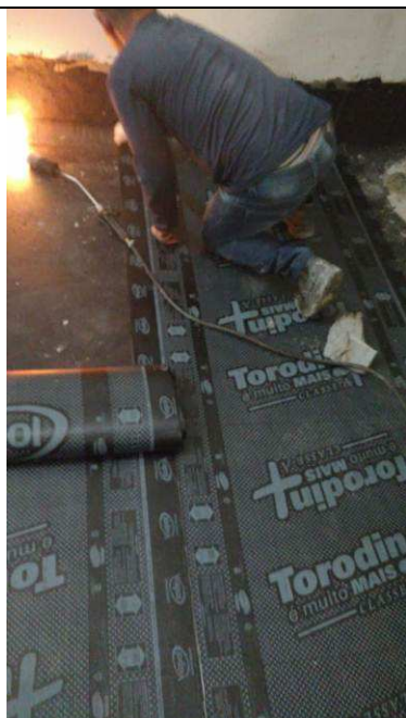
Figura 05C: Aplicação de manta asfáltica rampa ventilação 20ª VT