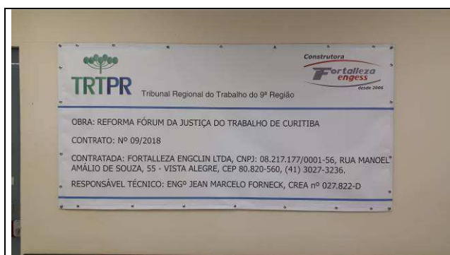
Figura 01C: Placa de obra.