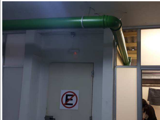
Figura 08C: : prumada de coleta de água - rampa ventilação 20ª VT.