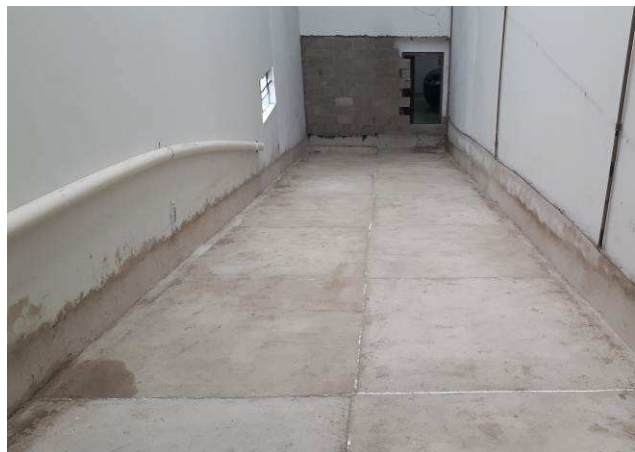
Figura 04C: aos fundos: local onde existia o depósito que foi removido