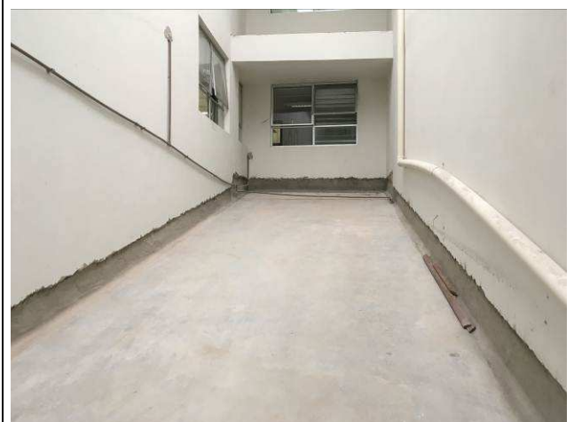
Figura 02C: Preparo de superfície para tratamento da rampa para impermeabilização