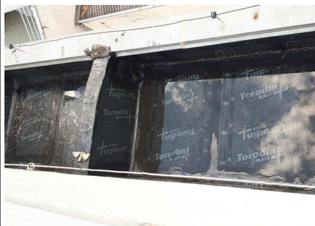
Figura 10C: aplicação de manta asfáltica na área de cobertura.