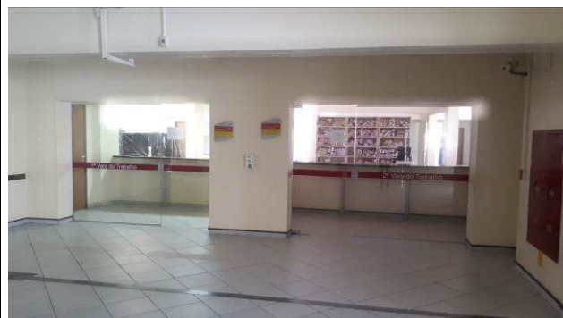
Figura 14C: preparo do local - espera da 1ª e 2ª VT.