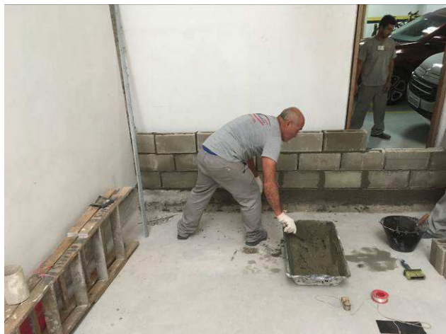
Figura 03C: fechamento de vão - preparo da rampa para impermeabilização