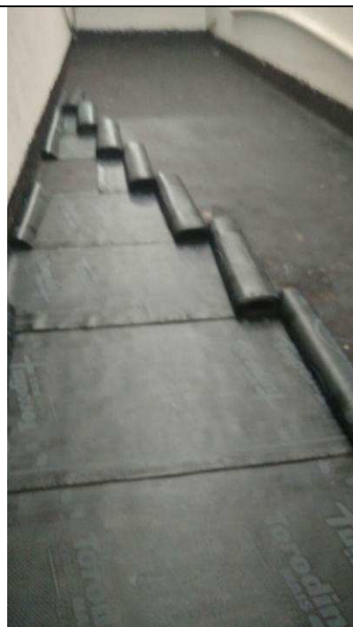
Figura 06C: Aplicação de manta asfáltica rampa ventilação 20ª VT