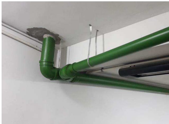
Figura 07C: prumada de coleta de água - rampa ventilação 20ª VT.