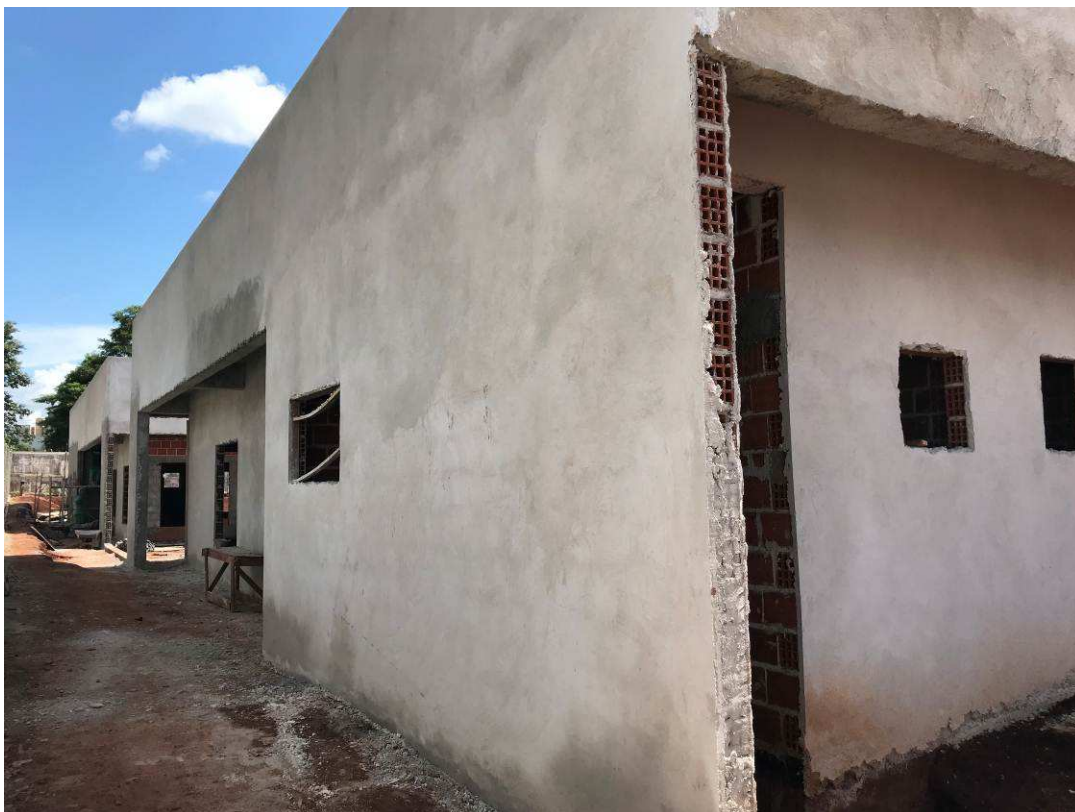
Figura 3 – Prédio do Fórum.