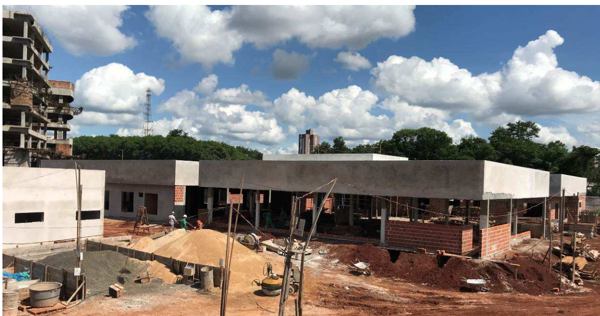
Figura 1 – Vista geral da obra.

(Supra-estrutura), 16,77% do item 06 (Paredes e painéis), 0,00% do item 07 (Esquadrias), 60,81% do item 08 (Cobertura), 7,62% do item 09 (Impermeabilização e tratamentos), 0,00% do item 10 (Forro), 23,97% do item 11 (Revestimento internos), 64,92% do item 12 (Revestimento externos), 7,85% do item 13 (Pisos internos/externos), 4,45% do item 14 (Rodapés, soleiras e peitoris), 7,10% do item 15 (Instalações hidrossanitárias), 0,77% do item 16 (Instalações de ar condicionado), 0,00% do item 17 (Instalações de prevenção contra incêndios), 0,42% do item 18 (Paisagismo e serviços internos), 9,33% do item 19 (Pinturas), 0,00% do item 20 (Serviços complementares), 0,00% do item 21 (Limpeza da obra), 0,00% do item 22 (Instalações elétricas), 0,00% do item 23 (Sistemas elétricos de combate a incêndio), 0,00% do item 24 (Instalações lógicas, CFTV, telefonia, alarme), e 0,00% do item 25 (sistema de proteção contra descargas atmosféricas). Porém, a Contratada executou 3,45% do valor previsto para o item 01, 1,76% do item 02, 0,00% do item 03, 0,00% do item 04, 1,01% do item 05, 9,57% do item 06, 0,00% do item 07, 48,37% do item 08, 0,00% do item 09, 0,00% do item 10, 4,44% do item 11, 16,23% do item 12, 0,00% do item 13, 0,00% do item 14, 4,10% do item 15, 0,00% do item 16, 0,00% do item 17, 0,00% do item 18, 7,84% do item 19, 0,00% do item 20, 0,00% do item 21, 0,00% do item 22, 0,00% do item 23, 0,00% do item 24, e 0,00% do item 25.