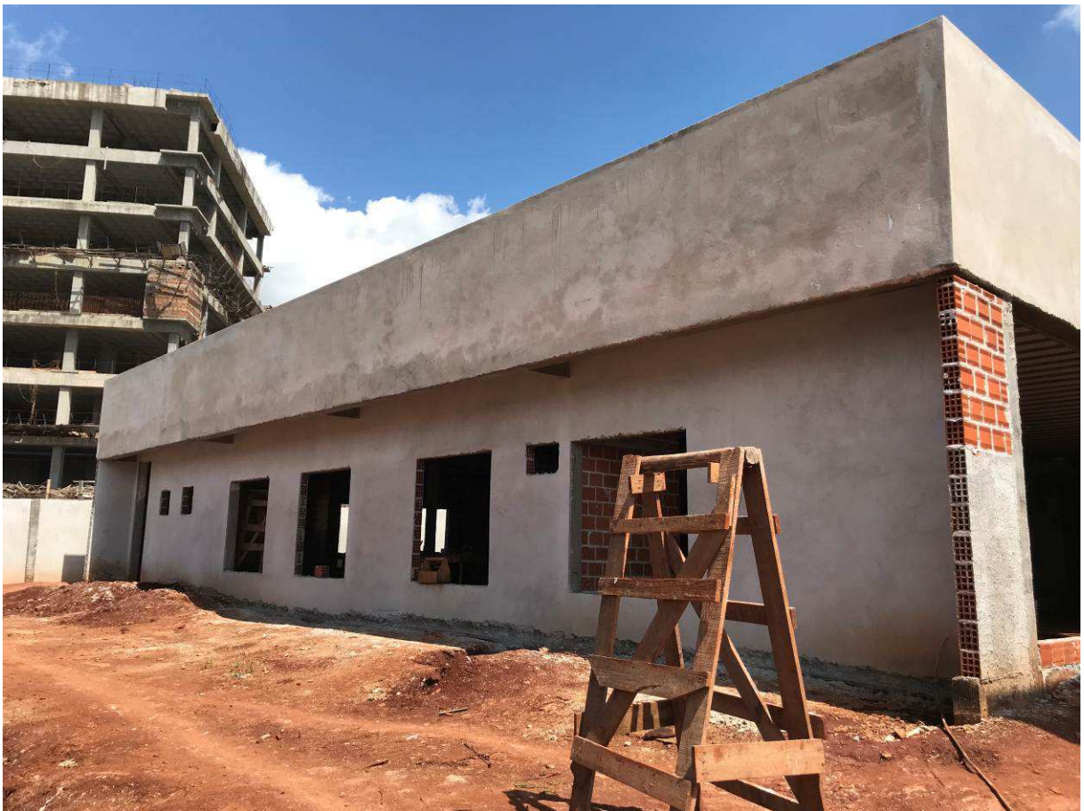
Figura 3 – Prédio do Fórum.