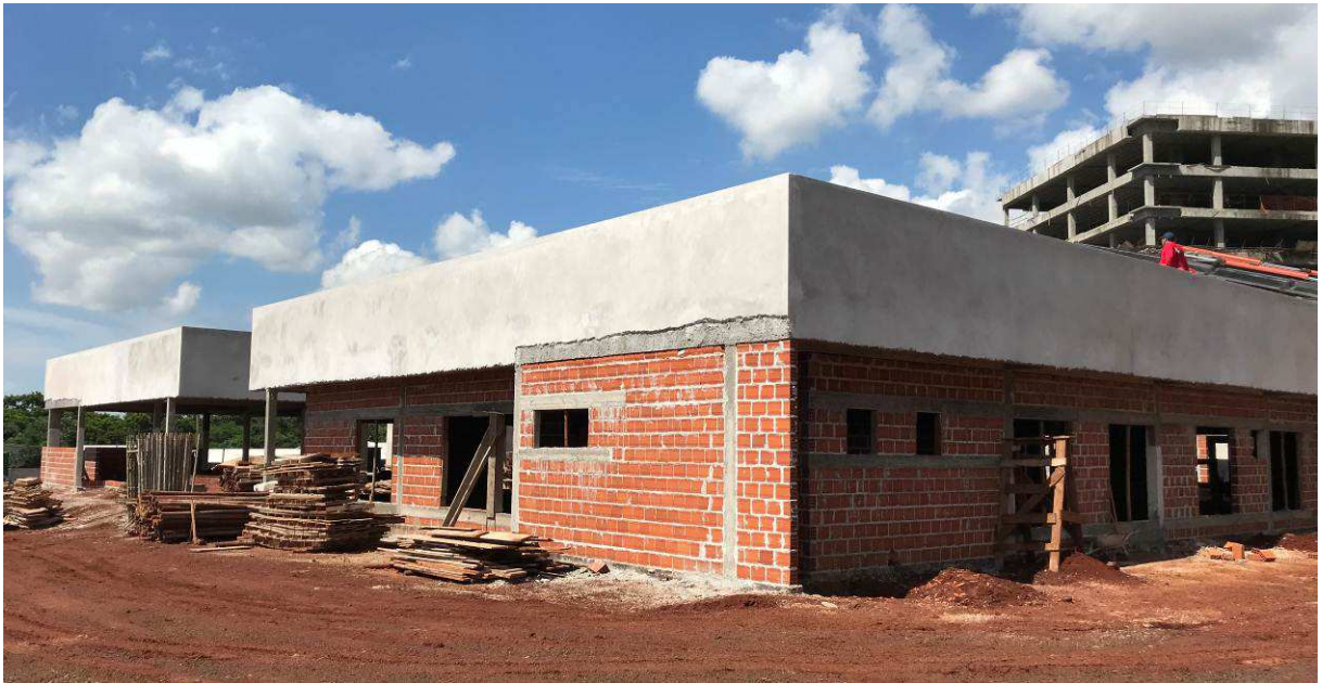
Figura 2 – Prédio do Fórum.