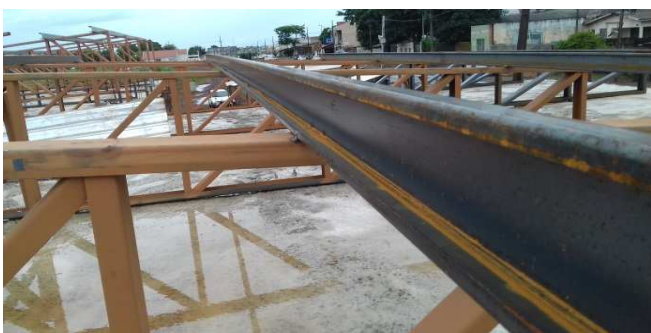
Figura 25: Detalhe de uma terça em U enrijecido