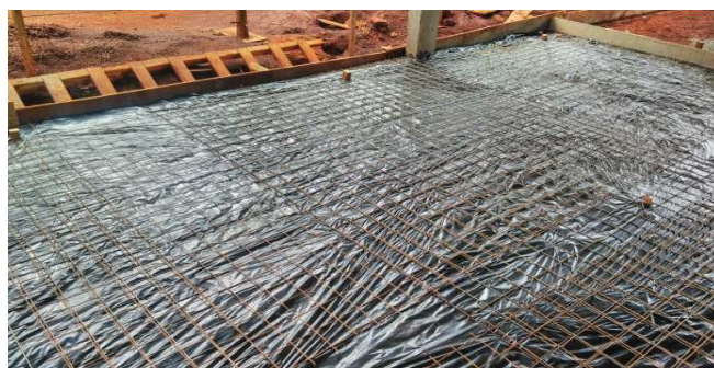
Figura 30: Trecho já preparado para concretagem - Tela soldada assentada sobre lona plástica