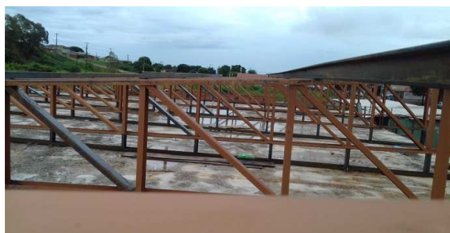
Figura 24: Detalhe de tesouras instaladas no bloco da direita