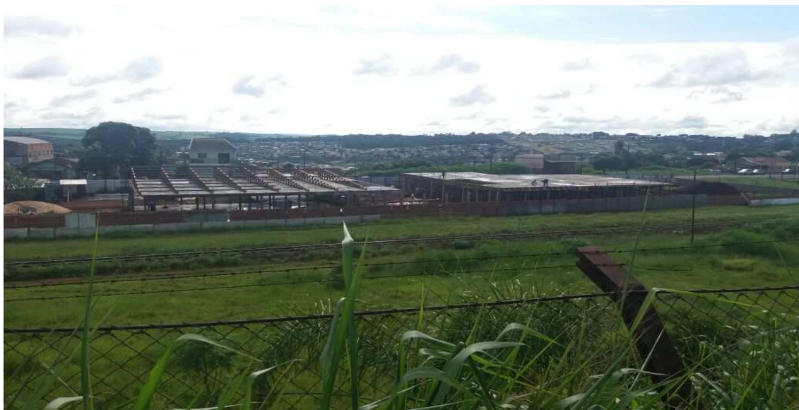
Figura 21: Visão geral do terreno com ambas as lajes concretadas. No primeiro bloco, o início da execução da cobertura