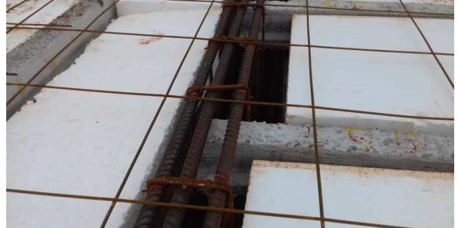
Figura 10: Armaduras de vigas e laje (distribuição)