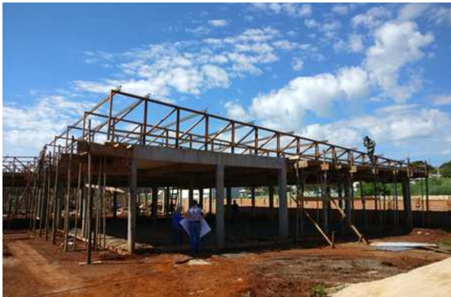
Figura 01: Visão geral da obra

Considerando a instituição da Comissão de Recebimento e Fiscalização da CONSTRUÇÃO DO FÓRUM TRABALHISTA DE APUCARANA, objeto do Contrato Nº 34/2017, CP 04/2016, com efeitos através do despacho exarado pela Sra. Ordenadora da Despesa, os componentes abaixo elencados apresentam o relatório fotográfico das vistorias realizadas, que tiveram como objetivo a fiscalização dos serviços executados pela Contratada, no período de 05/12/2017 até 10/01/2018 (sexta etapa).