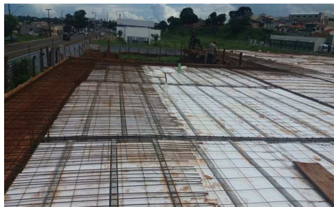
Figura 18: Armaduras de laje maciça (marquize) - No detalhe as armaduras negativas