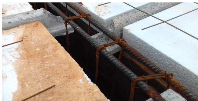
Figura 07: Armadura de viga