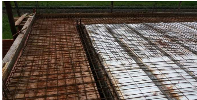
Figura 16: Fôrmas e armaduras de laje maciça (marquize)