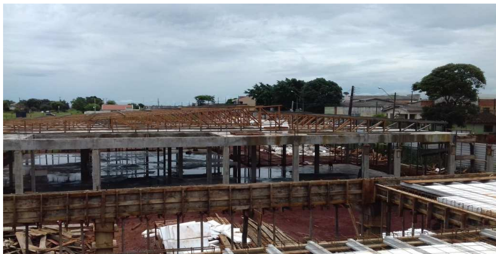
Figura 27: Visão geral das tesouras e terças instaladas na cobertura do bloco da direita