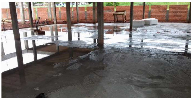
Figura 32: Contrapiso do bloco da direita, após a cura do concreto