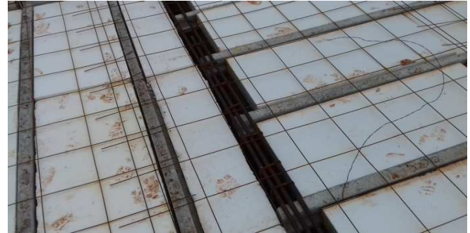
Figura 12: Armaduras de viga e laje (distribuição), além das vigotas protendidas