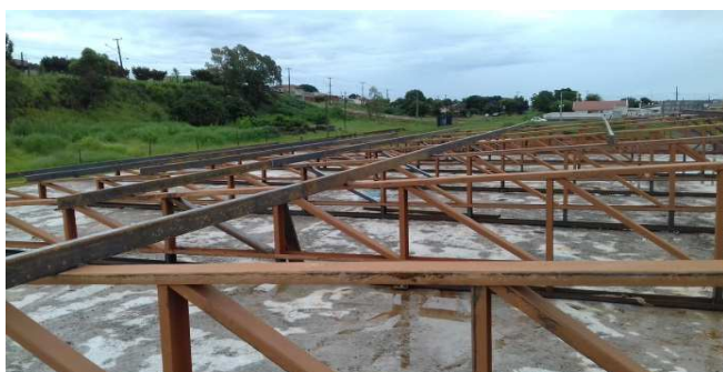
Figura 23: Estrutura de cobertura sobre o bloco da direita