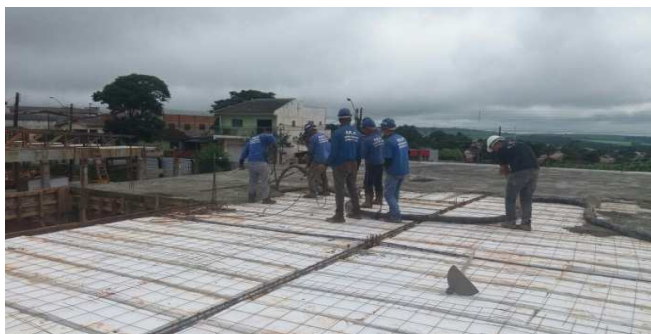
Figura 19: Início da concretagem dos panos de laje no bloco esquerdo