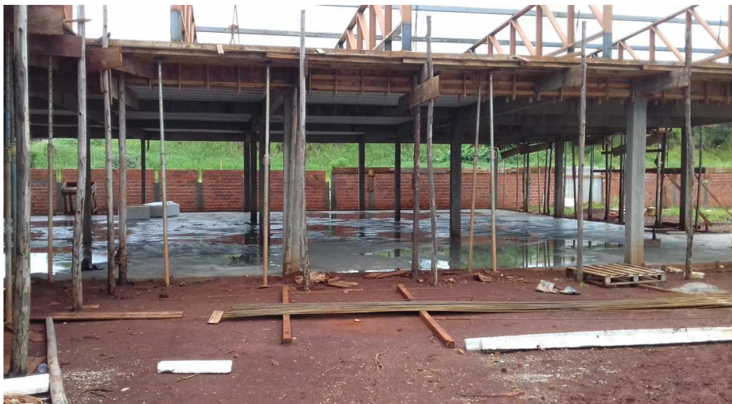
Figura 02: Trecho da porção central, com reaterro entre baldrames finalizado