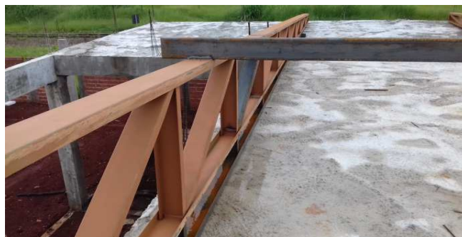
Figura 26: Terça fixada no banzo superior de uma tesoura