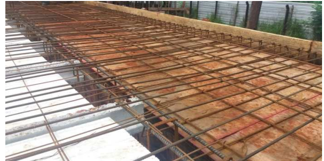
Figura 14: Fôrmas e armaduras de laje maciça (marquize)