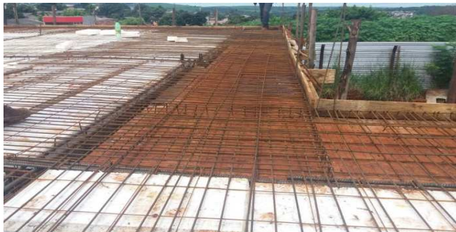
Figura 15: Fôrmas e armaduras de laje maciça (marquize)