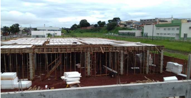
Figura 09: Visão geral da laje do bloco esquerdo, antes da concretagem