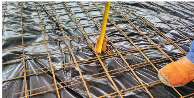
Figura 29: Aferição da altura do contrapiso, através de taliscamento