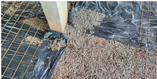
Figura 28: Preparo para concretagem do contrapiso, com lastro de brita e aplicação de tela soldada