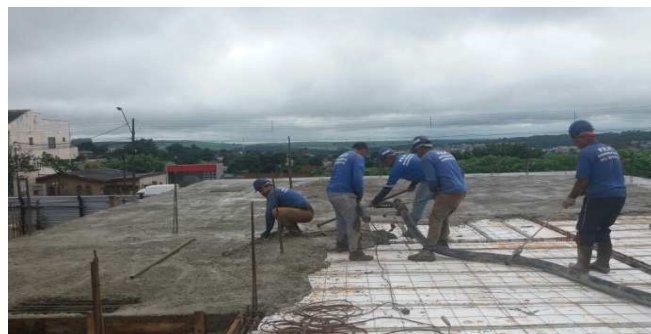
Figura 20: Início da concretagem dos panos de laje no bloco esquerdo