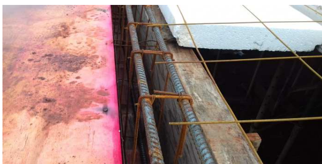
Figura 08: Armadura de viga