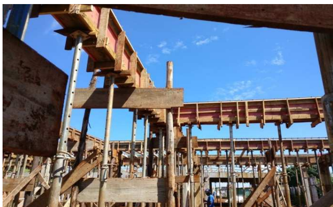
Figura 04: Formas e escoramento de vigas