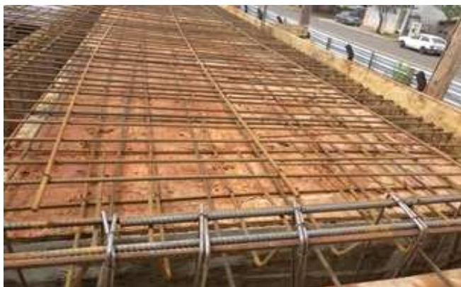
Figura 17: Fôrmas e armaduras de laje maciça (marquize) e viga