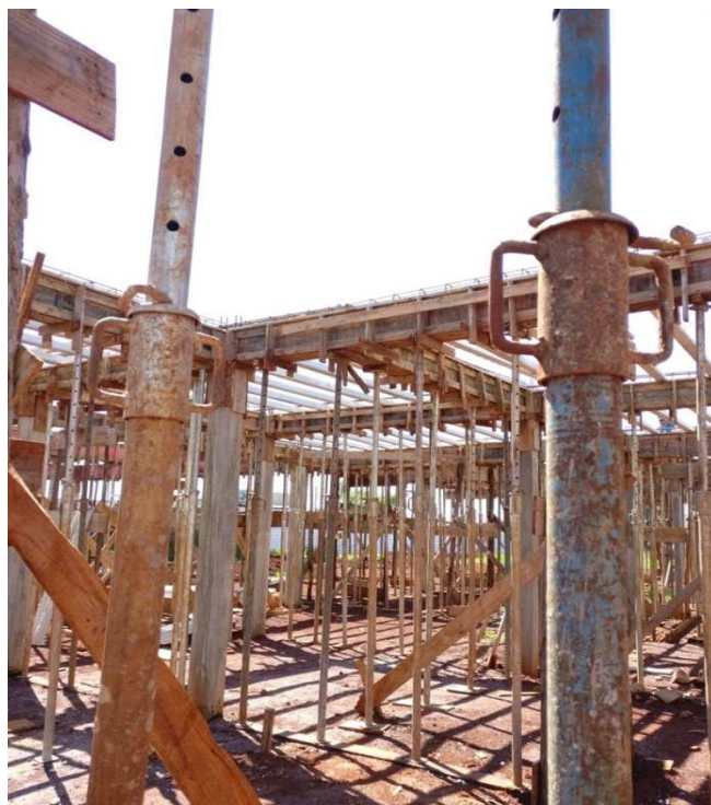
Figura 05: Formas e escoramento de vigas