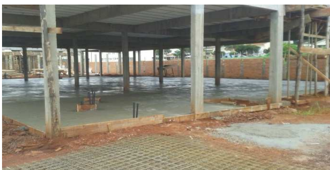
Figura 31: Contrapiso logo após a sua concretagem - bloco da direita