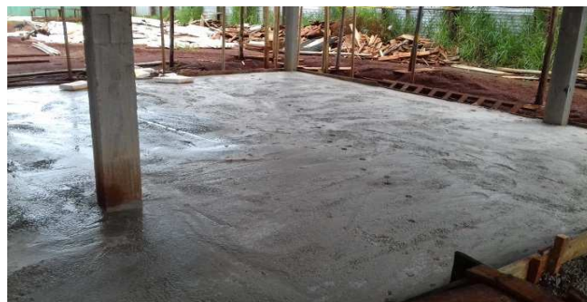
Figura 33: Contrapiso do bloco da direita, após a cura do concreto