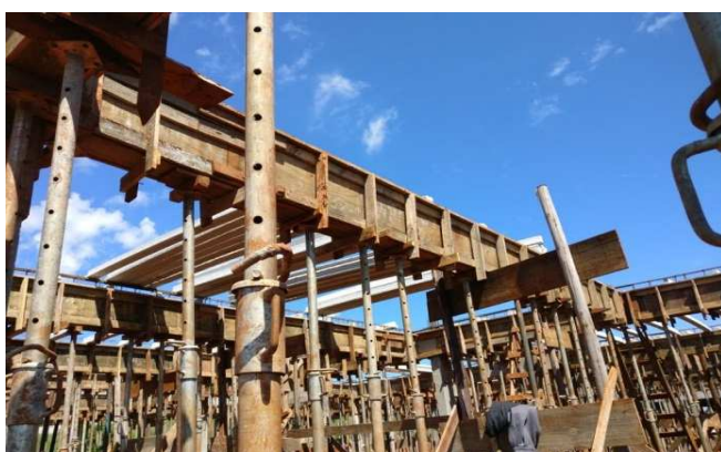
Figura 06: Formas e escoramento de vigas