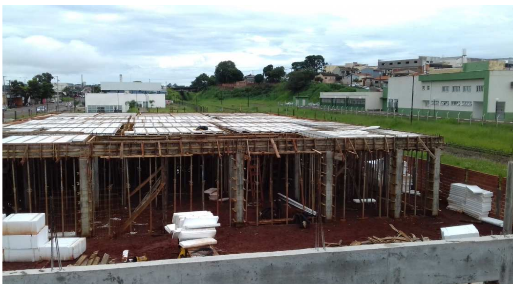
Figura 03: Trecho do bloco da esquerda, também com reaterro entre baldrames concluído