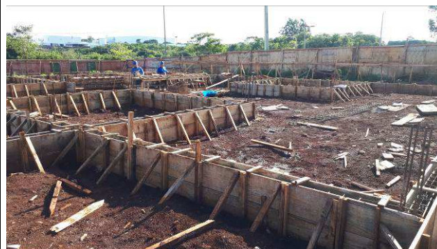
Figura 02C: Formas e armaduras das vigas baldrame.