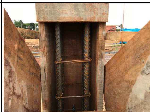
Figura 40C: Formas e armaduras dos pilares - abertura em meia altura.