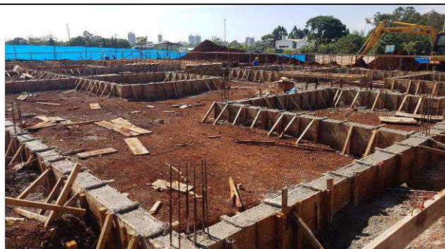
Figura 23C: Vigas baldrame concretadas.