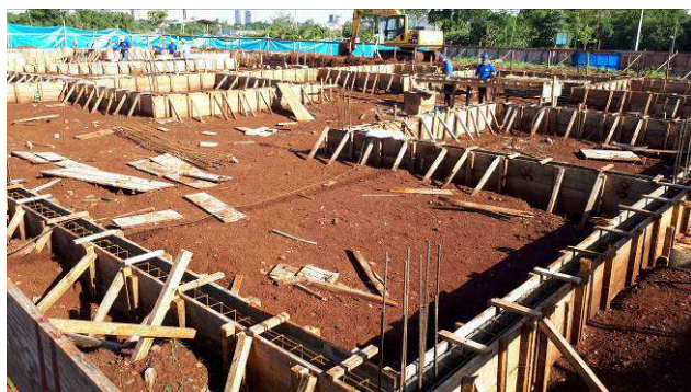
Figura 01C: Formas e armaduras das vigas baldrame.