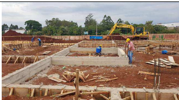
Figura 24C: Vigas baldrame concretadas.