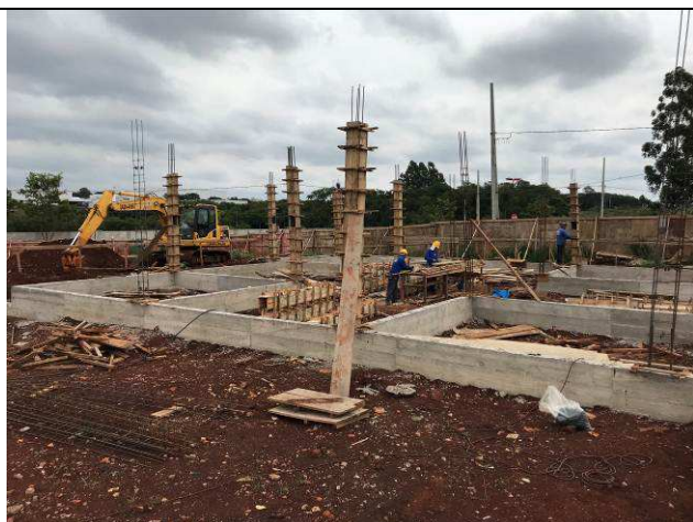
Figura 25C: Vigas baldrame concretadas.