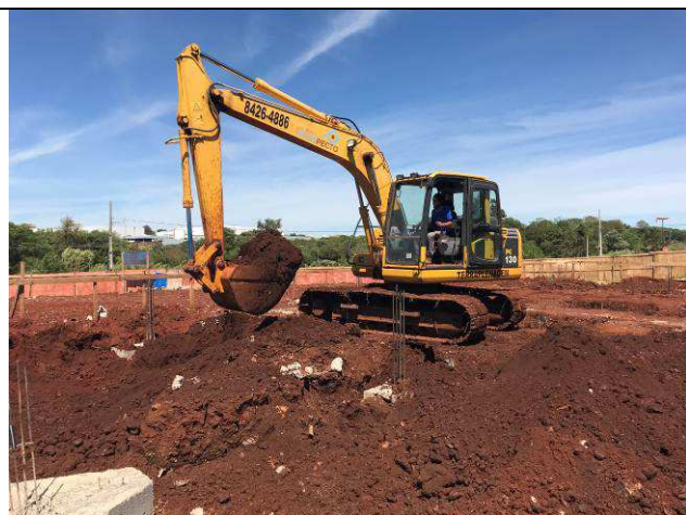
Figura 61C: Remoção do solo contaminado.