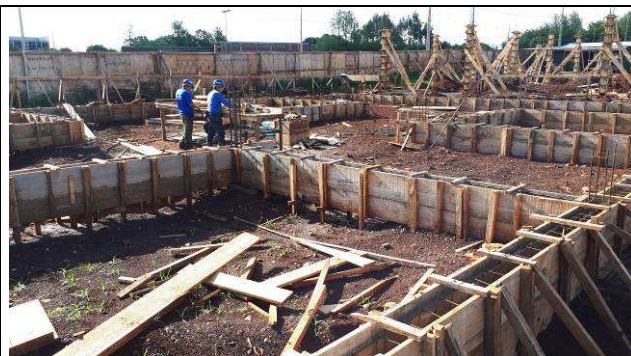
Figura 04C: Formas e armaduras das vigas baldrames.