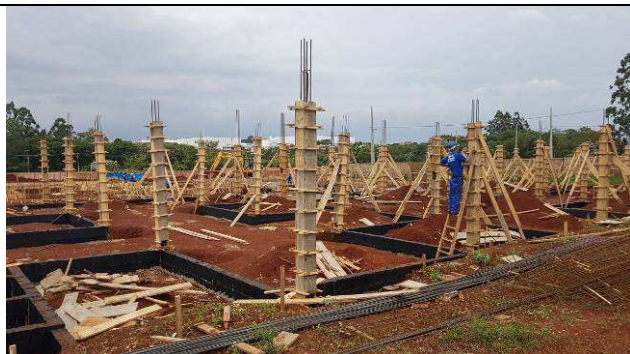
Figura 30C: Formas e armaduras dos pilares.