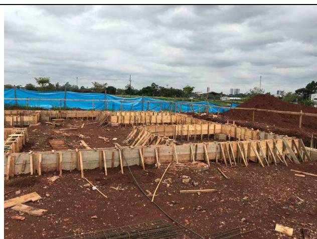
Figura 07C: Formas e armaduras das vigas baldrames.