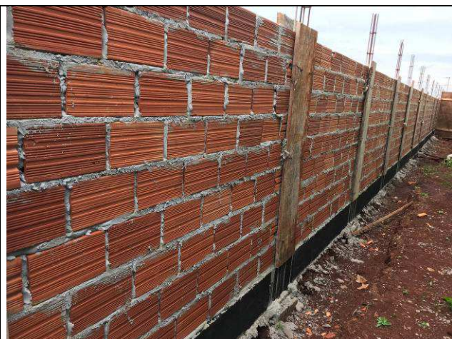
Figura 56C: Muro de fechamento - vigas baldrames, pilaretes e alvenaria.