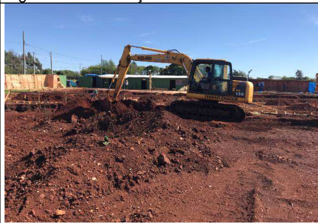
Figura 60C: Remoção do solo contaminado.