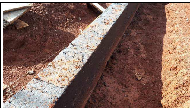
Figura 50C: Vigas baldrames impermeabilizadas.