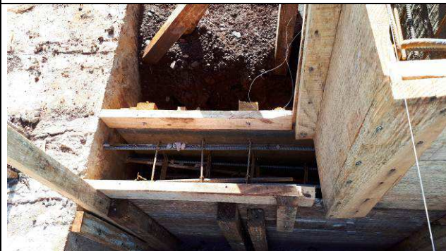
Figura 12C: Formas e armaduras das vigas baldrames.