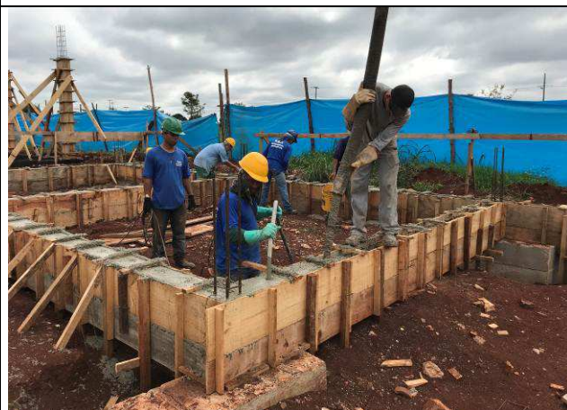
Figura 20C: Concretagem das vigas baldrames.