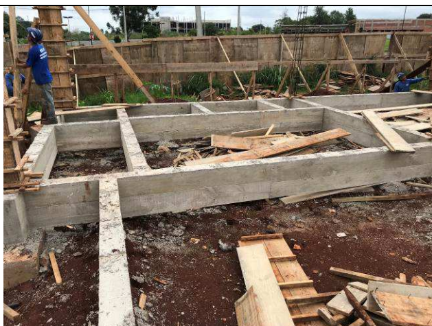
Figura 26C: Vigas baldrame concretadas.