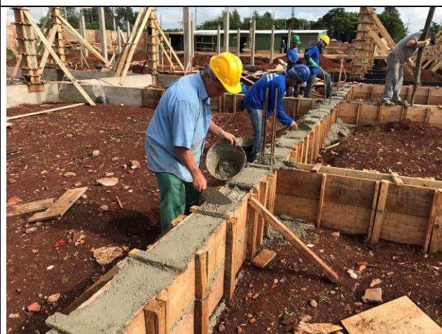
Figura 22C: Concretagem das vigas baldrames.