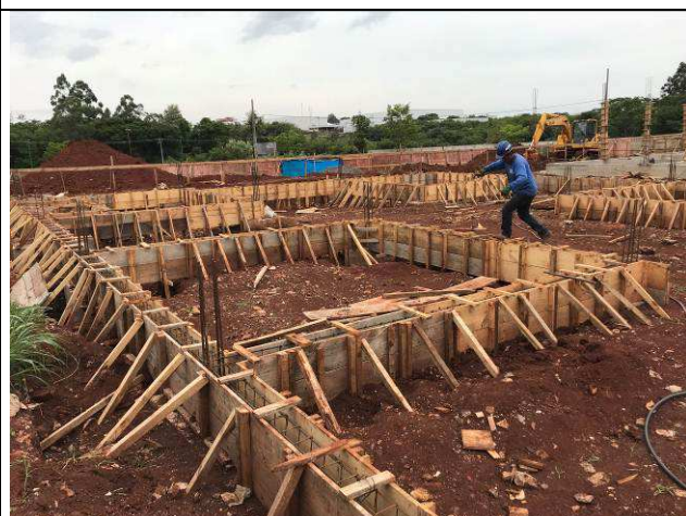
Figura 06C: Formas e armaduras das vigas baldrames.