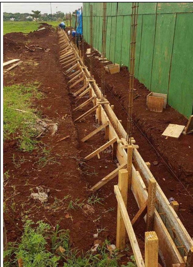
Figura 54C: Muro de fechamento - formas e armaduras vigas baldrame.