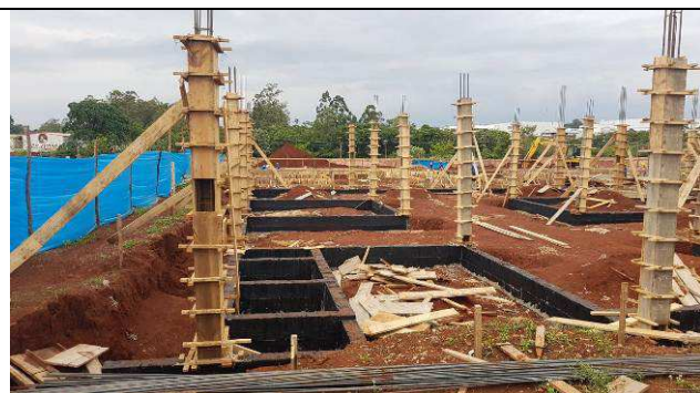
Figura 31C: Formas e armaduras dos pilares.