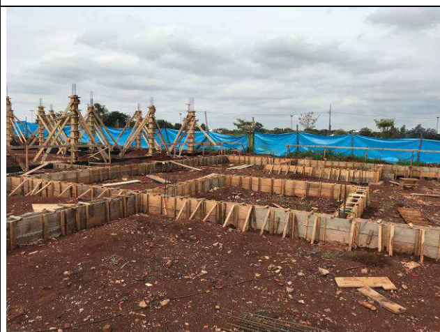
Figura 08C: Formas e armaduras das vigas baldrames.