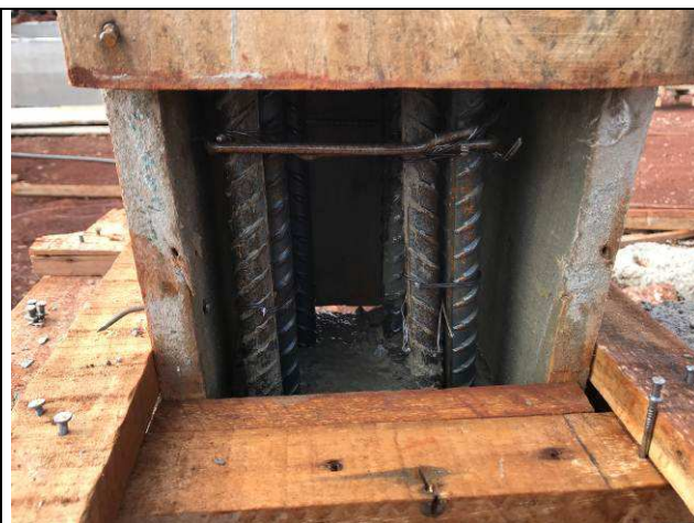
Figura 46C: Formas e armaduras dos pilares - base.