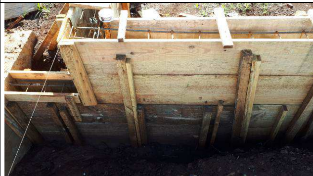
Figura 11C: Formas e armaduras das vigas baldrames.