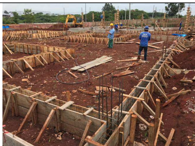
Figura 05C: Formas e armaduras das vigas baldrames.