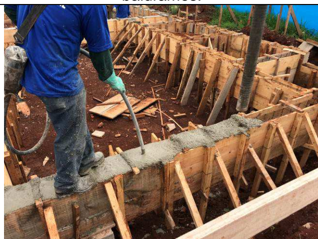
Figura 21C: Concretagem das vigas baldrames.