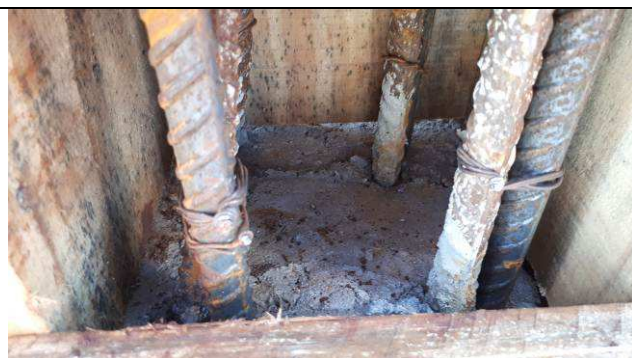
Figura 35C: Formas e armaduras dos pilares - arranques.