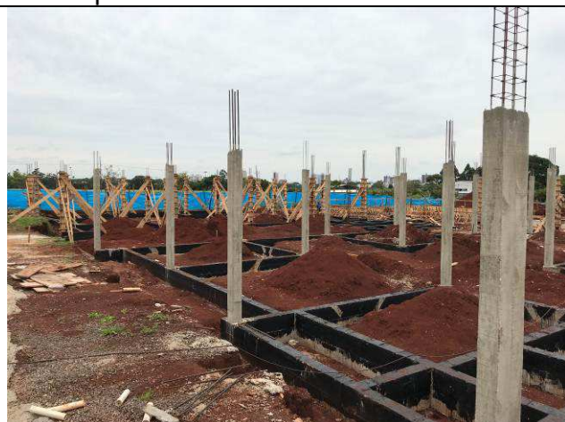
Figura 47C: Pilares concretados.