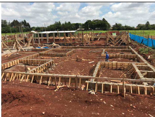
Figura 28C: Vigas baldrame concretadas.