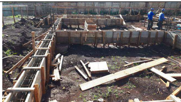
Figura 03C: Formas e armaduras das vigas baldrames.