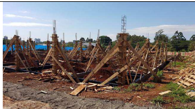
Figura 29C: Formas e armaduras dos pilares.