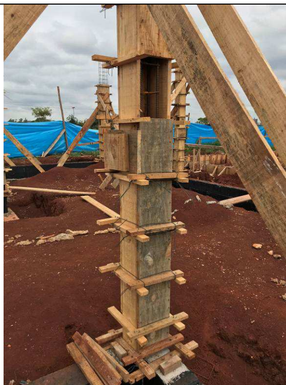
Figura 42C: Formas e armaduras dos pilares.