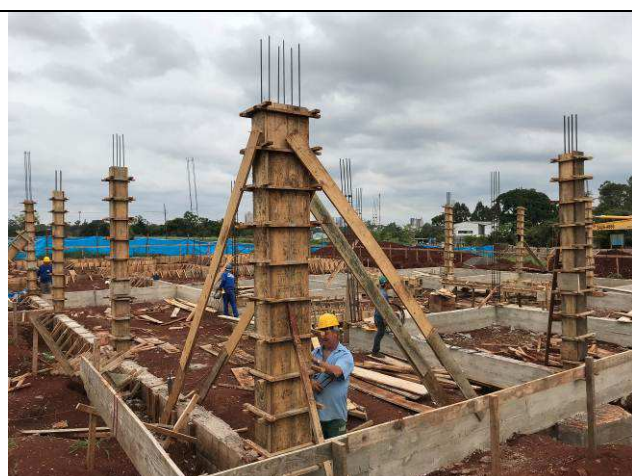
Figura 39C: Formas e armaduras dos pilares.