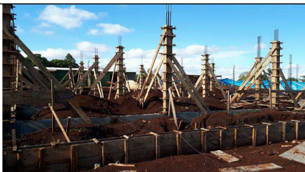
Figura 32C: Formas e armaduras dos pilares.