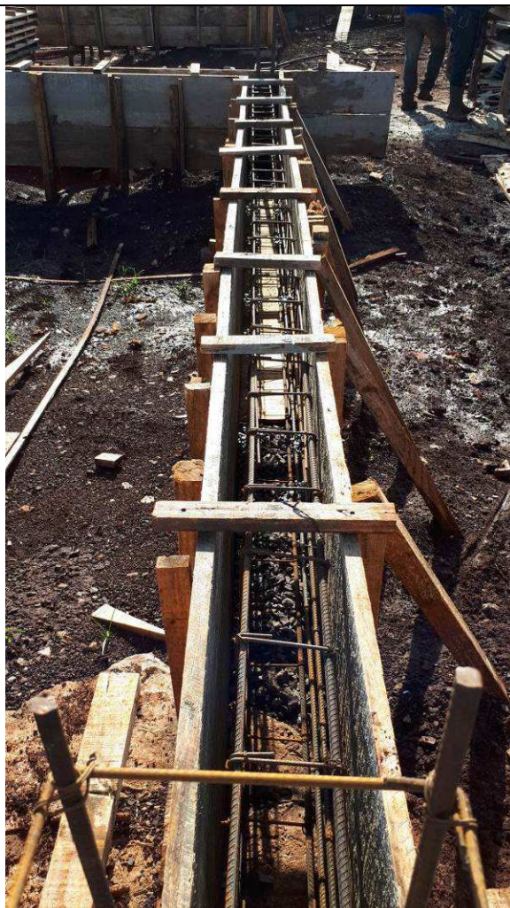
Figura 14C: Formas e armaduras das vigas baldrames.