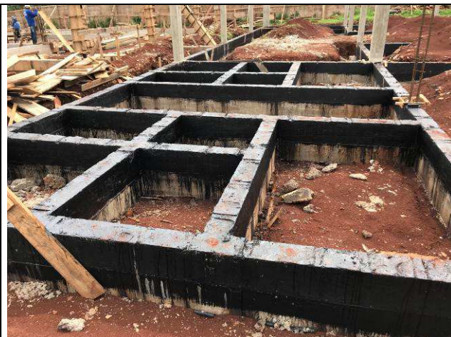
Figura 52C: Vigas baldrame impermeabilizadas.