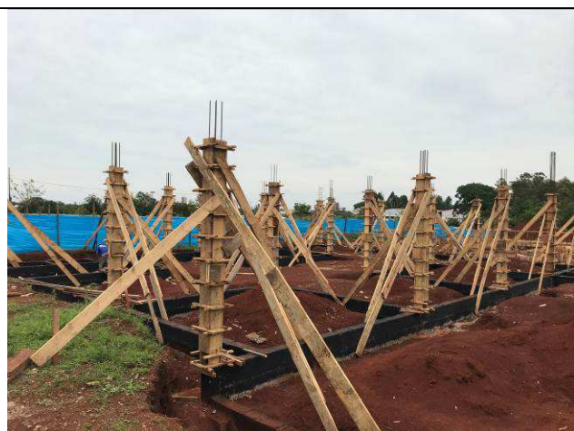
Figura 37C: Formas e armaduras dos pilares.