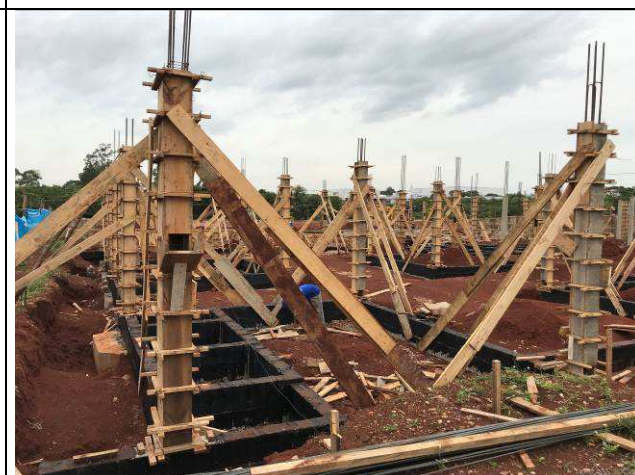
Figura 38C: Formas e armaduras dos pilares.