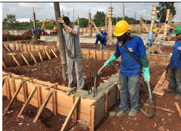
Figura 19C: Concretagem das vigas baldrames.