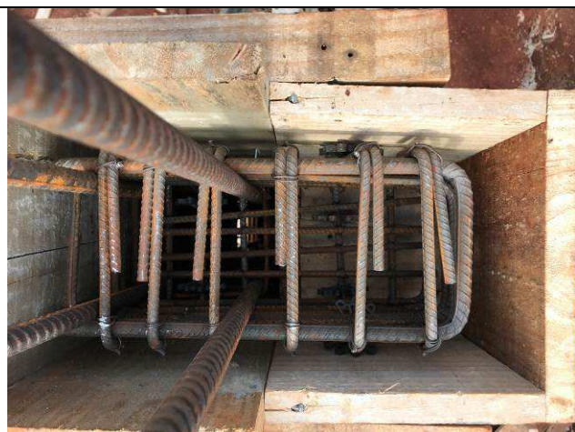
Figura 45C: Formas e armaduras dos pilares - armadura do console.