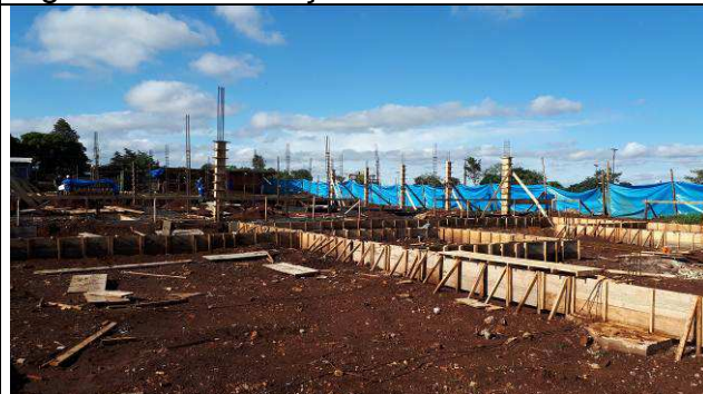
Figura 64C: Vigas baldrames na área de solo removido.