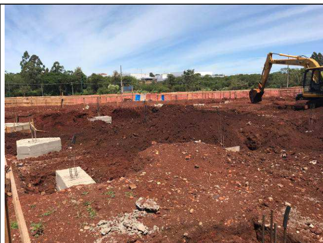
Figura 62C: Remoção do solo contaminado.