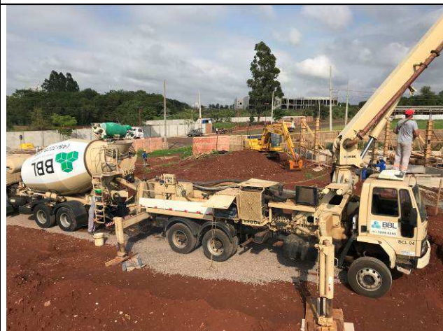
Figura 16C: Concretagem das vigas baldrames.