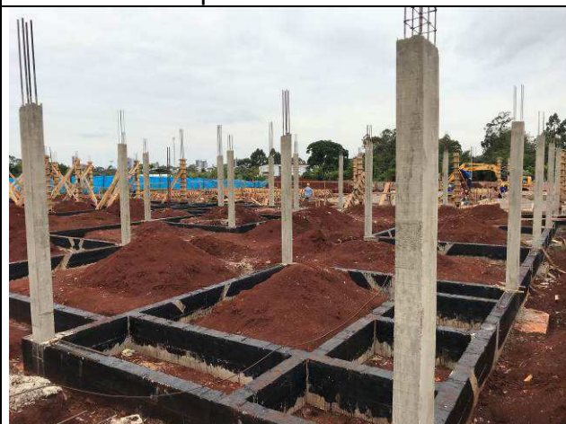
Figura 48C: Pilares concretados.