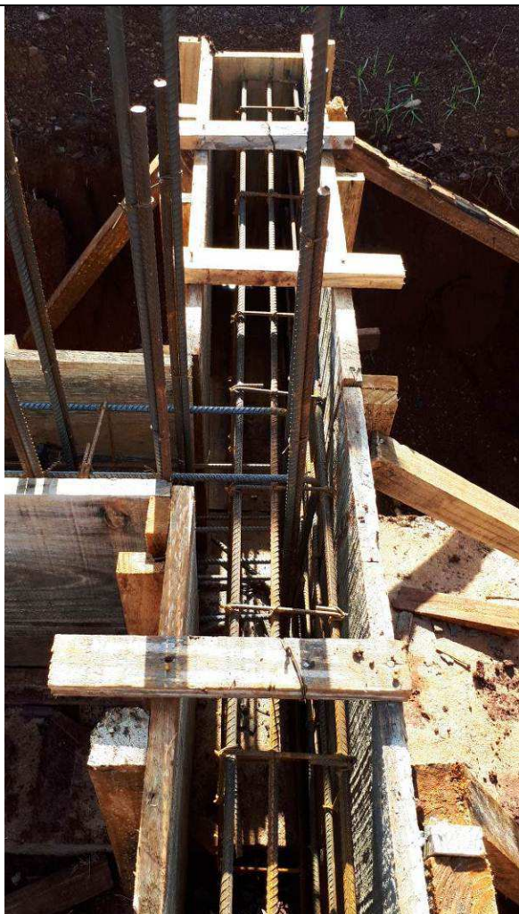
Figura 13C: Formas e armaduras das vigas baldrames.