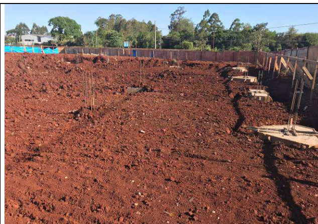
Figura 58C: Remoção do solo contaminado.