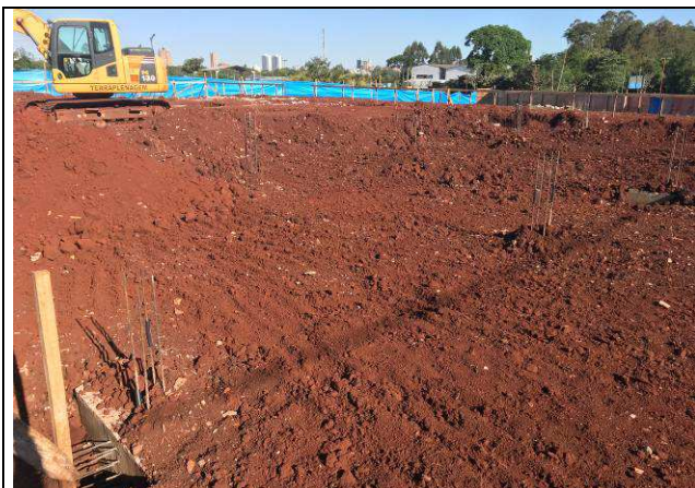
Figura 57C: Remoção do solo contaminado.