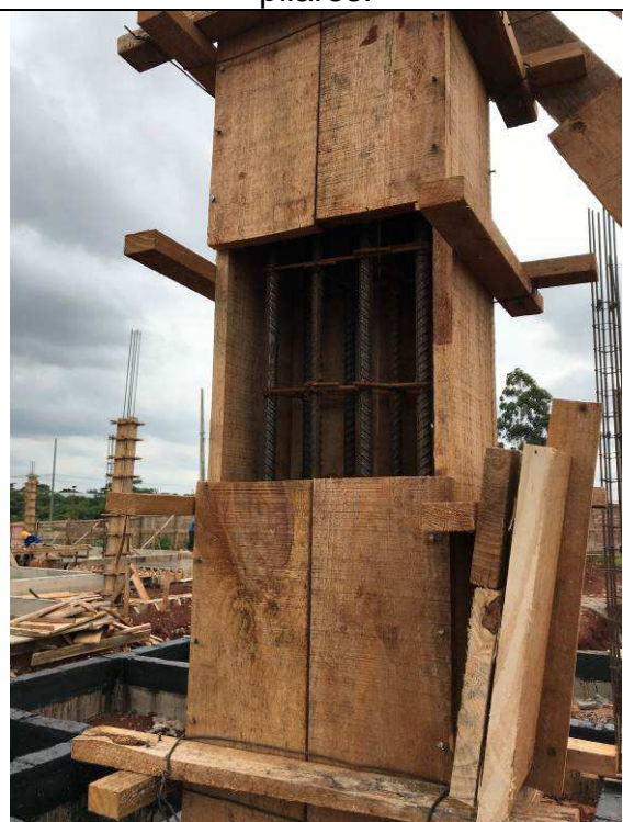
Figura 43C: Formas e armaduras dos pilares.