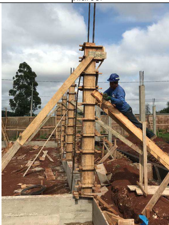
Figura 44C: Formas e armaduras dos pilares - pilar com console.