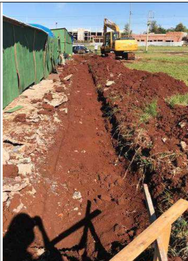
Figura 53C: Muro de fechamento - escavação para vigas baldrame.