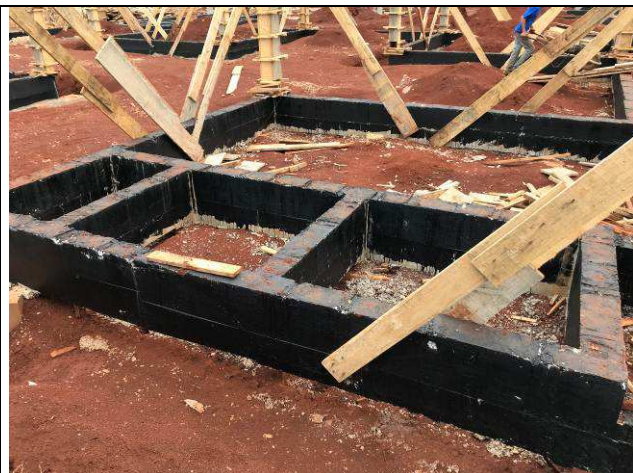
Figura 51C: Vigas baldrame impermeabilizadas.