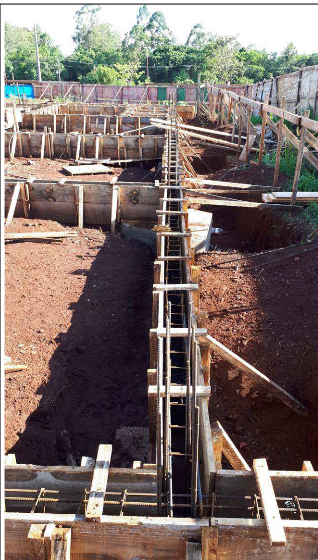
Figura 09C: Formas e armaduras das vigas baldrames.