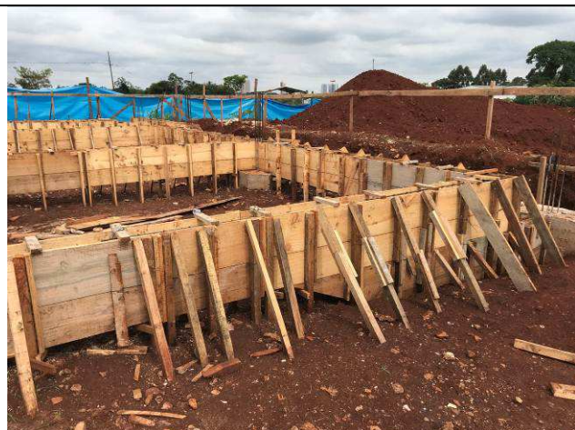
Figura 15C: Formas e armaduras das vigas baldrames.