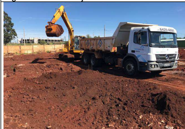
Figura 59C: Remoção do solo contaminado.