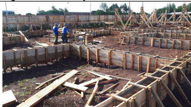
Figura 63C: Vigas baldrames na área de solo removido.