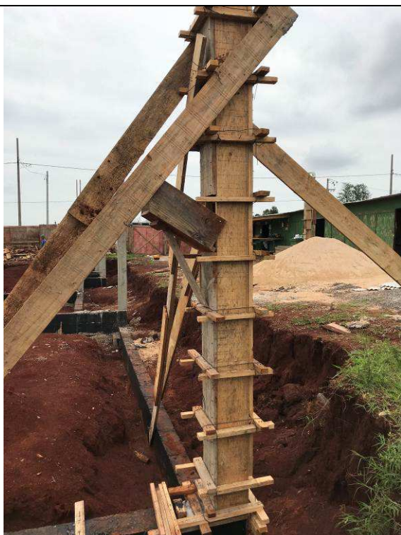
Figura 41C: Formas e armaduras dos pilares.