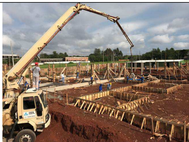
Figura 17C: Concretagem das vigas baldrames.