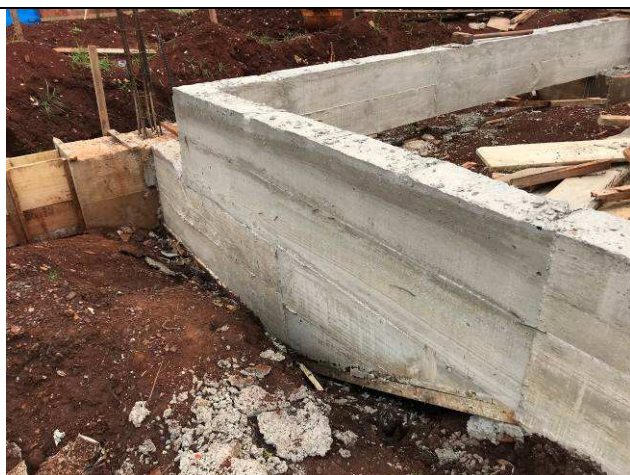
Figura 27C: Vigas baldrame concretadas.