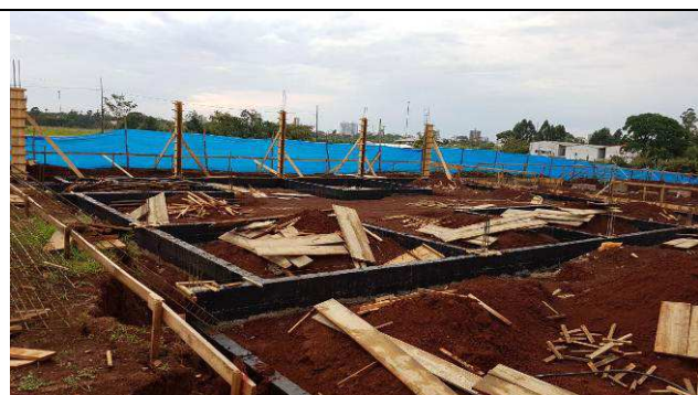
Figura 49C: Vigas baldrames impermeabilizadas.