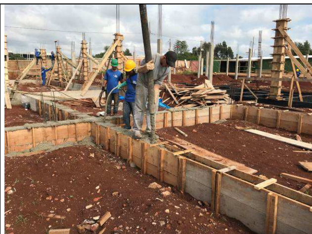
Figura 18C: Concretagem das vigas baldrames.