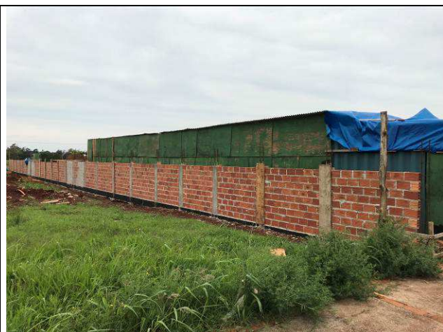
Figura 55C: Muro de fechamento - vigas baldrames, pilaretes e alvenaria.