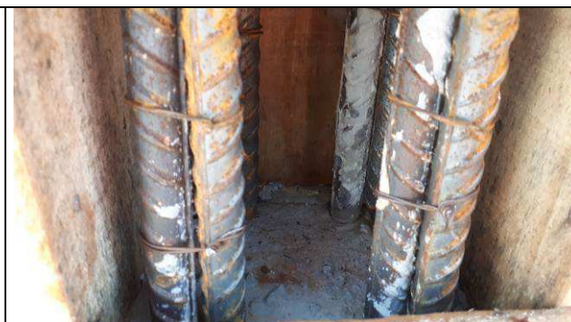
Figura 36C: Formas e armaduras dos pilares - arranques.