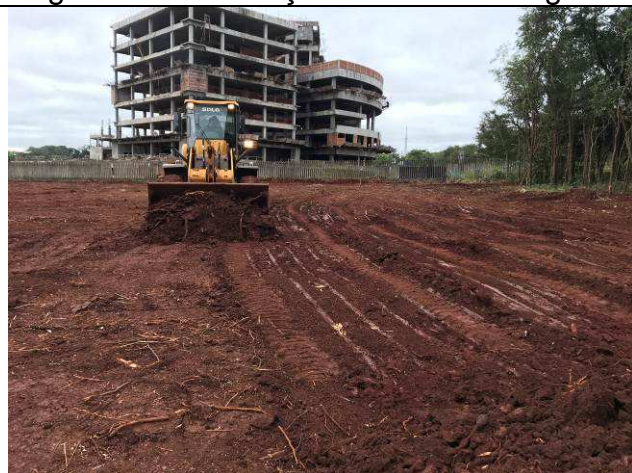
Figura 19C: Remoção da camada vegetal.