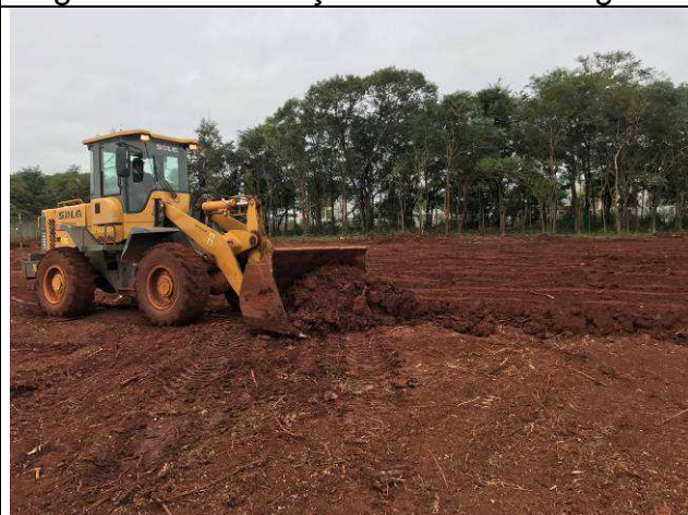
Figura 20C: Remoção da camada vegetal.