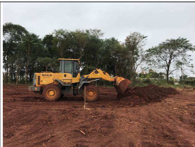
Figura 22C: Remoção da camada vegetal.