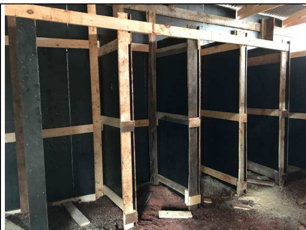
Figura 10C: Barracão de obra - banheiros.