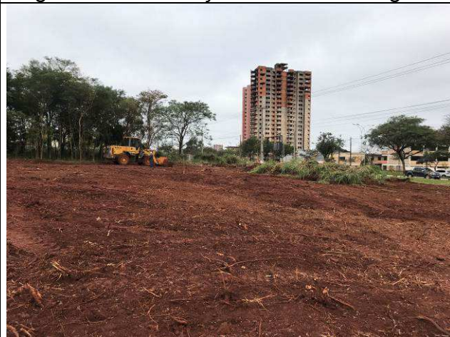
Figura 18C: Remoção da camada vegetal.