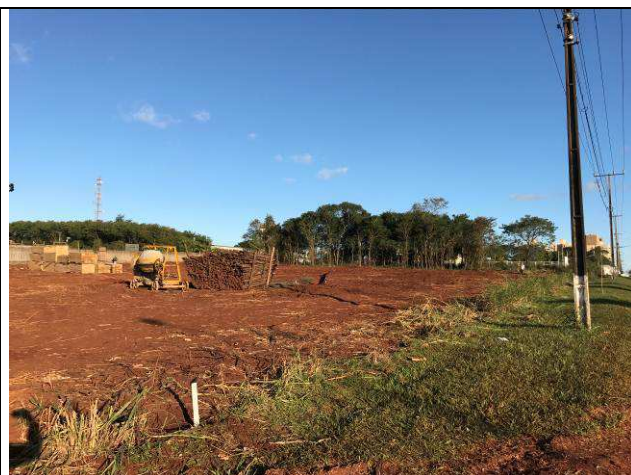
Figura 16C: Remoção da camada vegetal.