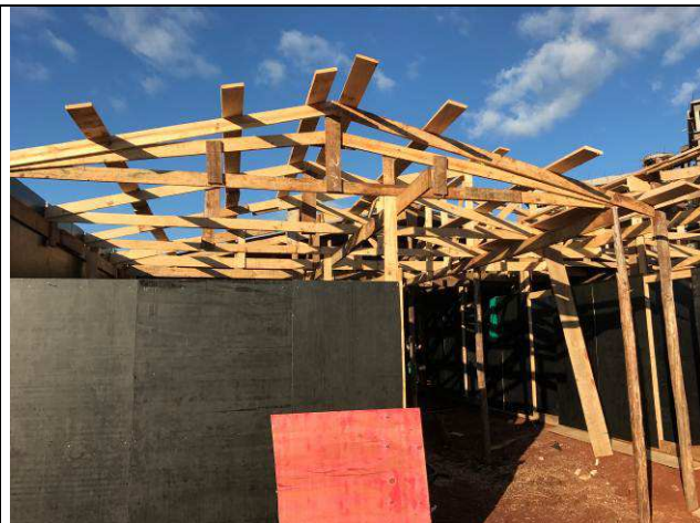
Figura 04C: Barracão de obra.