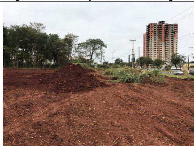
Figura 24C: Remoção da camada vegetal.