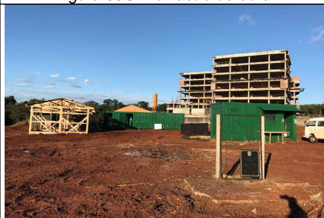
Figura 05C: Barracão de obra, container para depósito e para escritório.