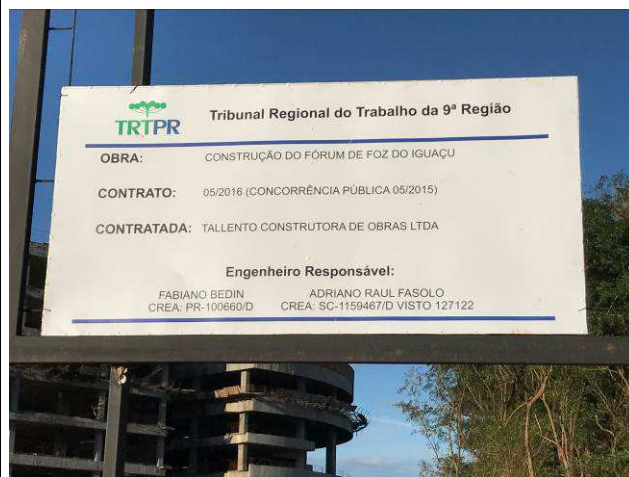
Figura 02C: Placa de obra.