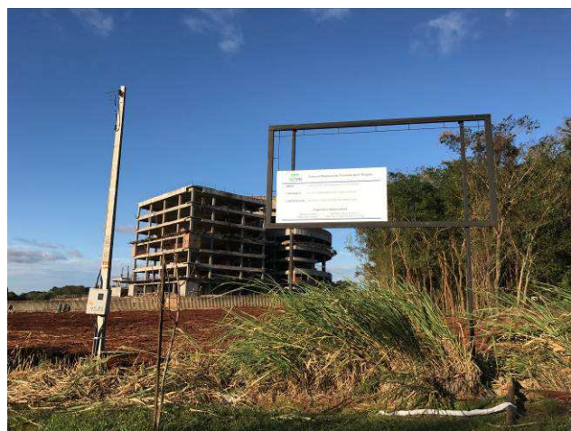
Figura 01C: Placa de obra.