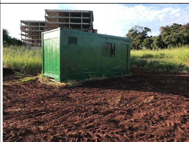
Figura 08C: Barracão de obra - container para escritório.