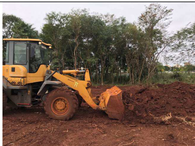
Figura 21C: Remoção da camada vegetal.