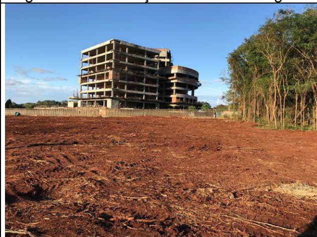
Figura 14C: Remoção da camada vegetal.