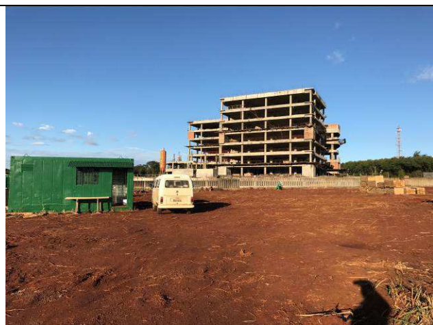
Figura 15C: Remoção da camada vegetal.