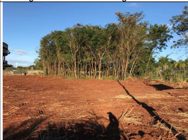
Figura 13C: Remoção da camada vegetal.