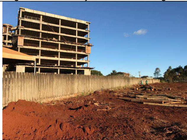
Figura 17C: Remoção da camada vegetal.