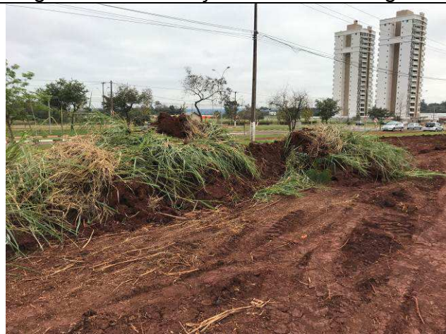
Figura 23C: Remoção da camada vegetal.