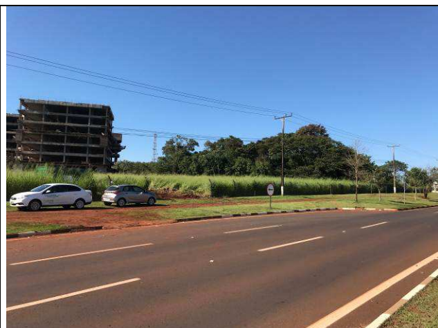
Figura 11C: Camada vegetal antes.