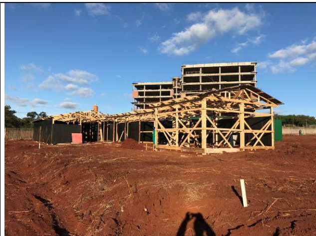
Figura 03C: Barracão de obra.