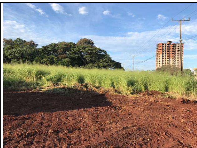
Figura 12C: Remoção da camada vegetal.