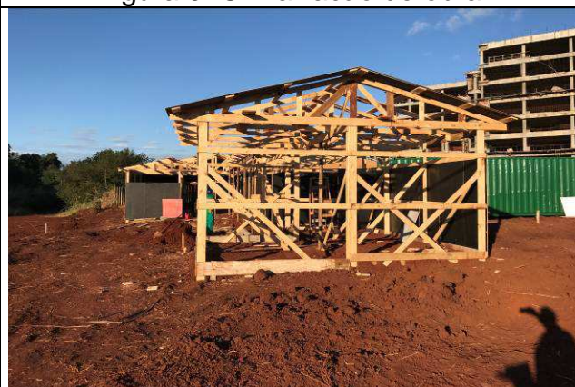
Figura 06C: Barracão de obra - refeitório.