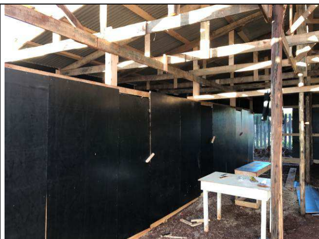
Figura 09C: Barracão de obra - alojamento.