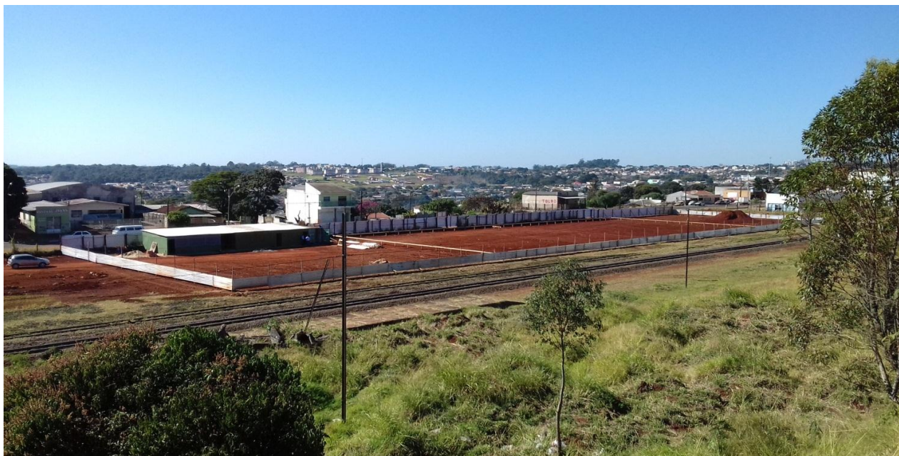
Vista panorâmica do canteiro de obras, a partir dos fundos do terreno

Considerando a instituição da Comissão de Recebimento e Fiscalização da CONSTRUÇÃO DO FÓRUM TRABALHISTA DE APUCARANA, objeto do Contrato Nº 34/2017, CP 04/2016, com efeitos através do despacho exarado pela Sra. Ordenadora da Despesa, os componentes abaixo elencados apresentam o relatório das vistorias realizadas, que tiveram como objetivo a fiscalização dos serviços executados pela Contratada, no período de 26/06/2017 até 26/07/2017 (primeira etapa).