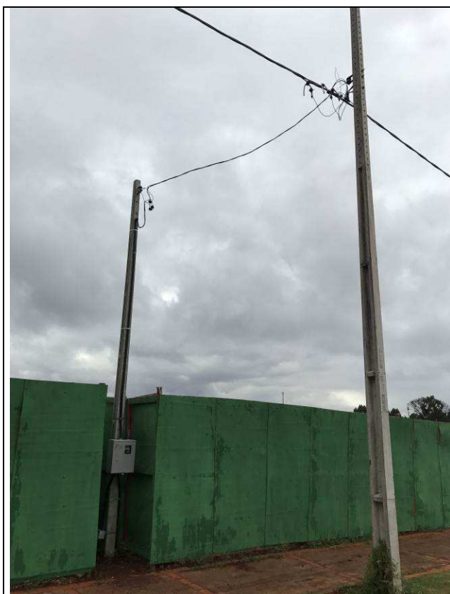
Figura 01E: Entrada provisória de energia elétrica.