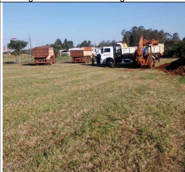
Figura 29C: Remoção da camada vegetal.