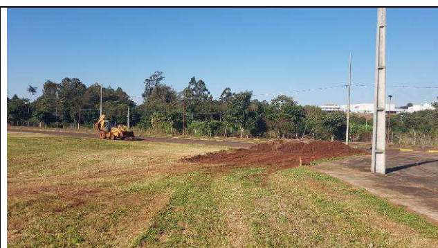
Figura 28C: Remoção da camada vegetal.