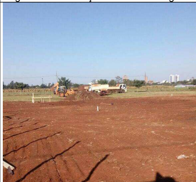
Figura 30C: Remoção da camada vegetal.