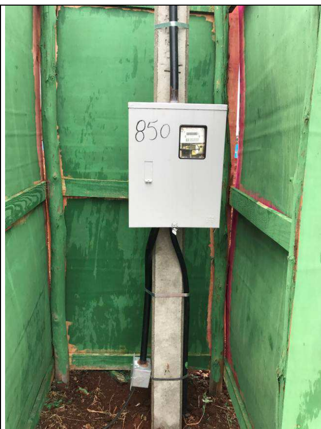
Figura 02E: Entrada provisória de energia elétrica.