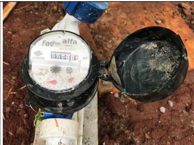
Figura 04C: Ligação de água.