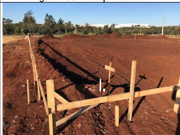
Figura 18C: Locação da obra.