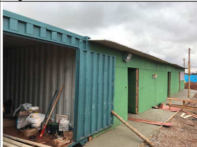
Figura 11C: Barracão de obra - vista externa.