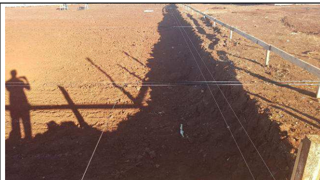
Figura 20C: Locação da obra.