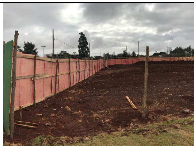
Figura 25C: Tapume - vista interna.