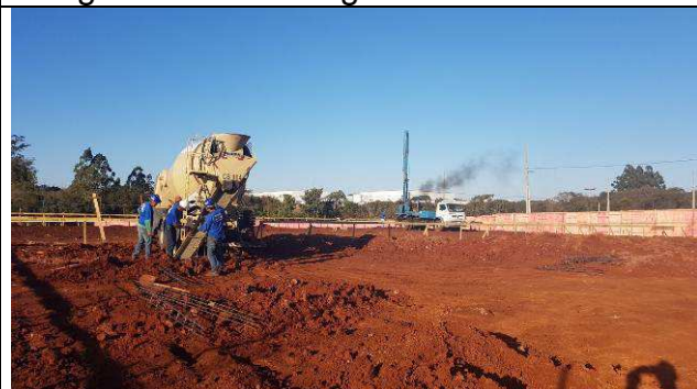
Figura 46C: Concretagem das estacas.