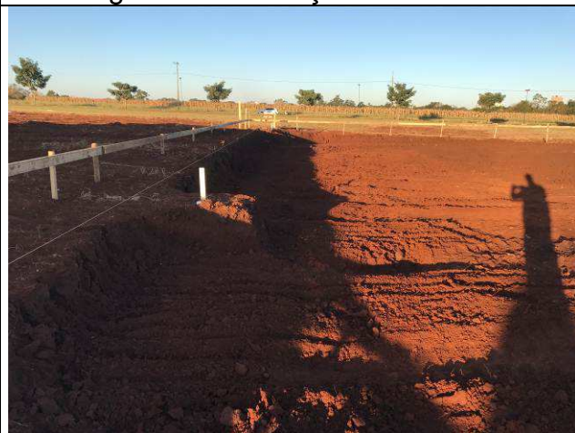
Figura 16C: Locação da obra.