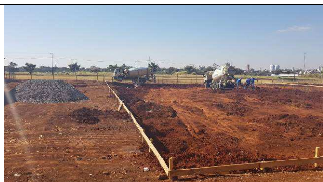
Figura 47C: Concretagem das estacas.