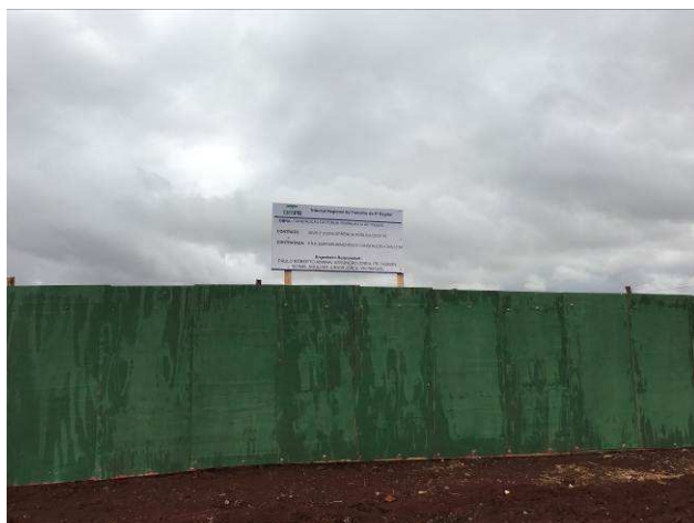
Figura 01C: Placa de obra.