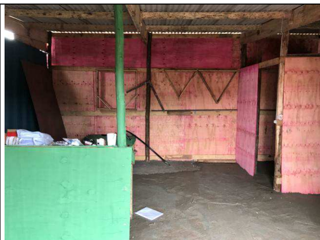
Figura 08C: Barracão de obra - para depósito e escritório da obra.