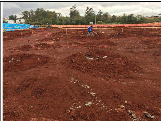
Figura 54C: Vista do platô da obra após escavações e concretagem das estacas.