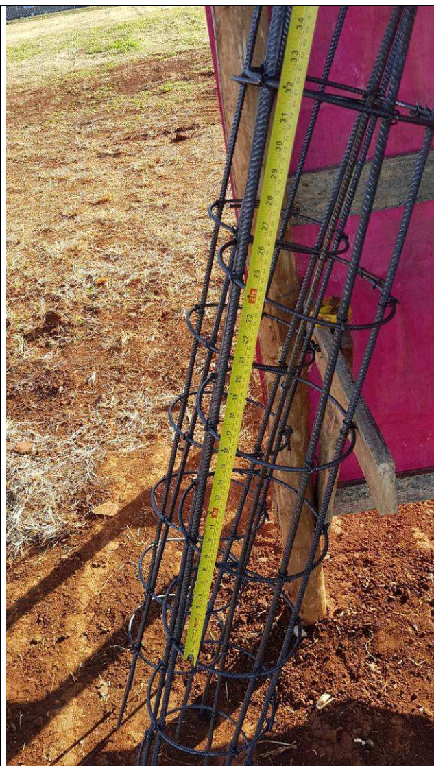
Figura 44C: Montagem das armaduras.