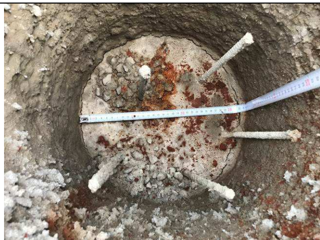
Figura 53C: Estacas concretadas - verificação dos diâmetros.