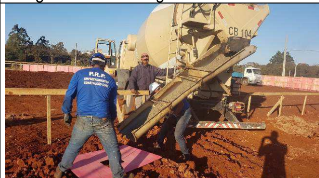
Figura 45C: Concretagem das estacas.