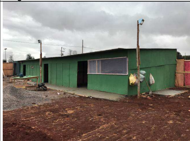
Figura 12C: Barracão de obra - vista externa.