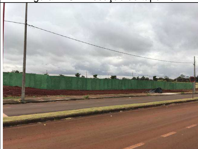
Figura 24C: Tapume - vista externa - Rua Estefano Secchi.