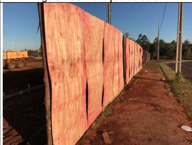
Figura 22C: Execução do tapume.