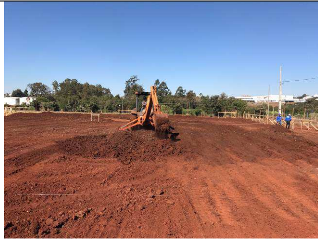
Figura 37C: Execução da terraplenagem.