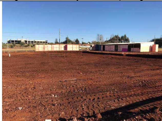
Figura 35C: Execução da terraplenagem.