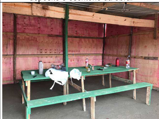
Figura 10C: Barracão de obra - refeitório.