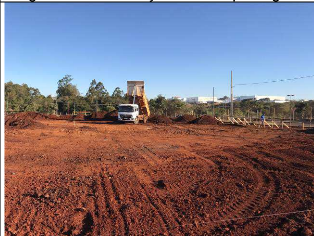
Figura 34C: Execução da terraplenagem.