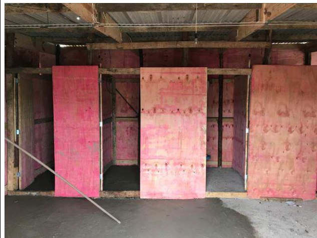
Figura 05C: Barracão de obra - sanitários.