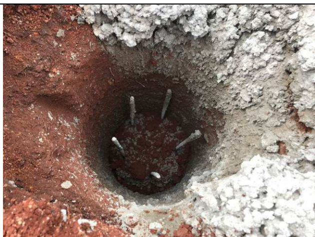
Figura 51C: Estacas concretadas.