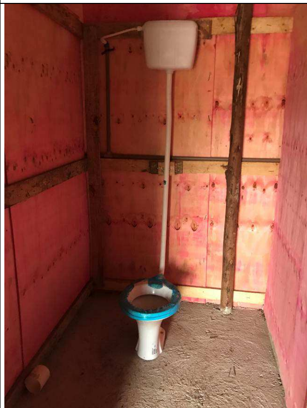
Figura 06C: Barracão de obra - sanitários.