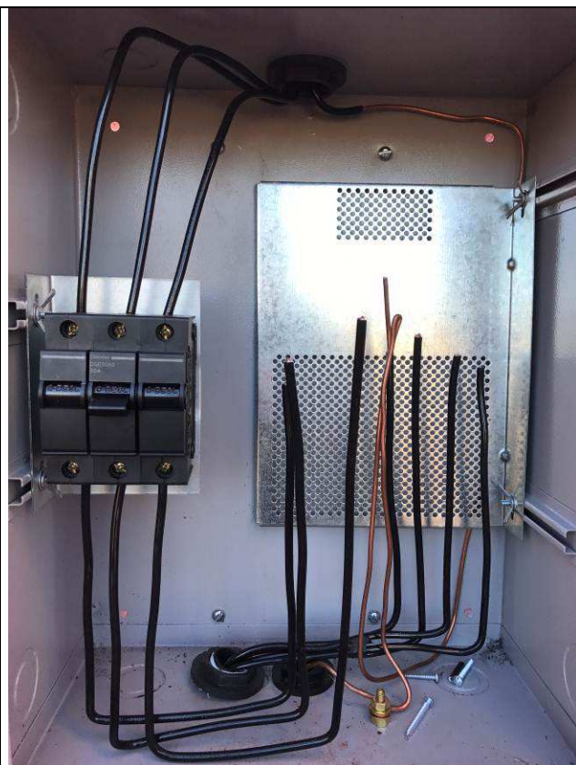
Figura 03E: Entrada provisória de energia elétrica - disjuntor antes da ligação da Copel.