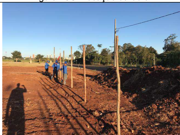
Figura 21C: Execução do tapume.