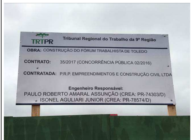
Figura 02C: Placa de obra.