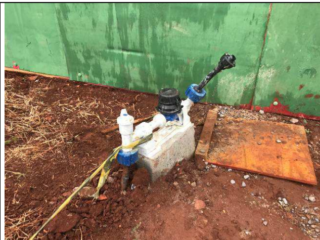
Figura 03C: Ligação de água.