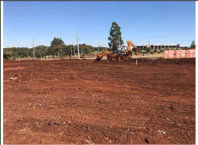
Figura 38C: Execução da terraplenagem.