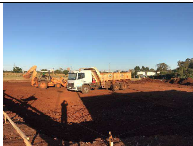
Figura 32C: Execução da terraplenagem.