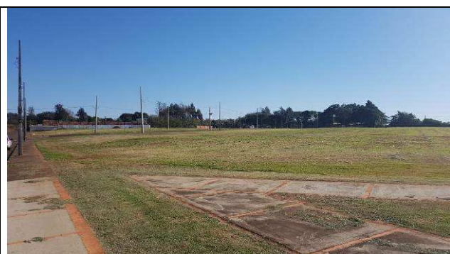
Figura 27C: Camada vegetal antes.