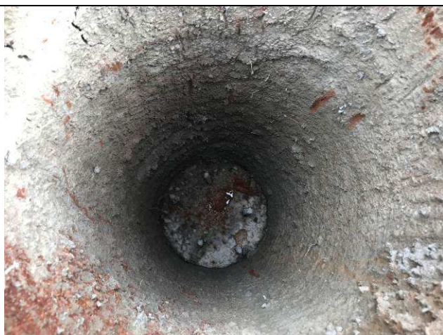
Figura 49C: Estacas concretadas.