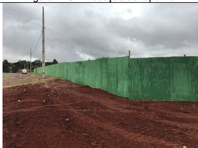
Figura 23C: Tapume - vista externa - Av. Zilda Arns.