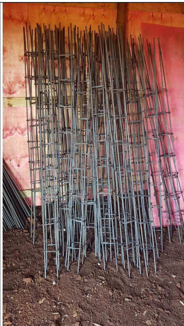
Figura 43C: Montagem das armaduras.