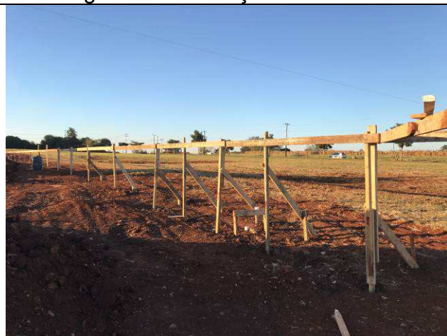
Figura 15C: Locação da obra.