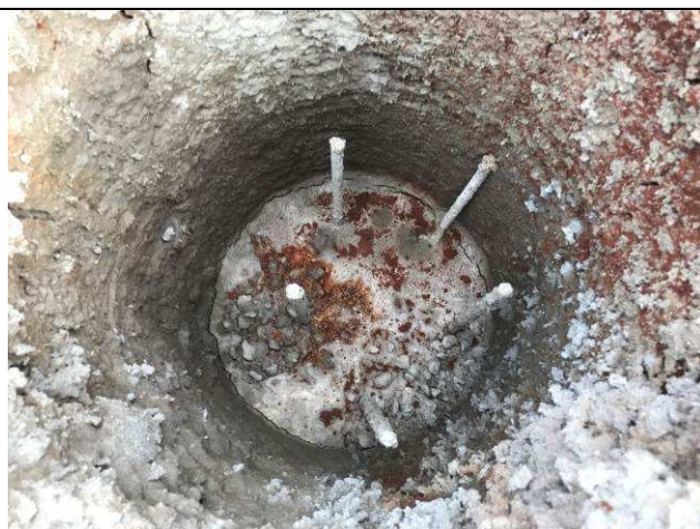
Figura 52C: Estacas concretadas.