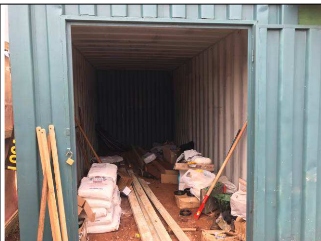
Figura 07C: Barracão de obra - container para depósito de materiais miúdos.