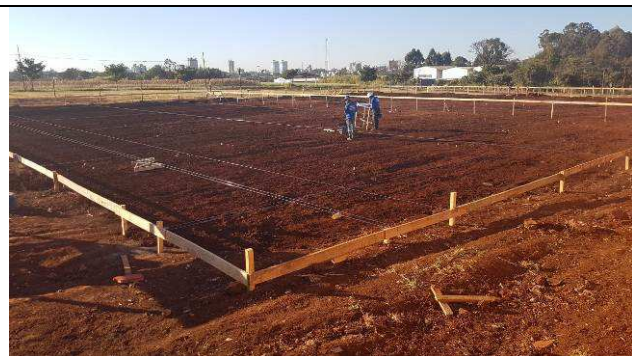
Figura 19C: Locação da obra.