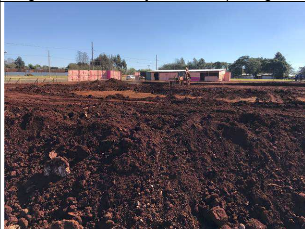
Figura 36C: Execução da terraplenagem.