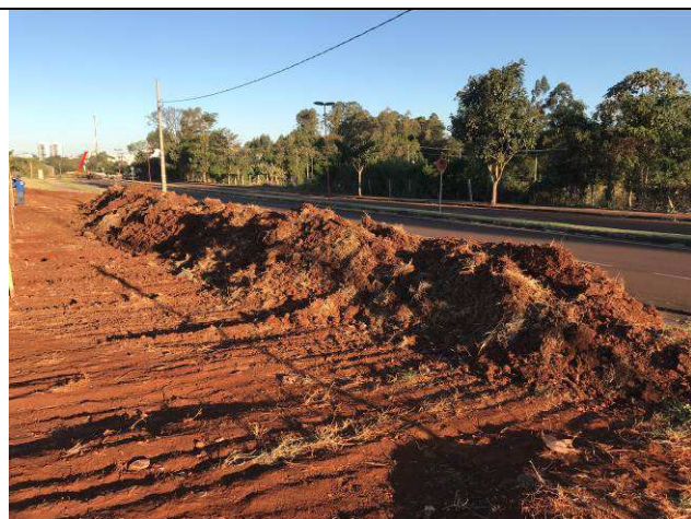
Figura 31C: Remoção da camada vegetal.