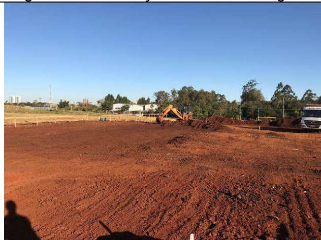
Figura 33C: Execução da terraplenagem.