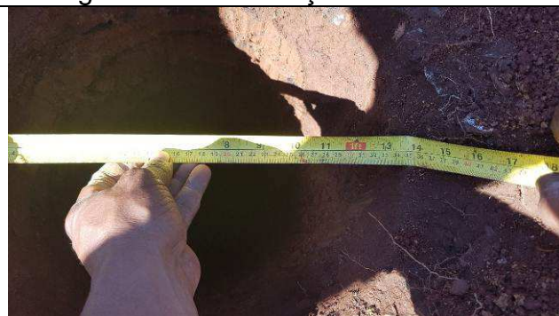
Figura 41C: Perfuração das estacas.