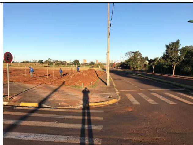
Figura 14C: Locação do terreno.