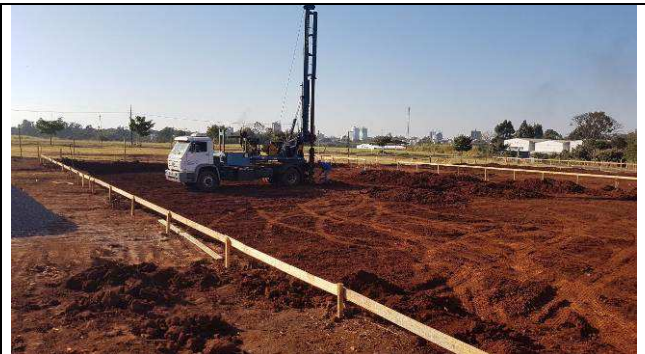
Figura 40C: Perfuração das estacas.