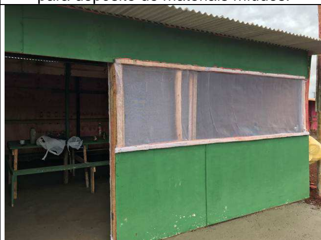
Figura 09C: Barracão de obra - refeitório.