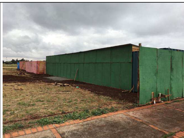
Figura 26C: Tapume - fundos.