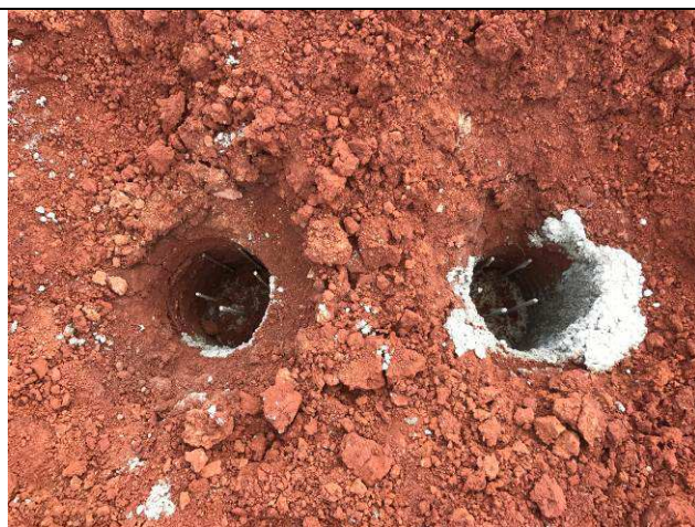
Figura 50C: Estacas concretadas.