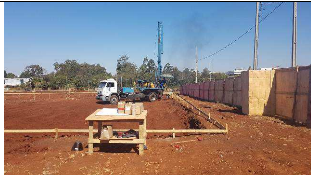
Figura 39C: Perfuração das estacas.