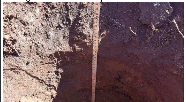
Figura 42C: Perfuração das estacas.