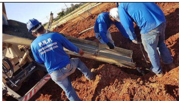
Figura 48C: Concretagem das estacas.