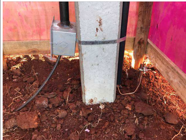
Figura 04E: Entrada provisória de energia elétrica - base do poste.