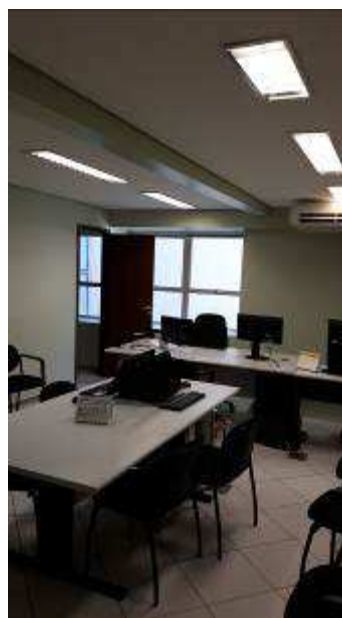
VISTA GERAL - SALAS DE AUDIÊNCIAS