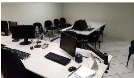
VISTA GERAL - SALAS DE AUDIÊNCIAS