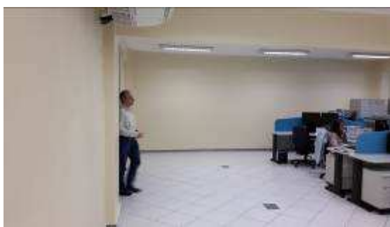
VISTA GERAL - SECRETARIAS COM ÁREAS DISPONÍVEIS