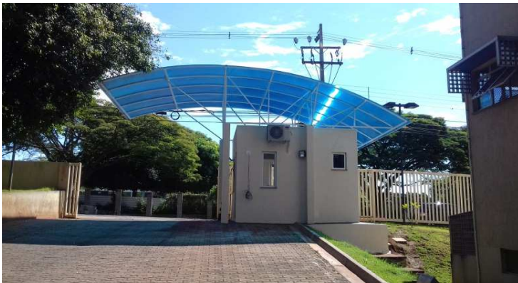
Figura 1: Cobertura da guarita, em policarbonato alveolar azul