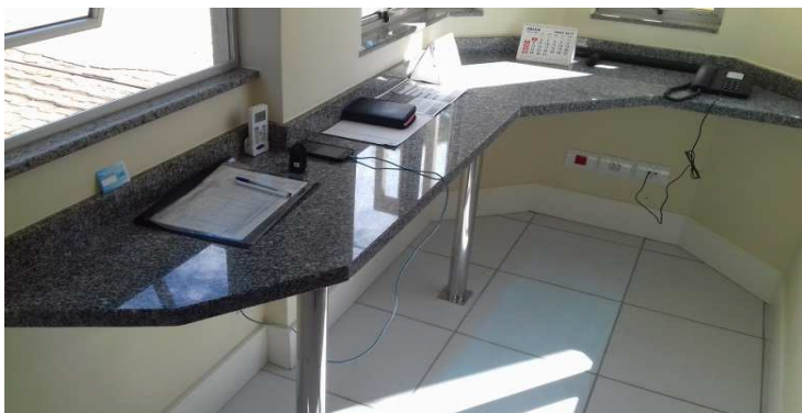
Figura 3: Balcão de atendimento com os pés metálicos instalados