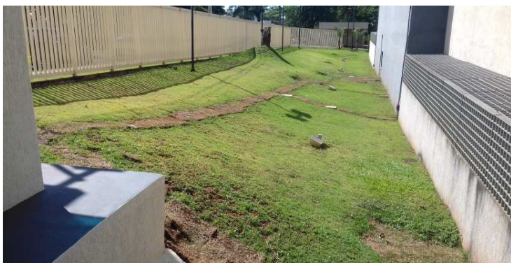
Figura 5: Faixas de grama plantadas onde foi escavado