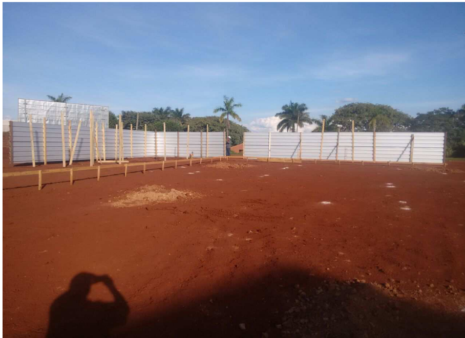
Figura 4: Tapume instalado defronte à avenida Paranapanema