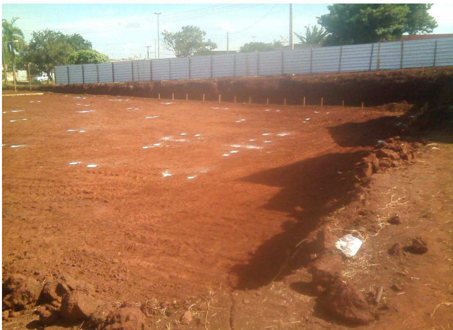
Figura 6: Gabarito em madeira - Locação de obra. Na mesma imagem, tapume na rua lateral.