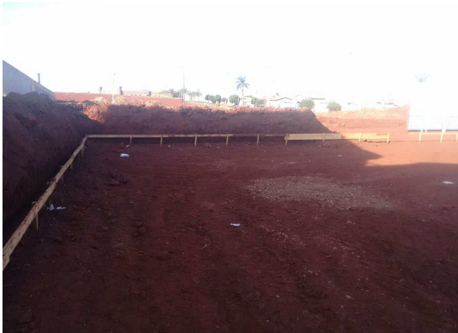
Figura 6: Gabarito em madeira - Locação de obra