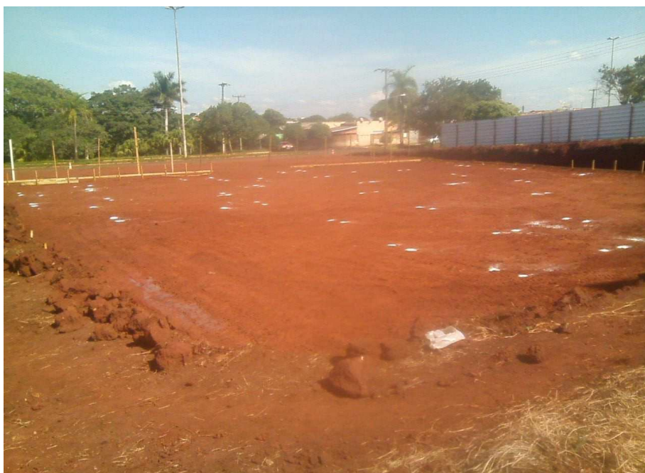
Figura 5: Serviço de gabarito e locação das estacas