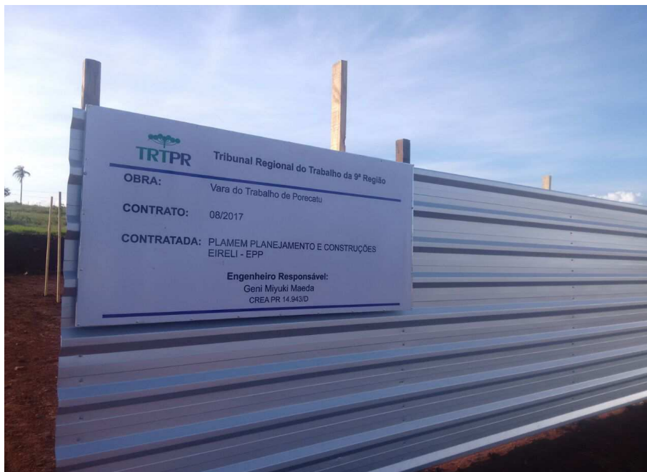
Figura 1: Placa de obra - Instalada defronte à avenida Paranapanema