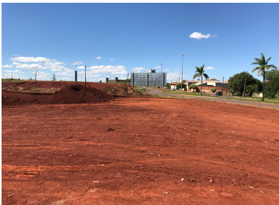
Figura 7: Terraplenagem executada nas áreas do estacionamento e onde serão executados os prédios principal e arquivo.