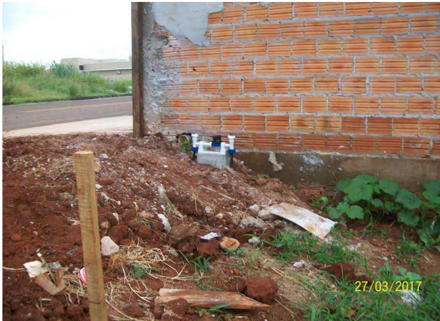
Figura 2: Placa de obra - Cavalete com registro de 3/4", para instalação de hidrante