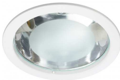
Figura 10 – Luminárias para lâmpadas tipo bulbo