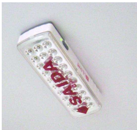
Figura 12 – Luminárias de emergência