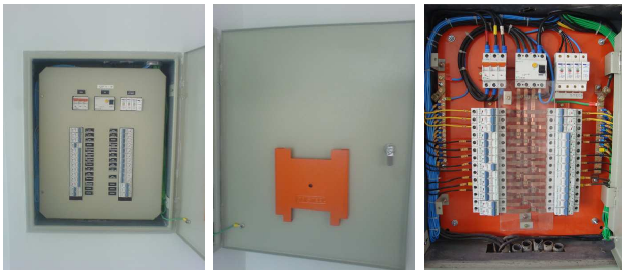
Figura 2 – Quadro elétrico