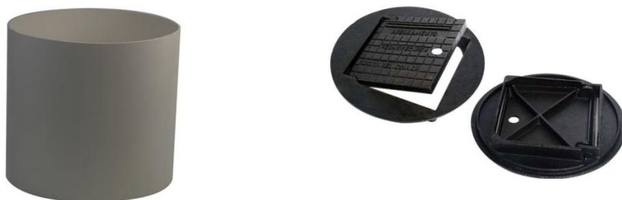
Figura 19 – Caixa de inspeção de aterramento