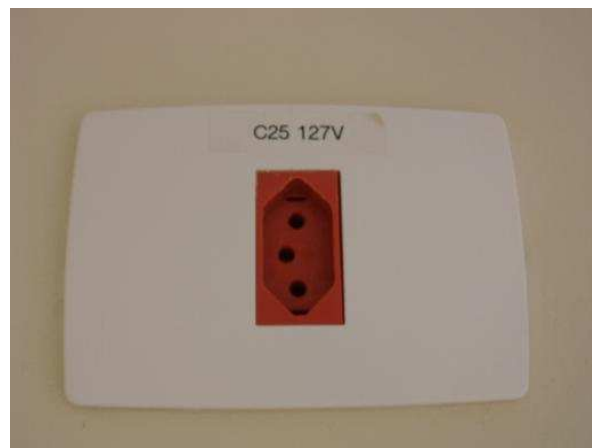
Figura 7 – Tomadas comum e estabilizada