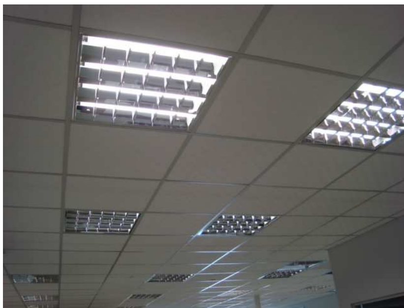
Figura 9 – Luminárias embutidas - 4 x LED T8