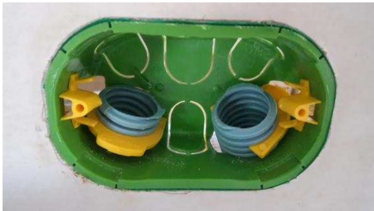
Figura 1 – Caixa de ligação em drywall