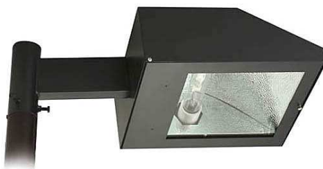
Figura 13 – Luminárias externa