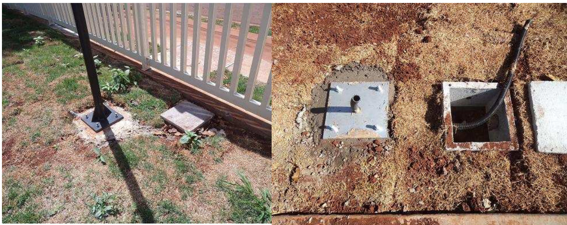
Figura 14 – Base para fixação das luminárias externas