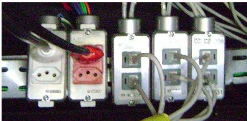
Figura 6 – Padrão genérico (tomadas sobre o forro)