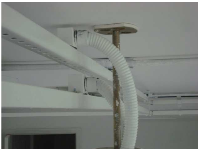
Figura 18 – Derivação para circuitos