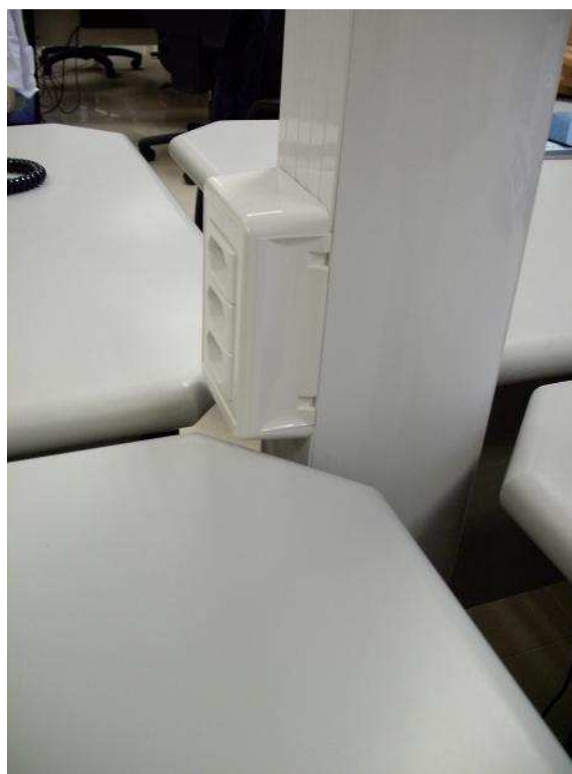
Figura 5 – Poste técnico (Observar interrupção dos porta equipamentos para encaixe da mesa)