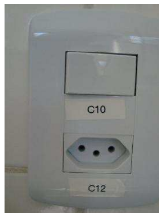
Figura 4 - Identificação de condutores, tomadas e interruptores