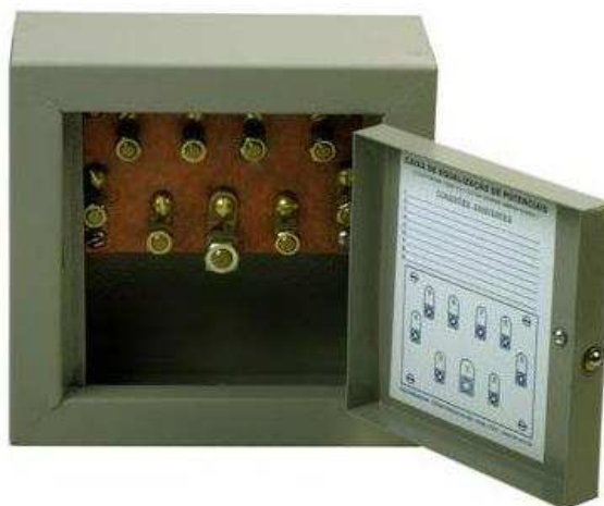
Figura 20 – Caixa de equipotencialização (BEP)