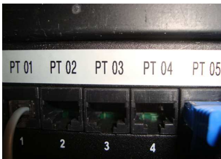
Figura 15 – Patch panel com identificação de pontos