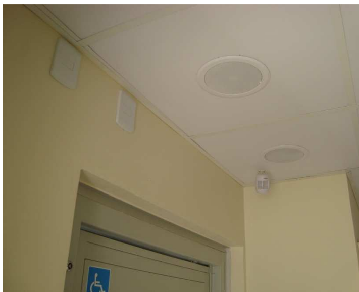
Figura 17 – Futura instalação de sonorização