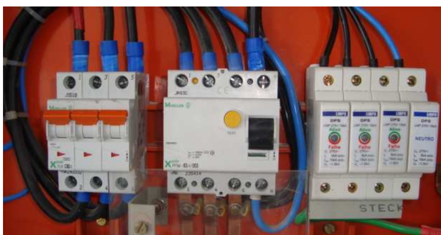
Figura 3 – Disjuntor, dispositivo DR e DPS em quadro