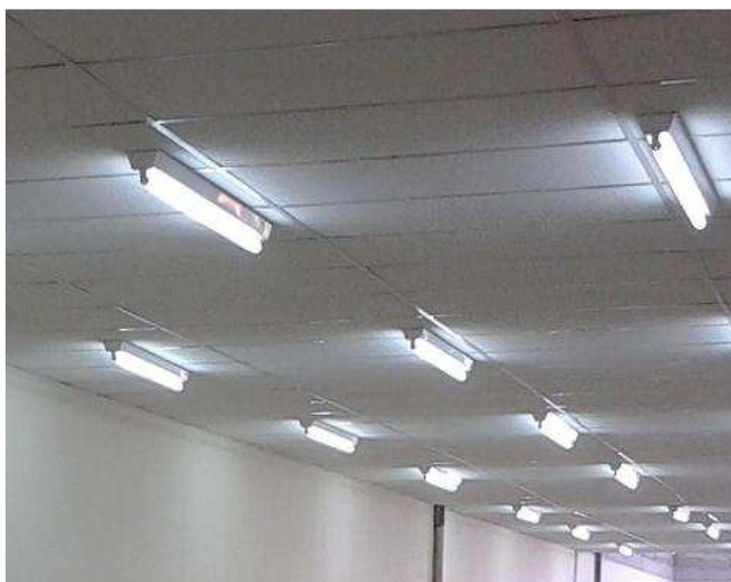
Figura 11 – Luminárias comercial LED 1x18 W