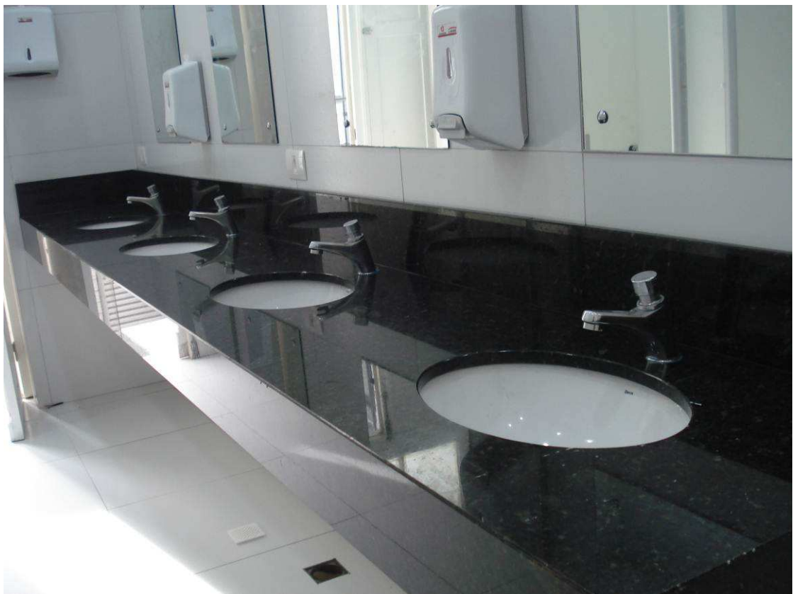
Figura 01 – Banheiro Feminino

casarão - gabinete, ambulatório, banheiros), 100,00% do item 05 (Instalação de copa na sobreloja - edifício Rio Branco), 0,00% do item 06 (Sala dos motoristas - 1º subsolo), 30,49% do item 07 (Instalação do gás), 0,00% do item 08 (Substituição de portas - plenário, gabinete vice-presidência e enfermagem), 12,97% do item 09 (Pintura em corredores e gabinetes - torre do edifício rio branco), 27,18% do item 10 (Aplicação de azulejo e pintura das copas - torre do edifício rio branco), 0,00% do item 11 (Adequação do painel de vidro - plenário II), 0,00% do item 12 (Elevatória de esgoto), 0,00% do item 13 (Elétrica vestiários dos motoristas), 40% do item 14 (Elétrica - copas térreo casarão e sobreloja torre), e 0,00% do item 15 (Elétrica gabinete sala de pericias - 2º piso casarão). Porém, a Contratada executou 32,12% do valor previsto para o item 01, 14,98% do item 02, 57,85% do item 03, 0,49% do item 04, 54,96% do item 05, 15,16% do item 06, 50,23% do item 07, 0,00% do item 08, 38,90% do item 09, 27,18% do item 10, 0,00% do item 11, 0,00% do item 12, 9,31% do item 13, 81,21% do item 14, e 0,00% do item 15.