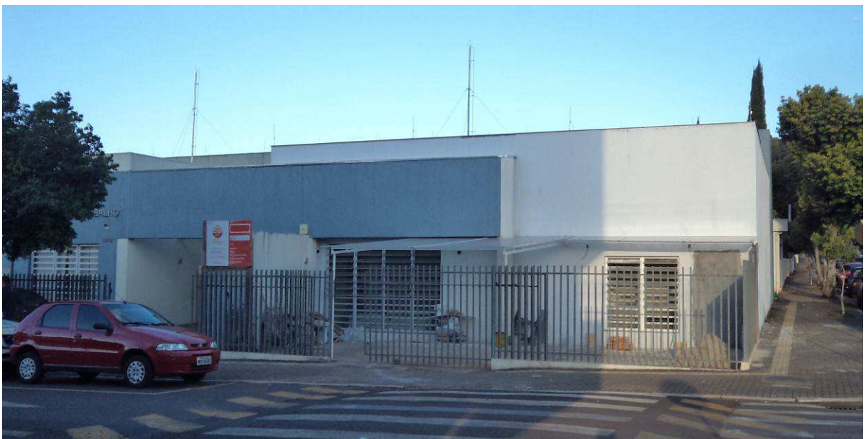
Figura 1 – Vista externa.

Pisos internos / externos), 59,03% do item 12 (Civil Obra 01 - Corrimão, rodapés, soleiras e peitoris), 57,46% do item 13 (Civil Obra 01 - Instalações hidrossanitárias), 83,95% do item 14 (Civil Obra 01 - Ar condicionado), 40,20% do item 15 (Civil Obra 01 - Pinturas), 53,40% do item 16 (Civil Obra 01 - Serviços complementares e limpeza da obra), 5,49% do item 03 (Civil Obra 02 - Demolições), 0,00% do item 05 (Civil Obra 02 - Paredes e painéis), 0,00% do item 06 (Civil Obra 02 - Esquadrias), 7,68% do item 09 (Civil Obra 02 - Forro), 0,00% do item 10 (Civil Obra 02 - Revestimentos internos / externos), 0,00% do item 11 (Civil Obra 02 - Pisos internos / externos), 0,00% do item 12 (Civil Obra 02 - Corrimão, rodapés, soleiras e peitoris), 0,00% do item 13 (Civil Obra 02 - Instalações hidrossanitárias), 9,56% do item 15 (Civil Obra 02 - Pinturas), 0,00% do item 16 (Civil Obra 02 - Serviços complementares e limpeza da obra), 67,79% do item 1 (Instalações Elétricas, Lógicas E SPDA - Instalações elétricas), 47,43% do item 2 (Instalações Elétricas, Lógicas E SPDA - Instalações lógicas, cftv, telefonia, alarme), e 70,14% do item 3 (Instalações Elétricas, Lógicas E SPDA - Sistema de proteção contra descargas atmosféricas).