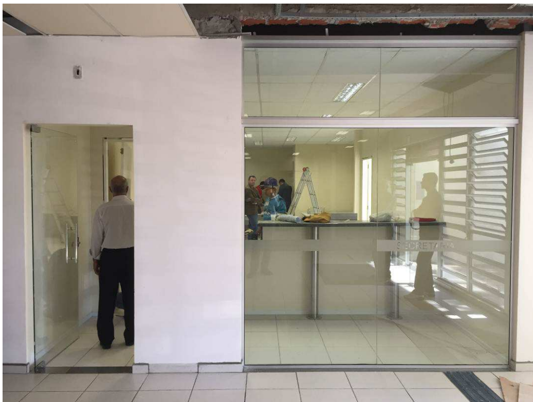
Figura 2 – Vista interna - entrada da 2ª Vara.