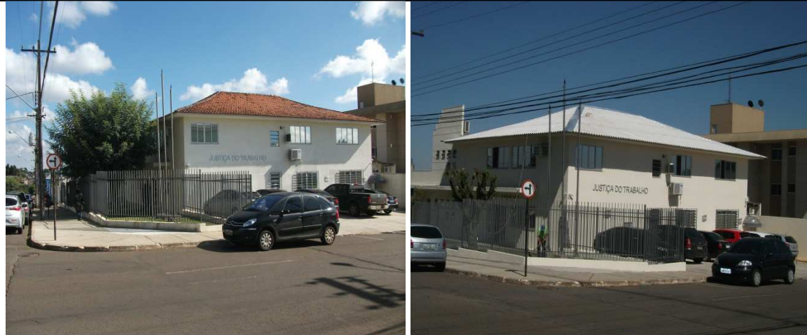
Imagens antes e depois da instalação do passadiço