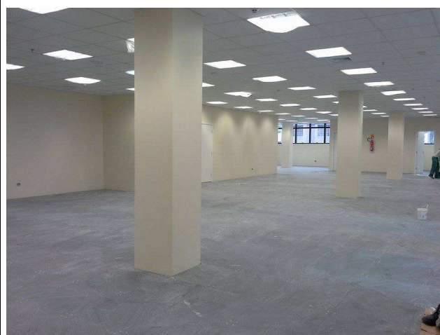
Figura 08: gesso acartonado – pintura látex acrílico.