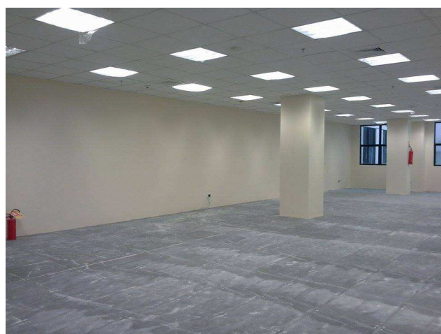
Figura 03: vista geral – pintura aplicada em alvenarias e pilares.