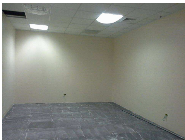
Figura 05: vista geral sala de reuniões.