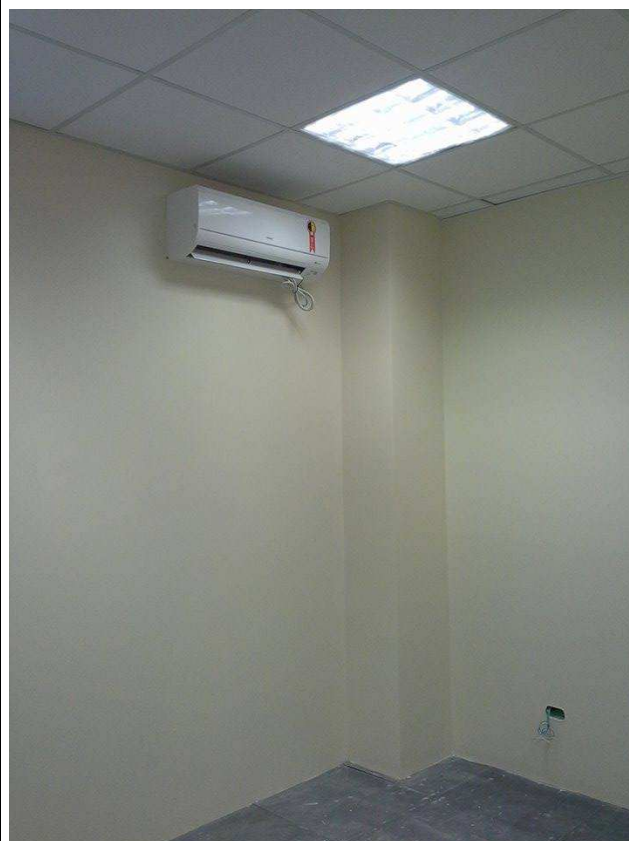
Figura 10: equipamento ar condicionado