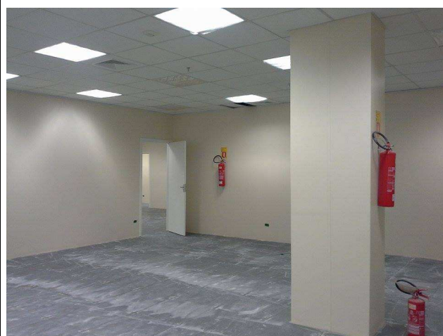
Figura 04: extintores e esquadria de madeira.