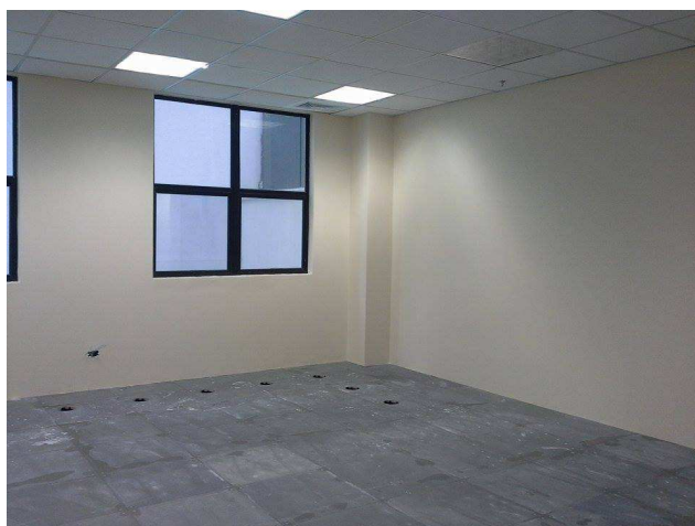
Figura 01: pintura látex acrílico aplicada em alvenarias

Considerando a instituição da Comissão de Recebimento e Fiscalização da Reforma no Edifício Corporate Emiliano, 480, conjunto 21 – Curitiba/PR , objeto do Contrato Nº 14/2014, com efeitos através do despacho exarado pela Sra. Ordenadora da Despesa, os componentes abaixo elencados apresentam o relatório das vistorias realizadas, que tiveram como objetivo a fiscalização dos serviços executados pela Contratada, no período de 07/04/2014 (data de início da obra) até 06/05/2014.