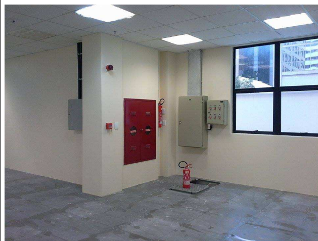
Figura 02: fornecimento e instalação de extintores.