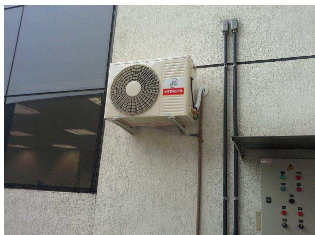
Figura 9: equipamento ar condicionado.