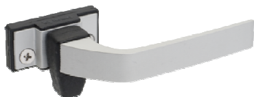
Trinco em alumínio Fermax ou similar